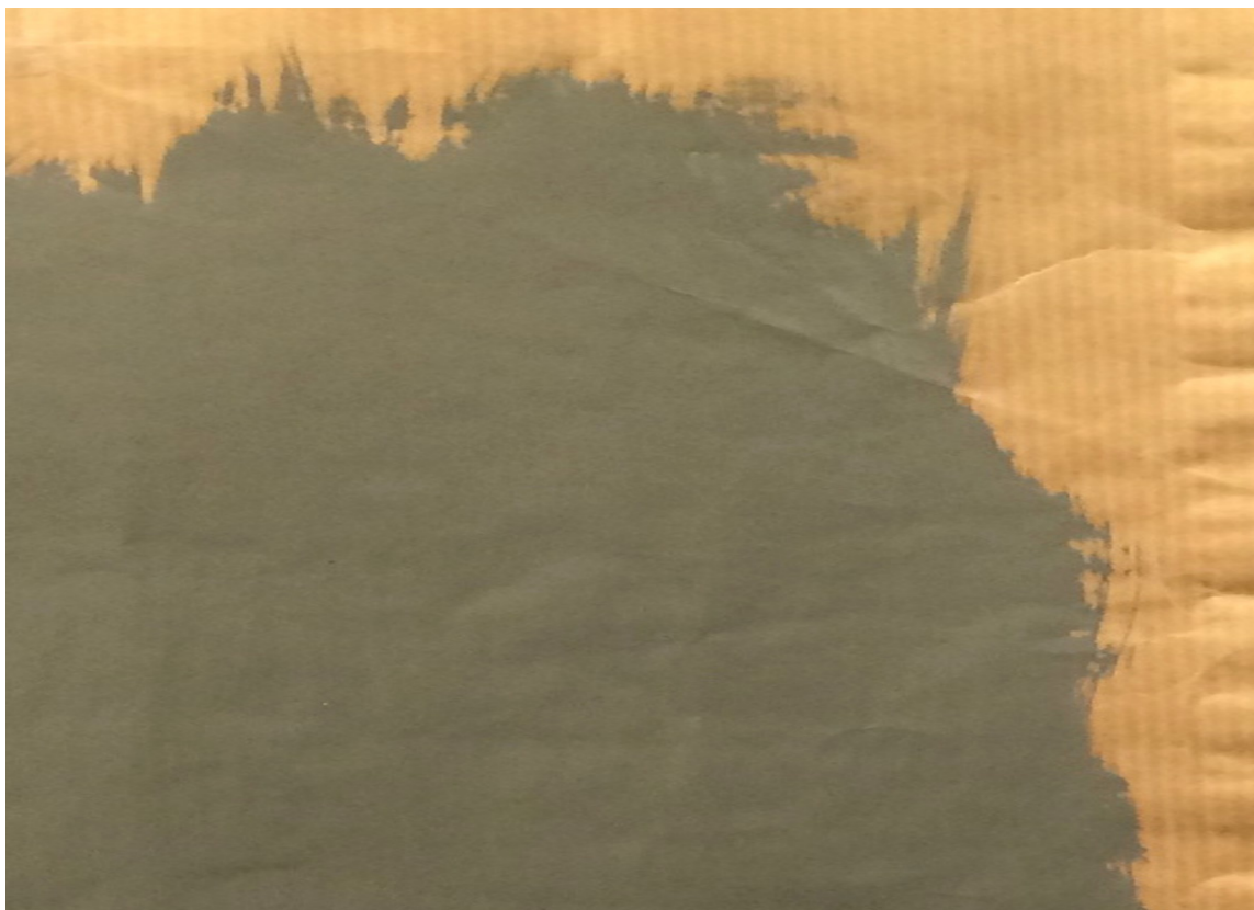
PÅVIRKER Den gulaktige papirfargen påvirker den malte fargen i stor grad. Greit å ha i bakhodet!