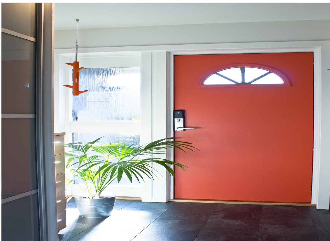
TØFT: Med rød dør og sort gulv, får entréen en tøff look.