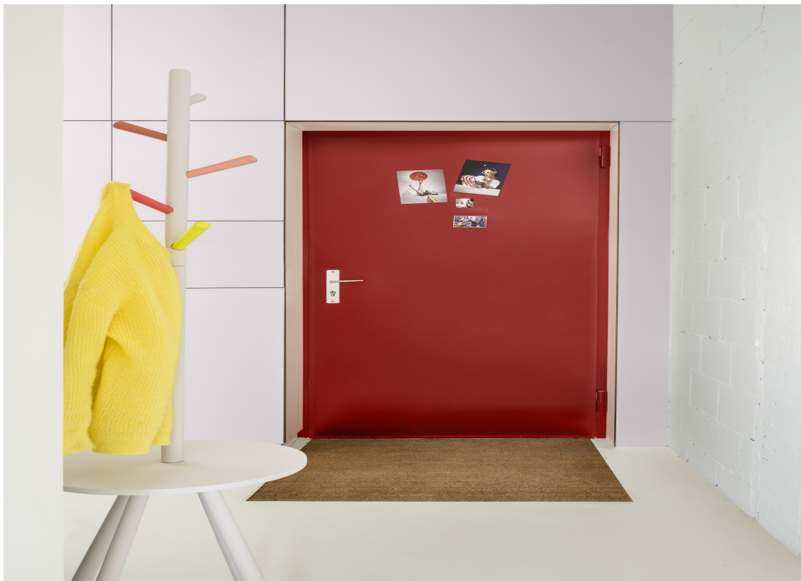
BLIKKFANG: En ellers nøytral og forsiktig gang, får helt nytt liv med en dør i en sprek farge.

Her kan du lese mer om – og få fremgangsmåten til – hvordan du maler døren.