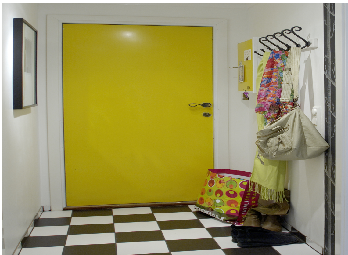
ENERGI: Det er umulig å ikke få litt ekstra energi om denne entréen følger deg ut om morgenen.