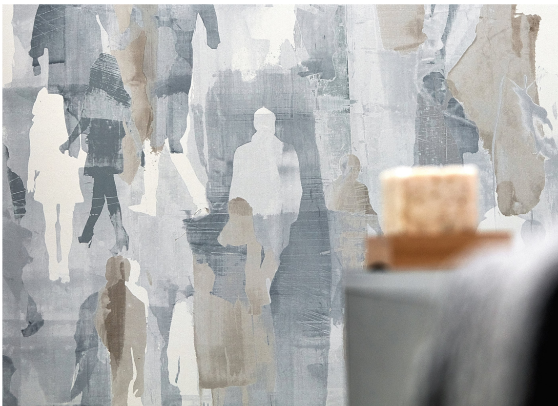
MORSOMT: Noen diffuse mennesker fra Harlequin skal ønske velkommen hos Gro.