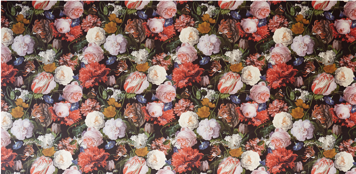
BLOMSTERELSKER: Blomstertapetet fra Eijffinger har alt Bente ønsker seg i gangen.