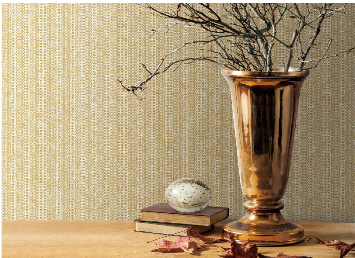
SLITESTERK: Eva går for Alpha fordi den er kraftig og solid, gylden og varm.