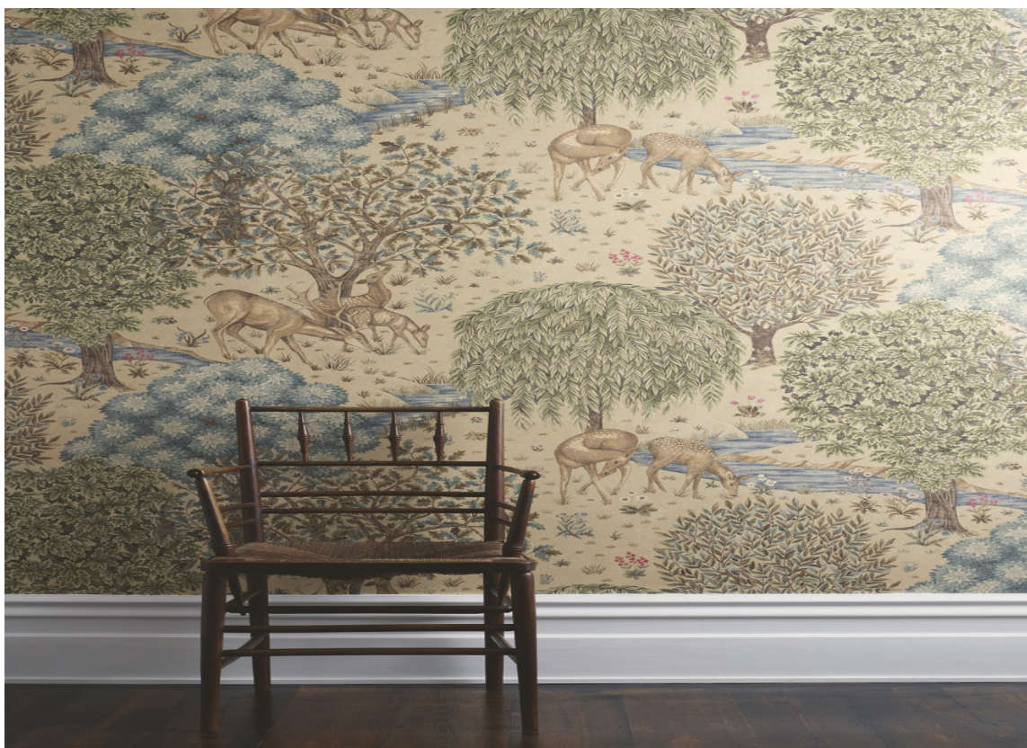
ATMOSFÆRE: Camilla velger The Brook fra Morris for å skape riktig atmosfære.