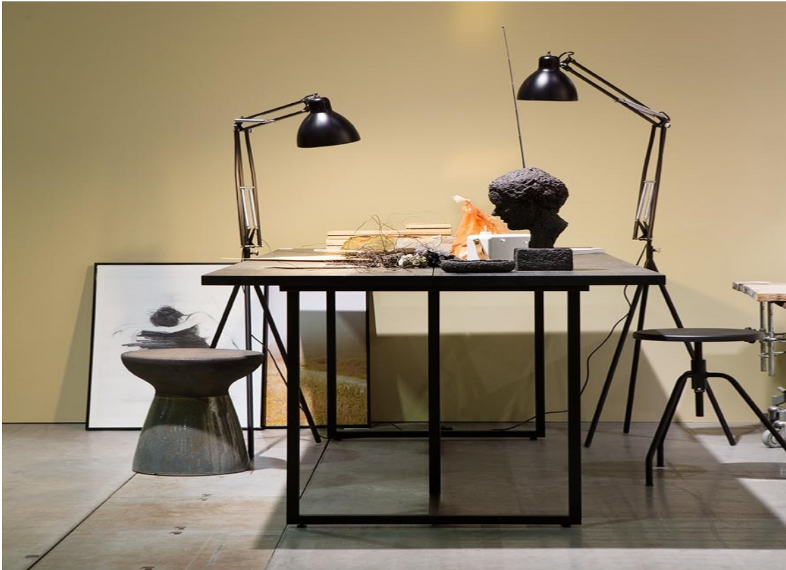
VERKSTED: En rå og uhøvlet stil for den som trives i en atmosfære av skapende og kreative prosesser.