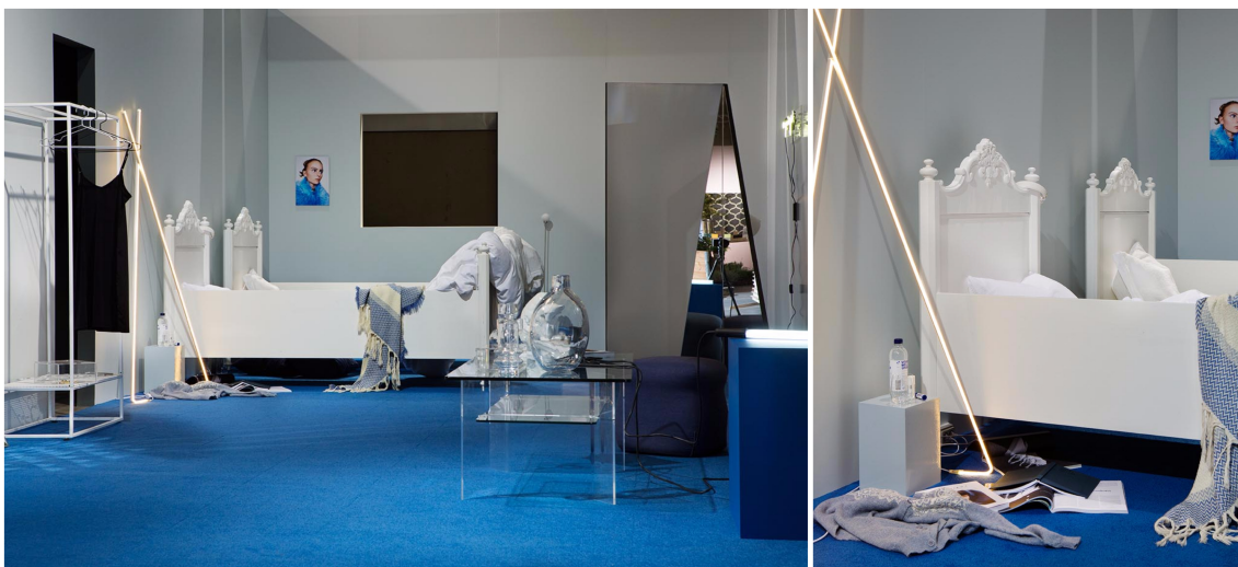
FUTURISTISK: En selvsikker lek med farger og materialer fra ny og gammel tid. Teppet på gulvet er fra Desso/Terkett.

Her møter vi det litt opprørske med teknologi og surrealisme. Taktile overflater i kjølige farger, glass og betong kombinert med arv fra tidligere generasjoner.