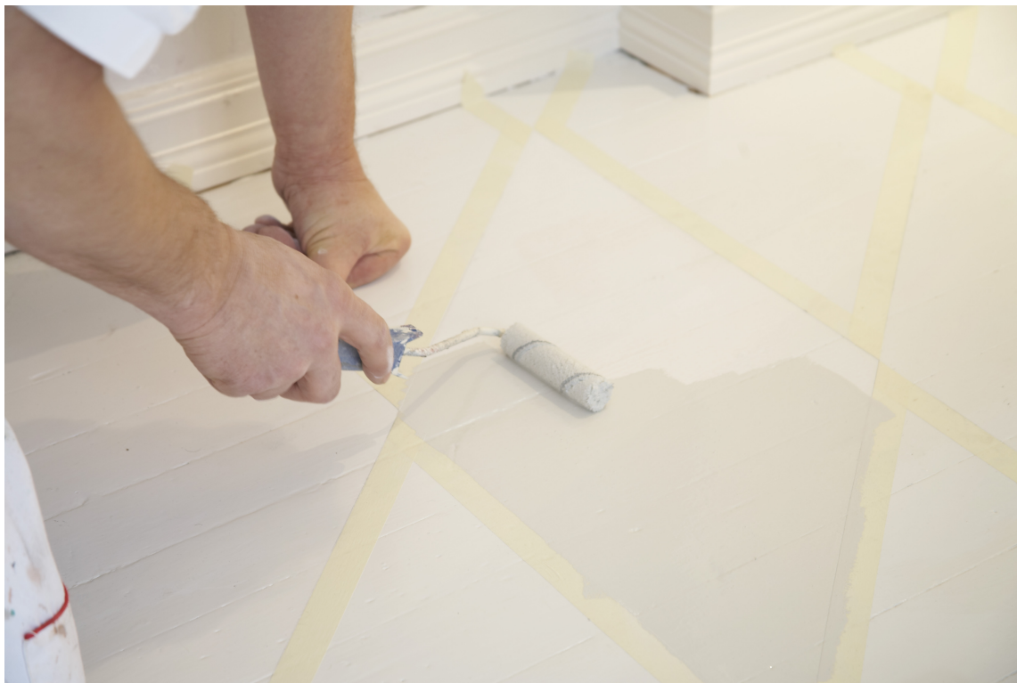
MER ENN ÈT LAG: Når du maler gulv slik som bildet viser må du legge på 2-3 lag med maling.

– Påfør derfor minst to strøk med maling. Dersom gulvet er særlig utsatt for slitasje, bruk tre strøk, sier Venås.