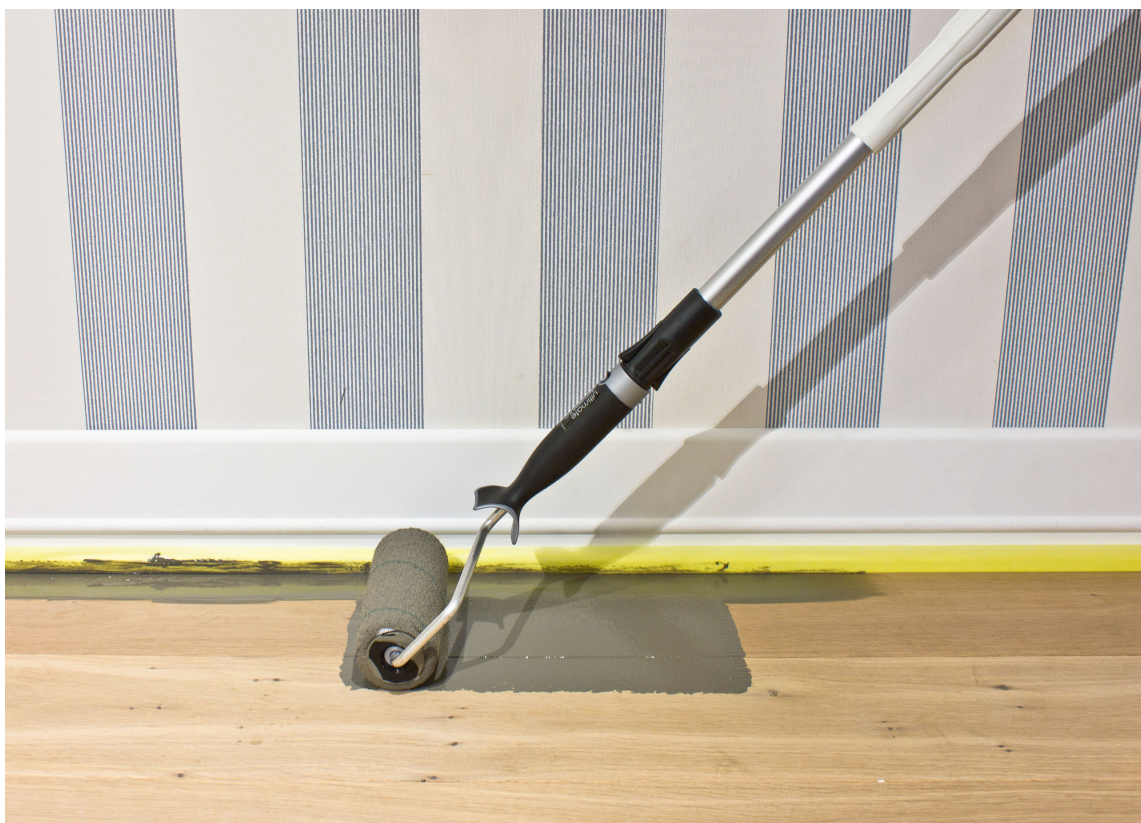
MALERULLE TIL GULV: Godt utstyr gjør jobben enklere og mer behagelig.