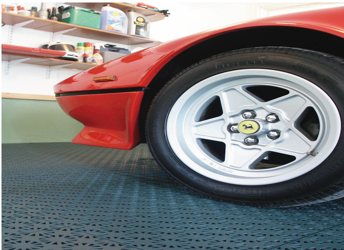
STERKT OG PENT Her er det orden i garasjen! Gulvet er slitesterkt og lett å holde rent. Hestra fra IBG.