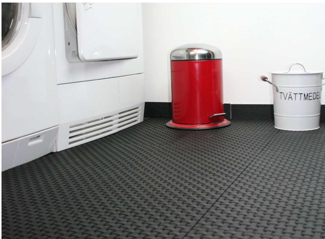
STILIG Tøffe og praktiske gulvfliser, som dekker det ikke så pene betonggulvet på vaskerommet. Lounge fra Duri Fagprofil.