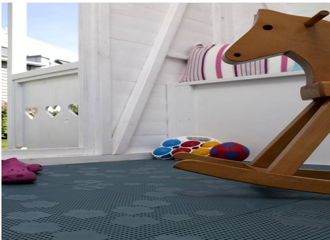
BLOMSTER Store og små blomster spredt rundt omkring kjennetegner Hestra Daisy fra IBG, her en blå variant lagt i gangen.