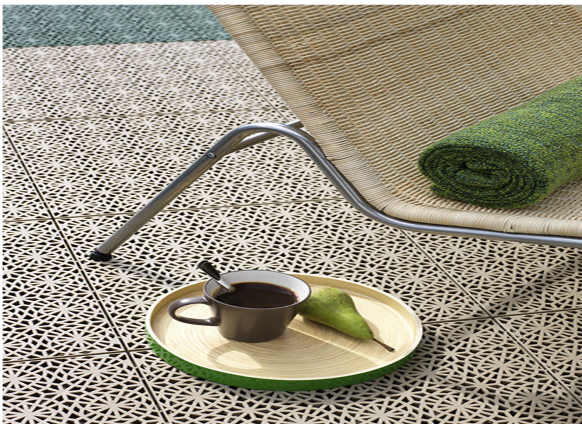
SMAKFULLT En delikat, sandfarget flis fra Bergo og Storeys preger terrassen.