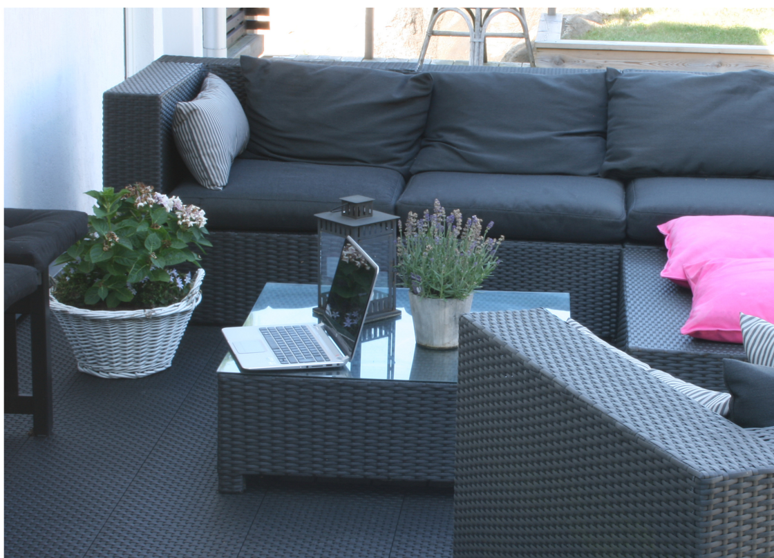
SMART Her er Lounge lagt på terrassen, og gir et stabilt, praktisk og stilig utegulv.