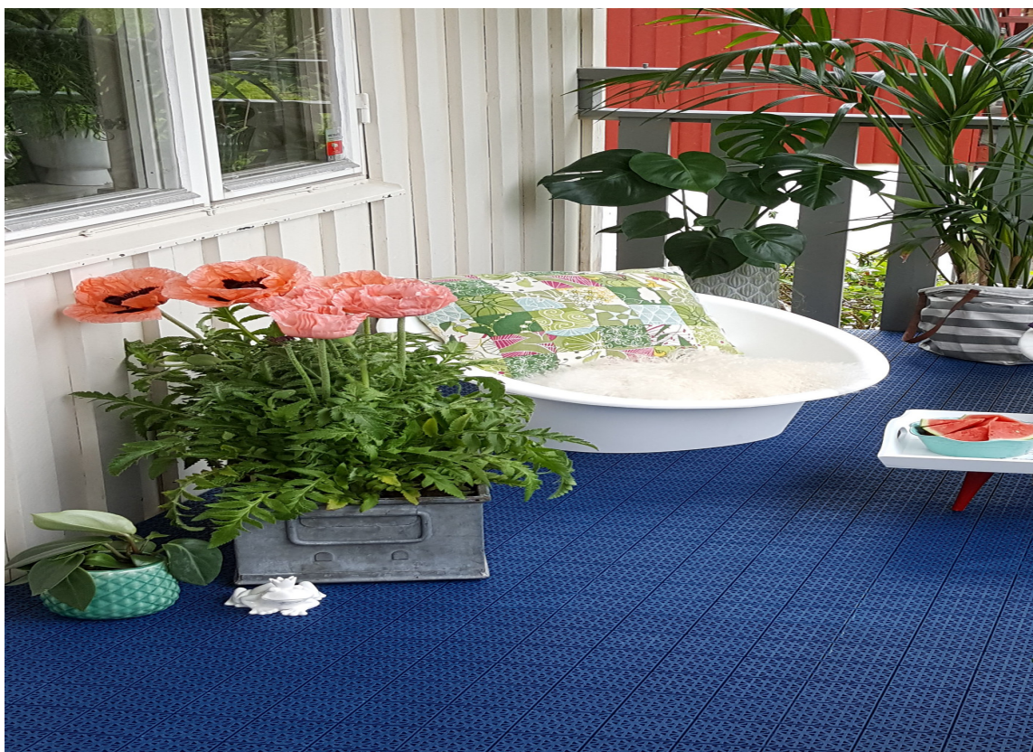
EFFEKT Knallblått gulv gir farge til verandaen når huset er hvitt – Hestra Universa fra IBG.