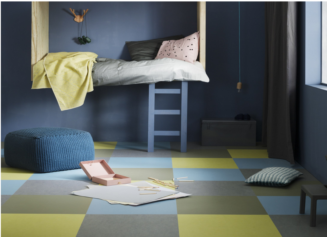
KLIKK: Med klikklinoleum kan du sette sammen fliser i ulike farger for å få et helt unikt gulv. Her er det brukt Marmoleum klikk fra Forbo Flooring.