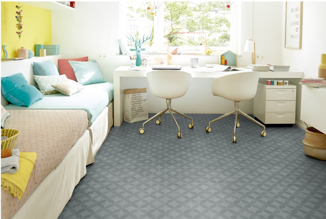
HOLDBART: Gulvet trenger ikke "ta helt av" for å gi en unik look til rommet.