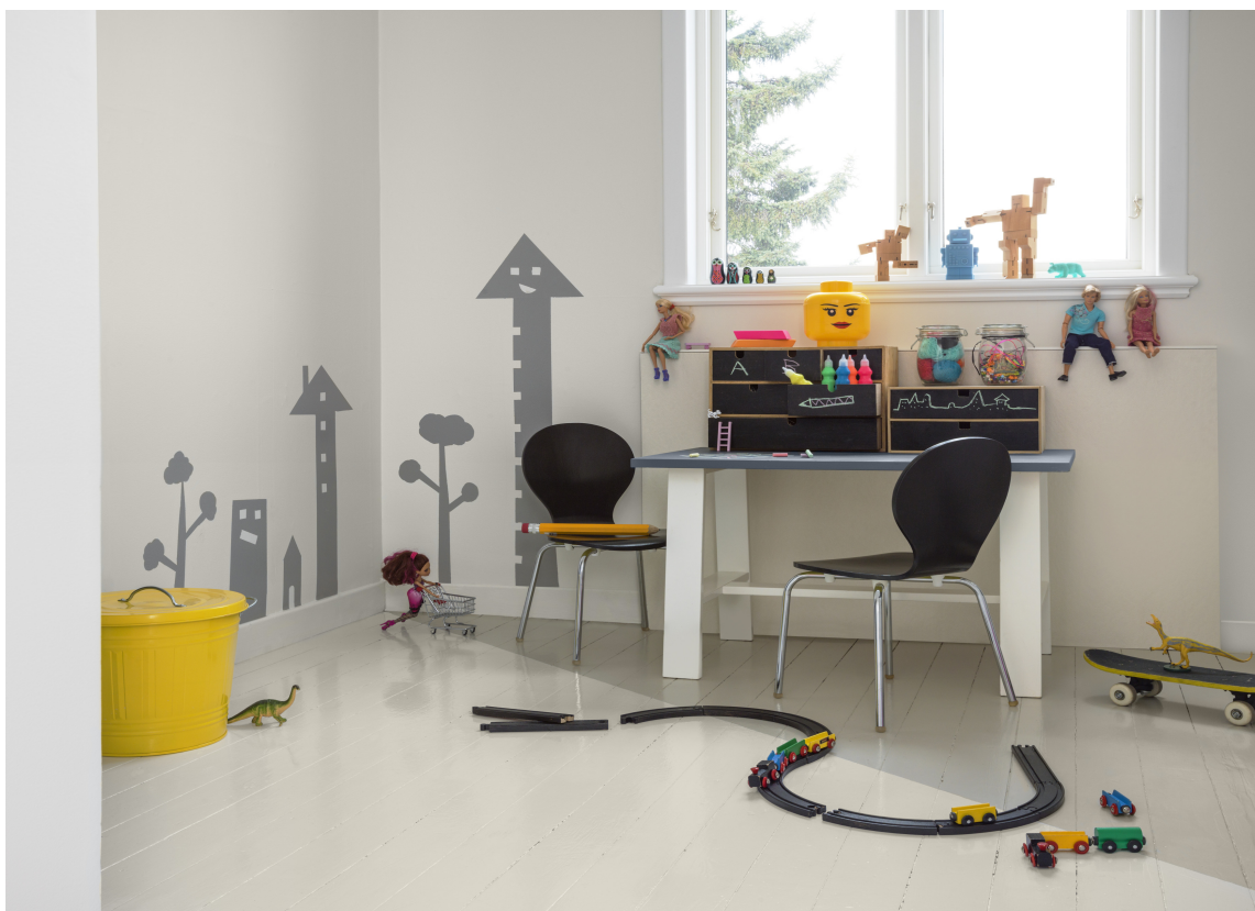
MALT: Har du tregulv på barnerommet, ligger det mye muligheter i noen malingspann. Mal et kult mønster eller del gulvet i to.