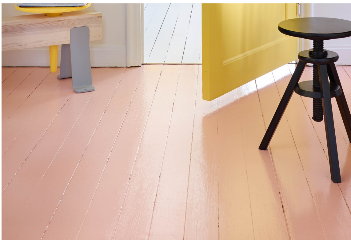
FARGE: Hva med å male tregulvet i barnets favorittfarge?