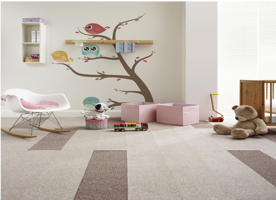
TEPPEFLISER: Med teppefliser på barnerommet får du et komfortabelt gulv, som også kan settes sammen i lekne mønstre.