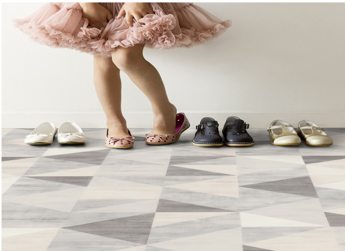
VINYL: Vinylbelegg tåler tøff bruk og kommer i tillegg i mange kule design, som passer de voksne så vel som barna i familien.

Vi har plukket ut noen forskjellige alternativer. La deg inspirere og tenk gjennom hva som er viktigst når gulvet på barnerommet skal legges.