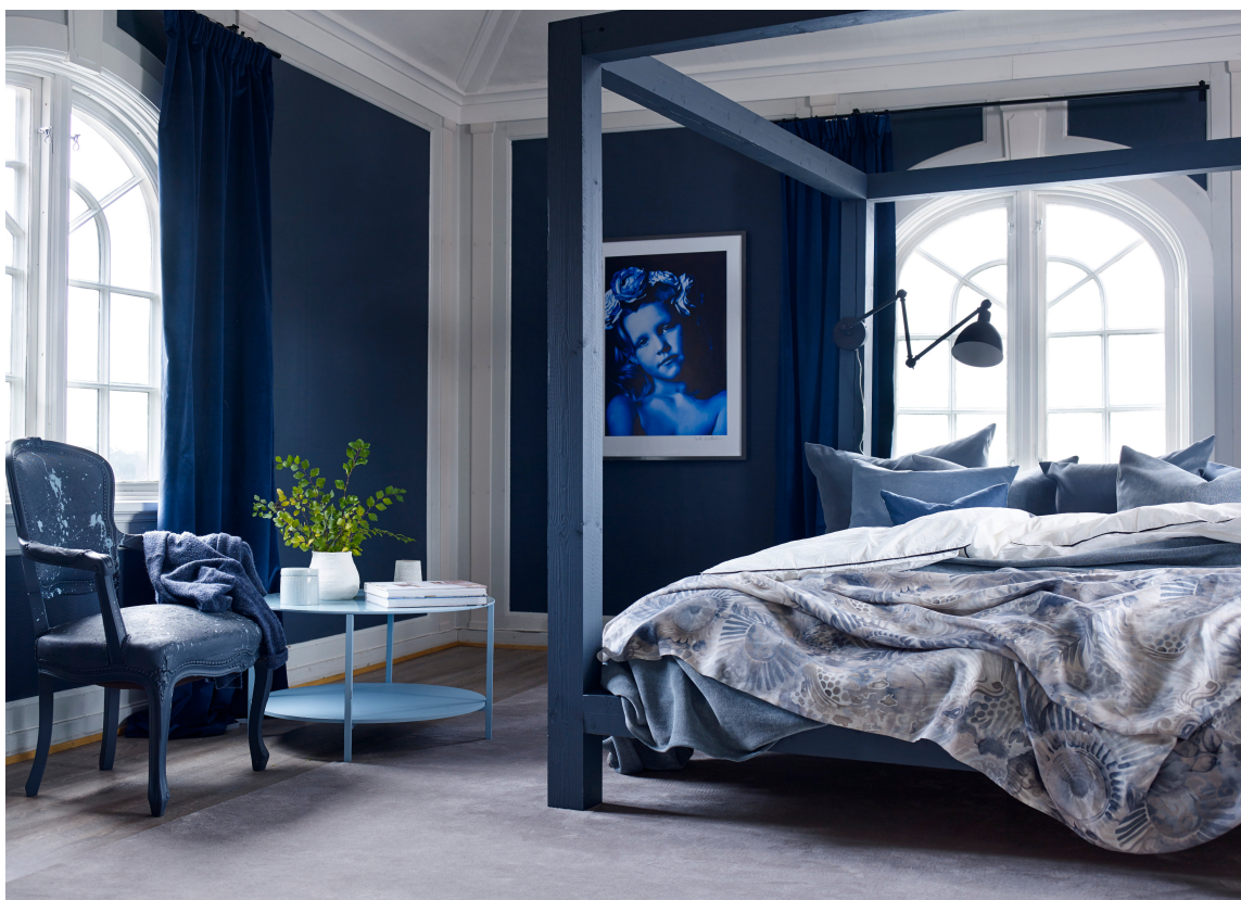
TON-I-TON: Det å kombinere mange nyanser av en farge og skape variasjon med ulike overflater er en sikker oppskrift. Veggfargen er fra Fargerikes kart/fargebar og heter Frostrøyk FR1348.