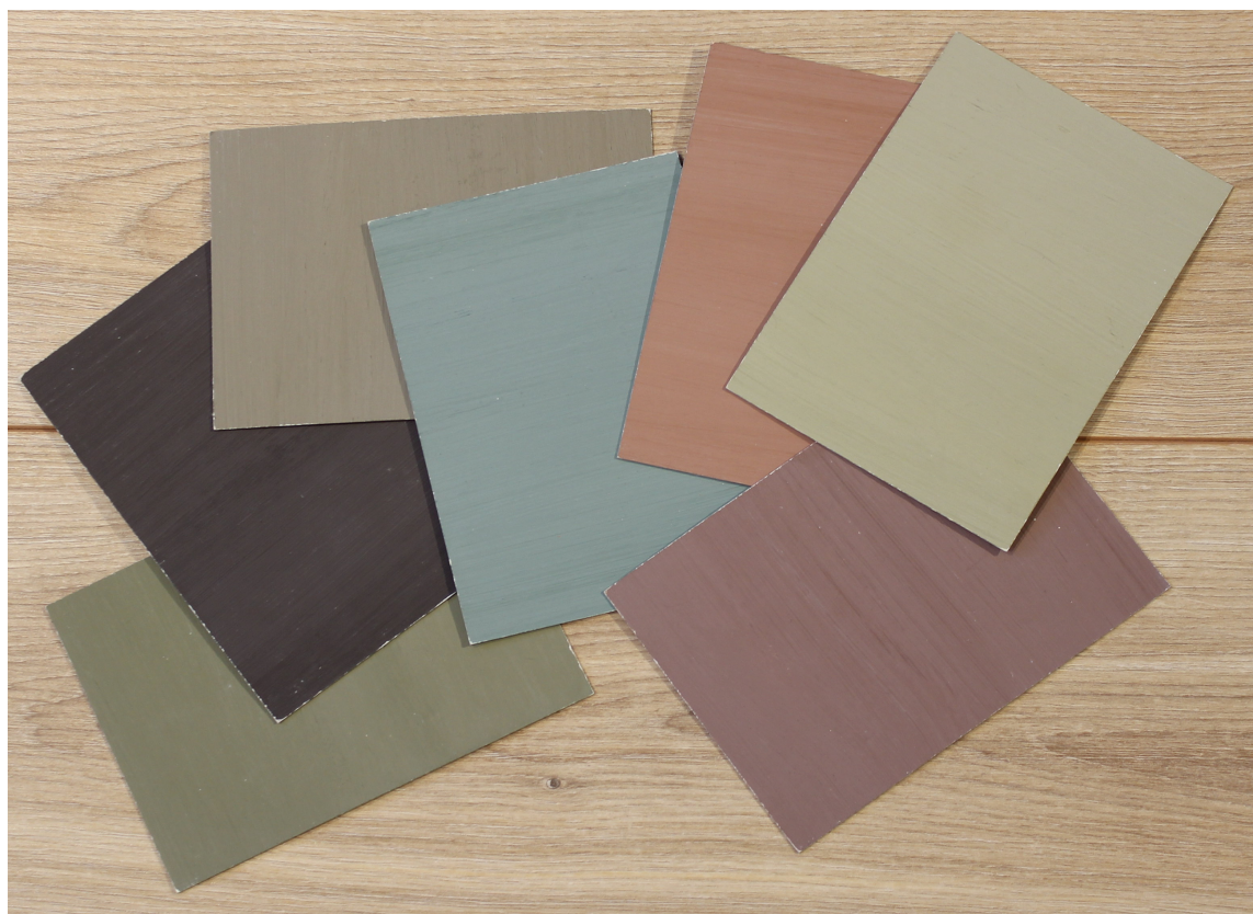
NYANSELIKE: Disse fargene fungerer sammen fordi de ligger nær hverandre i sorthet og kulørstyrke. Den mørkebrune er lagt til for å skape kontrast til de «snille» fargene.

Hvis du vil kombinere ulike farger, for eksempel rosa, gult, blått og grønt, kan NCS-koden brukes for å finne de riktige nyansene.