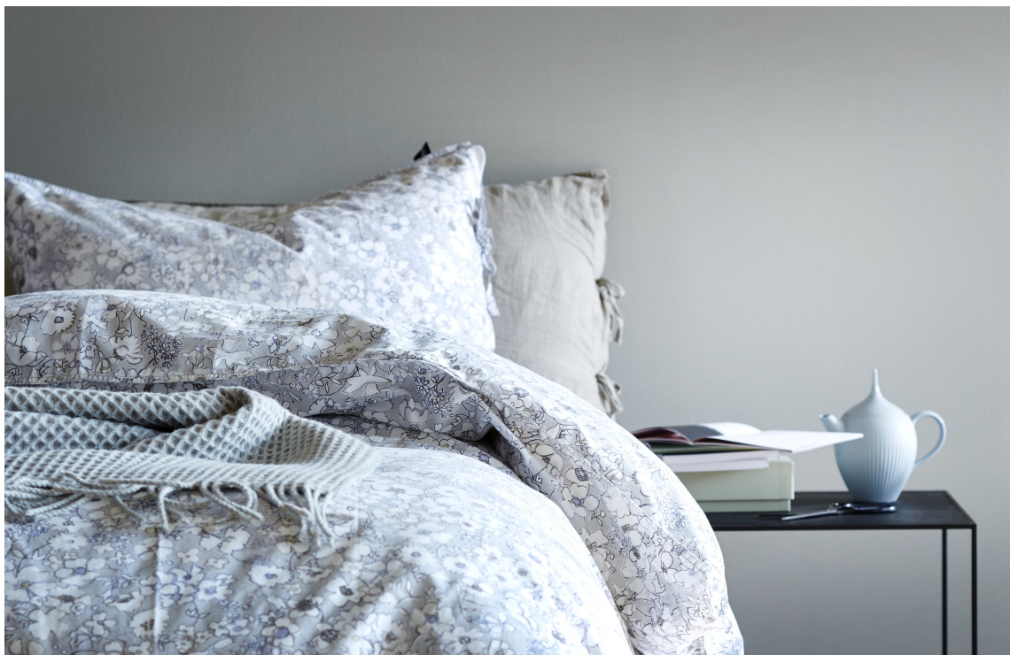
TON-I-TON: Det er mange muligheter når koden er kjent. Dette soverommet har malte vegger i en sortaktig, lys nyanse, mens tekstilene og andre elementer har i seg andre nyanser av fargen. Sammen skaper de en lys og sval atmosfære.