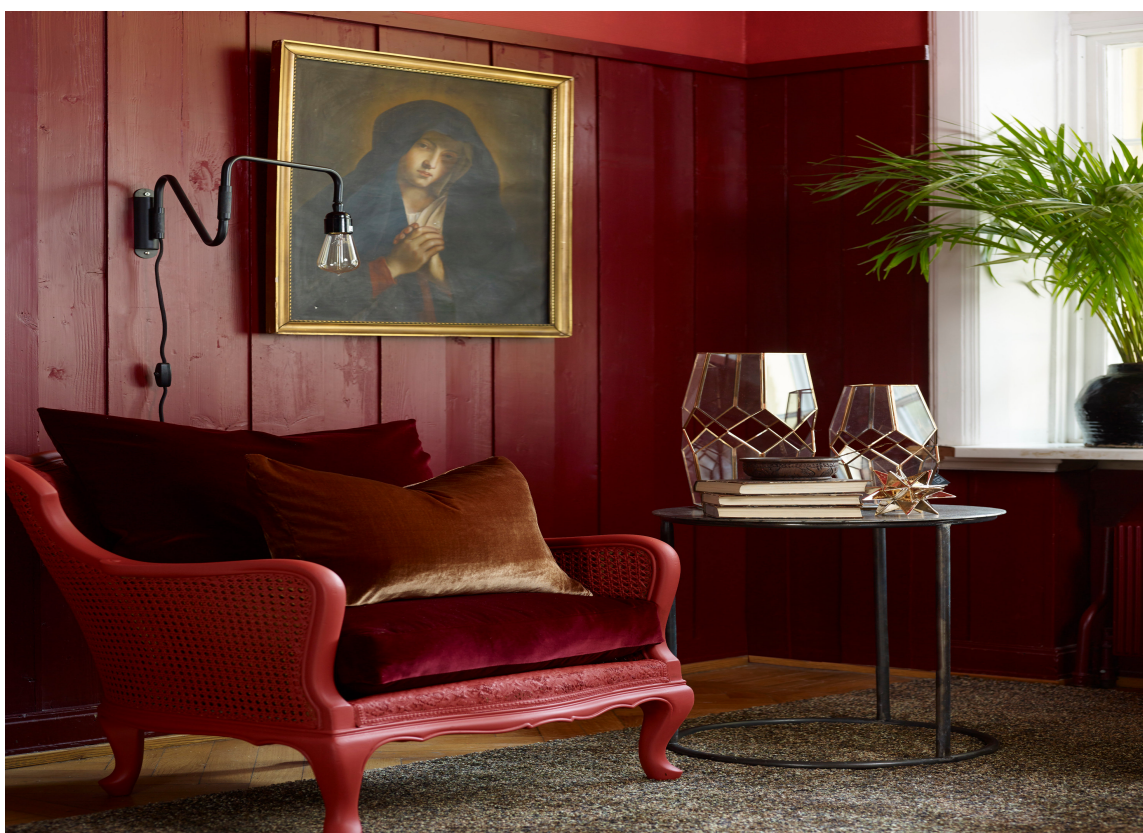
TON-I-TON: Her er ton-i-ton-opskriften fulgt, rødt i flere nyanser, på myke, harde, tyngre og lette materialer. Den grønne planten kommer inn som selve prikken over i-en. (Styling: Christine Hærra)