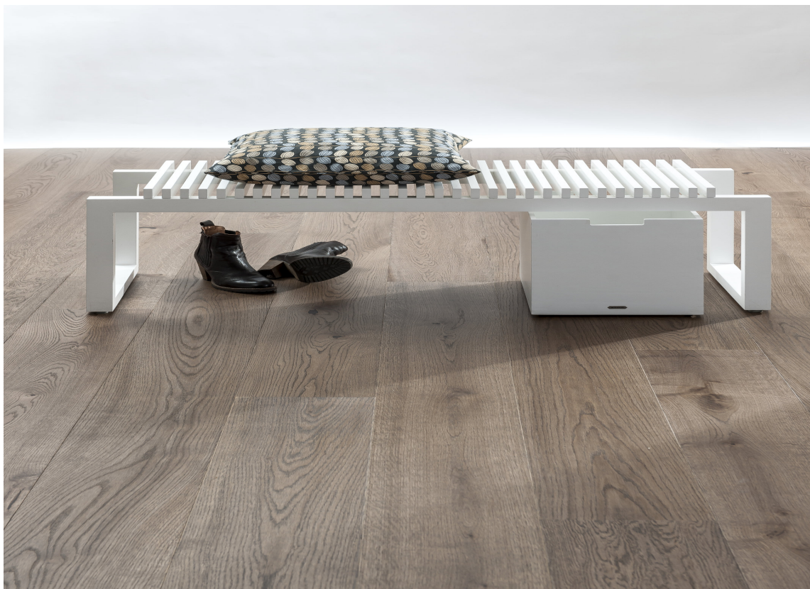
STRESS NED: Ta av skoene og la føttene kjenne på gulvet.