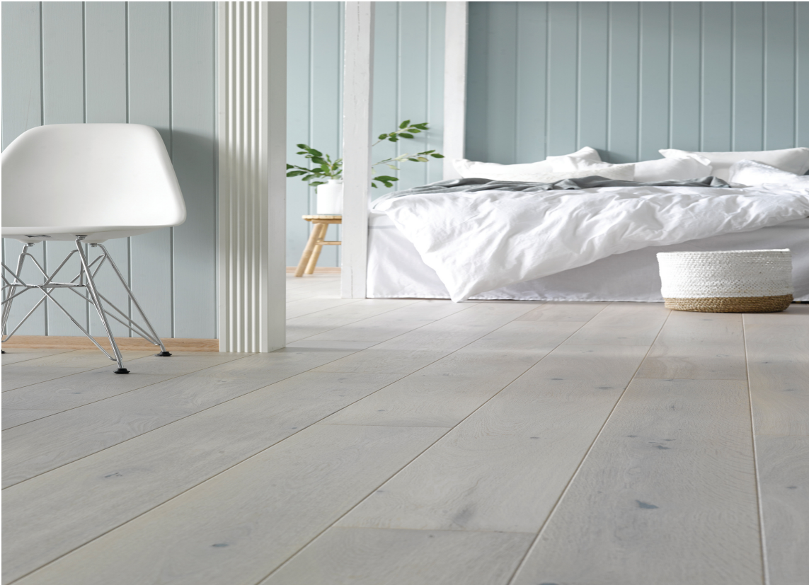
BEST: Undersøk hva som finnes, og velg det du liker best.