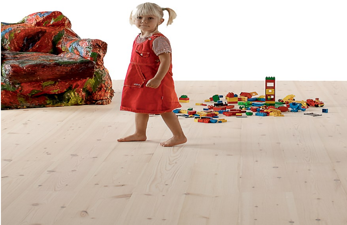
SANSELIG: Det gode gulvet kjennes godt for føttene, for øynene og ørene.