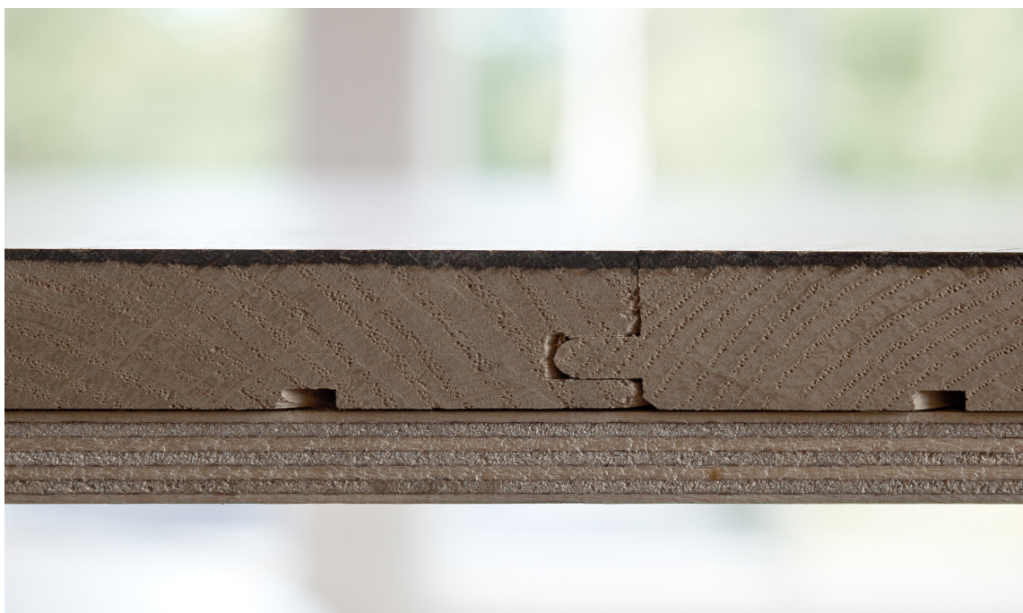
NR. 1: Heltre limt eller skrudd fast til underlaget er det optimale gulvet i jakten på velvære.