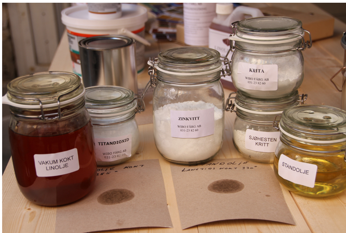
LINOLJE: Linoljemaling består av naturlige ingredienser.