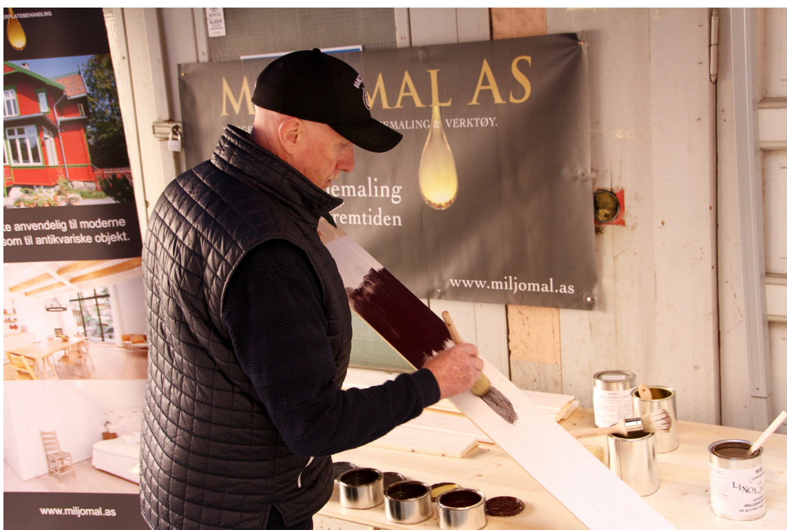
MALES TYNT: Linoljemaling skal strykes ut tynt, og til det er en stiv naturbustpensel best egnet.