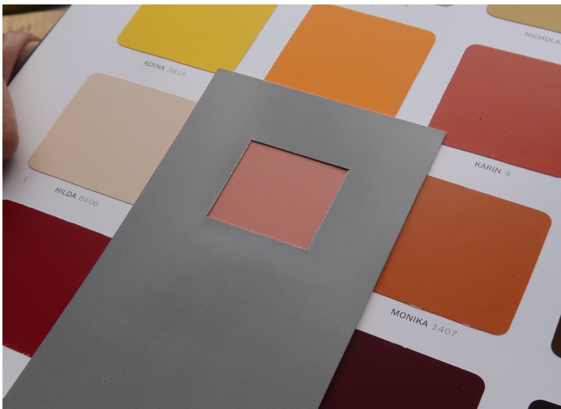
GRÅ: En nøytral grå ramme gir et «riktig» inntrykk av de fleste farger.