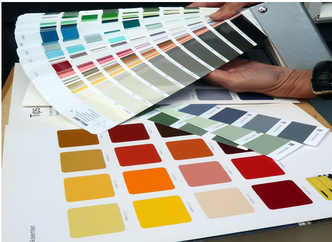
BAKGRUNN: Fargekart og fargevifter viser ofte fargene mot hvit bakgrunn.