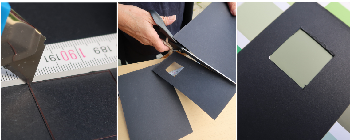
DIN RAMME: Lag dine egne rammer av kartong. Mål opp og skjær ut et hull litt mindre enn fargeprøvene, og test selv.

Årsaken til at farger endrer seg mot ulik bakgrunn skyldes simultankontrast. Kjenner du til dette fenomenet blir det lettere «å temme» fargene. Lag fargerammer og studer forskjellene; det er gøy med farger!