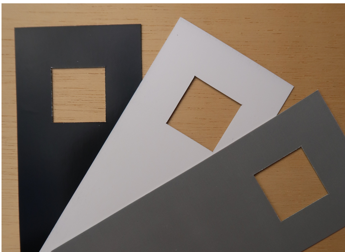
RAMME: En pappramme i hvitt, sort eller grått er et nyttig verktøy for å se hvordan fargen endrer seg mot ulike bakgrunn.