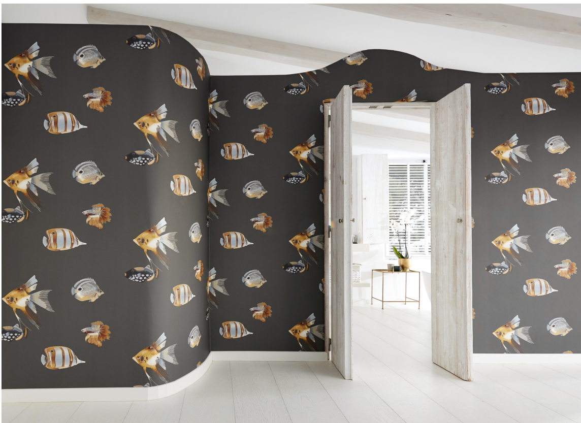
LEKKERT Fiskenes farger fremheves ekstra mot den mørke bakgrunnen. Tapet fra Tapethuset; Harlequin, Anthozoa.