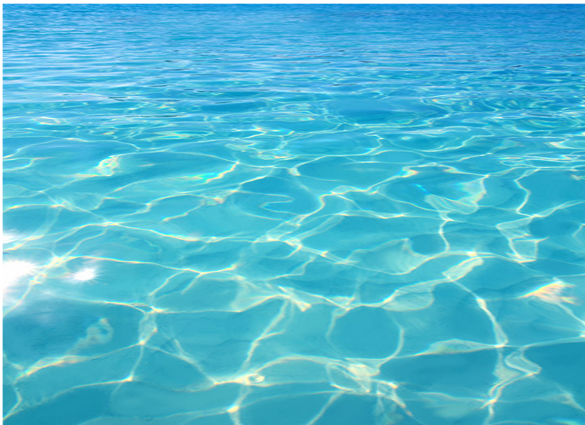
REFLEKS Fototapetet tar sjøen inn i rommet, og det er like før du trenger solbriller! Fototapet i fiber, fra Fantasi Interiør; Komar, Mood.