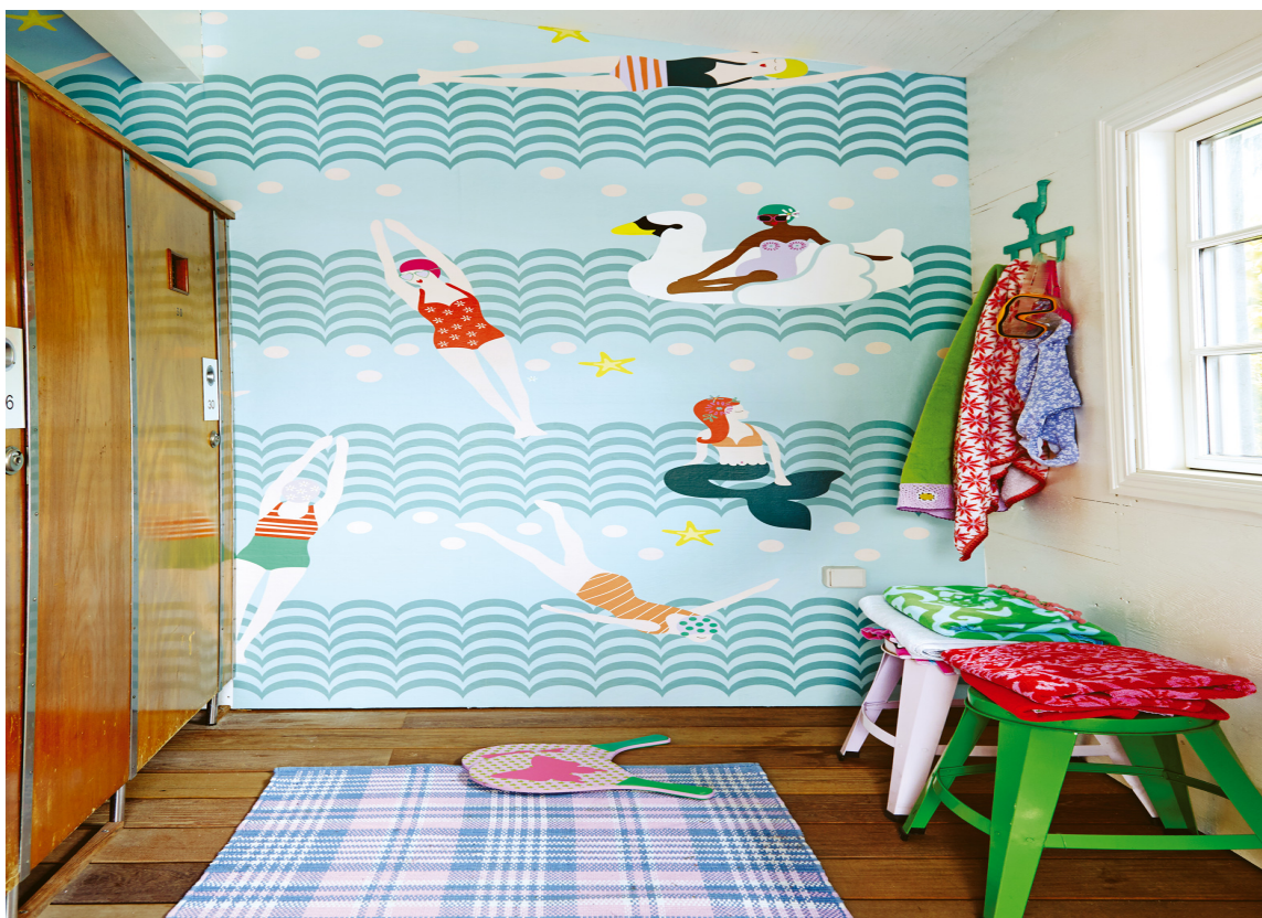
GLADE DAMER For badenymfer i alle aldre! Tapet fra Storeys; Eijffinger Rice.