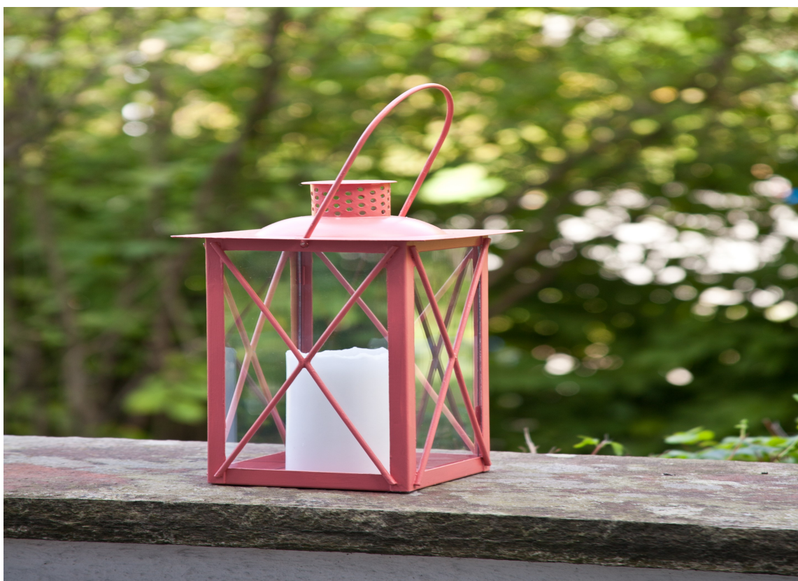
LYSER: Lyktene lyser opp uteplassen når de er ferdigmalt!