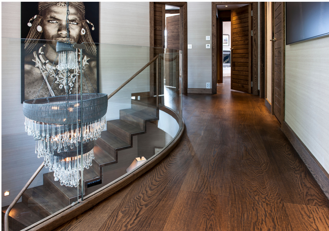
MØRKT: Mørke gulv anbefales til rom med lite lysinnslipp. Her er det brunvokset eik fra Skattekammeret.

– Gjør det til et morsomt og annerledes sted, foreslår Ramsøskar.