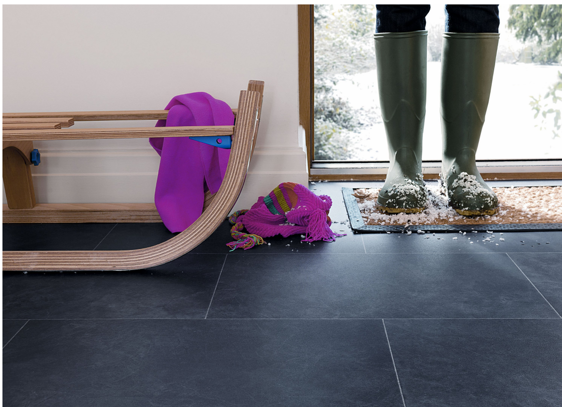
PRAKTISK: I entreen er det praktisk med gulv som tåler litt søle. Her er det lagt LVT-fliser fra Polyflor.