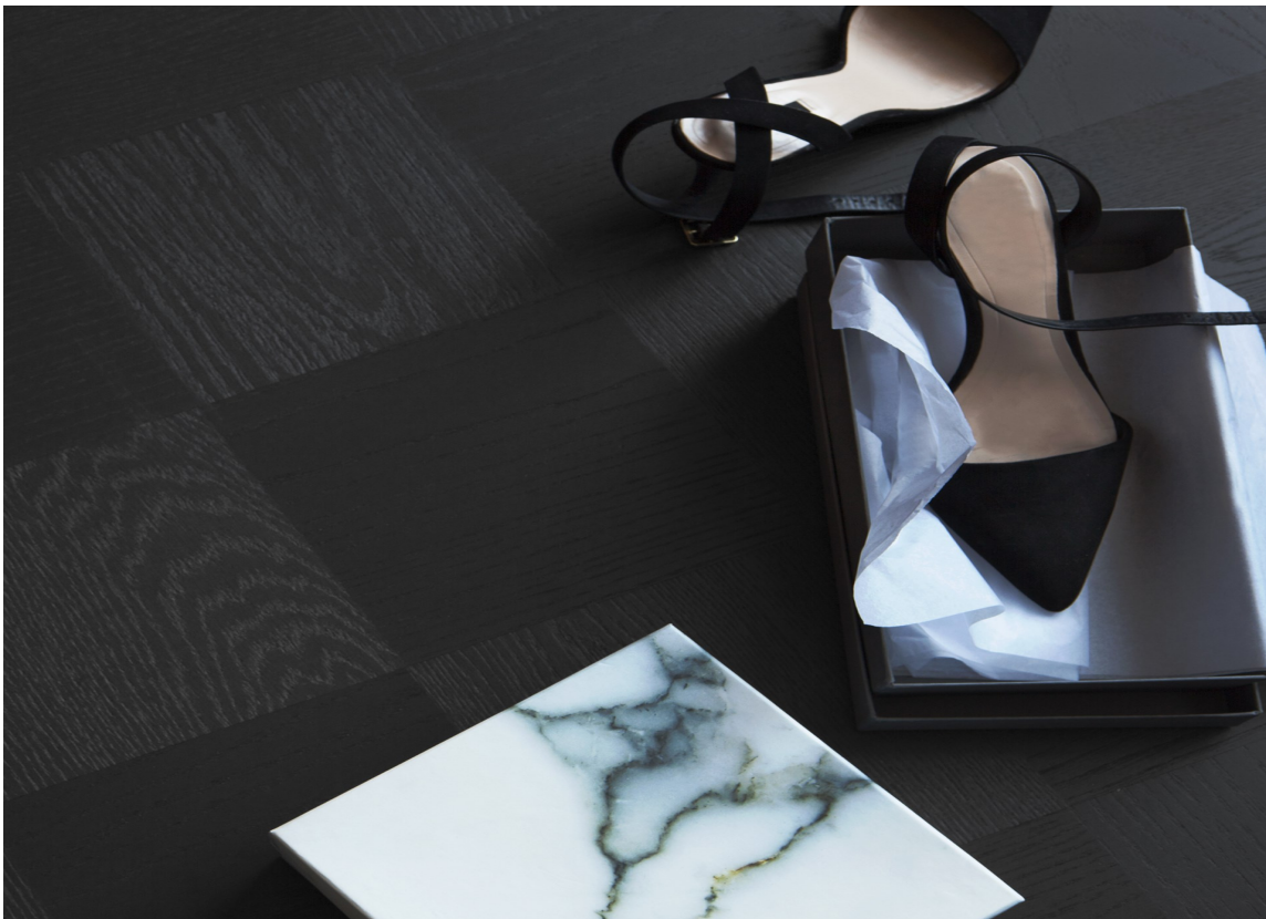
LUKSUS: Start med dette gulvet og luksusfølelsen er der. Noble Ek fra Tarkett.