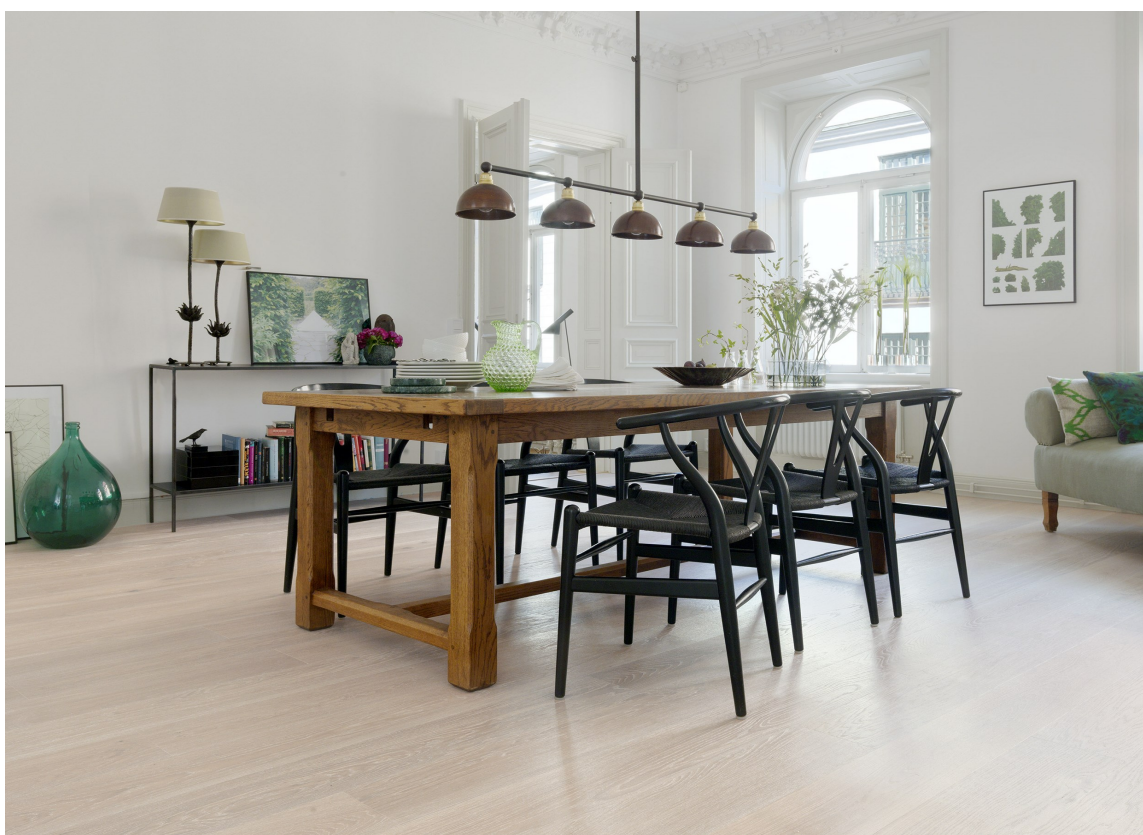
BRA VALG: Både kjøkkenet og stuen kler godt en enstavs eikeparkett. Her er det hvit eik fra Tarkett.