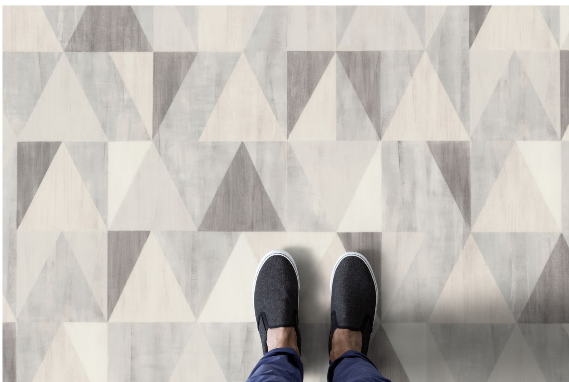
MØNSTER: Entregulvet tåler mønster. En snill variant får du med Diamond Cream fra Gerflor.