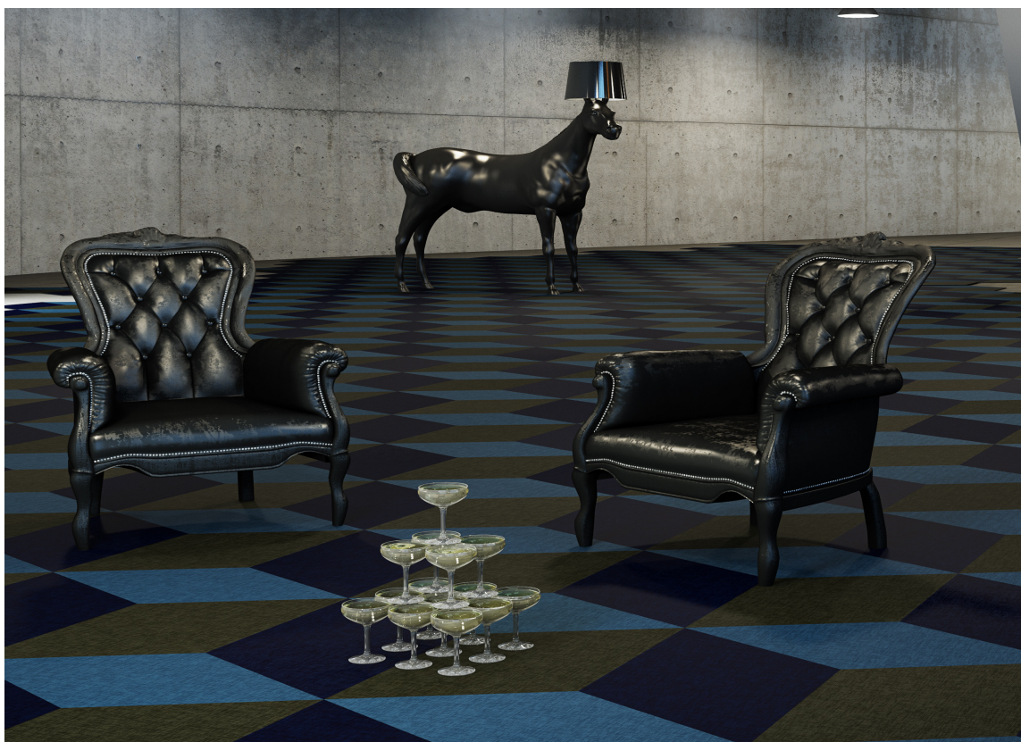
TAKTILT: Et tekstilgulv i mørke farger kan lune og skape atmosfære i kjelleretasjen. Tepegulvet er Fletco fra Forbo.