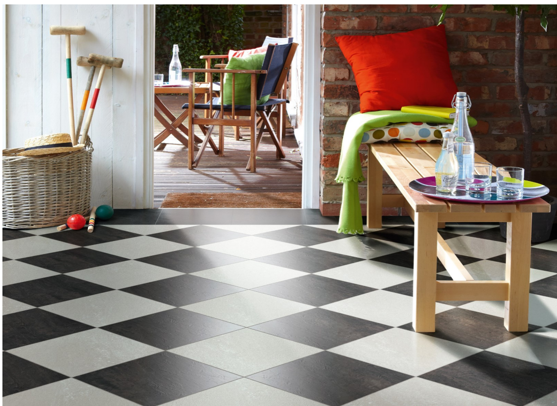
SJAKK: Sverger du til sort/hvitt har du mye å velge mellom. Blant annet vinylfliser. Disse er fra Polyflor.