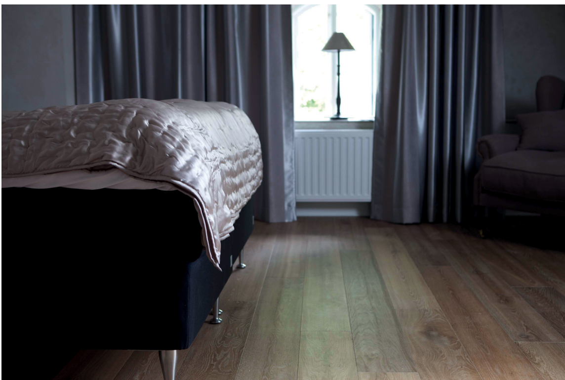
HOTELLSTIL: Gå for et mørkt gulv på soverommet. Her er det en bruntonet slittegulv fra Alfort. (Foto: Alfort)