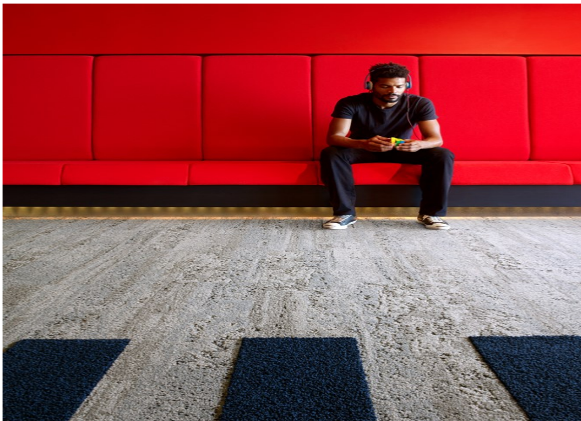
TV-STUE: En TV-stue i kjelleren trenger ikke ligne på noen av de andre rommene i huset. Det myke gulvet er teppefliser fra Interface.