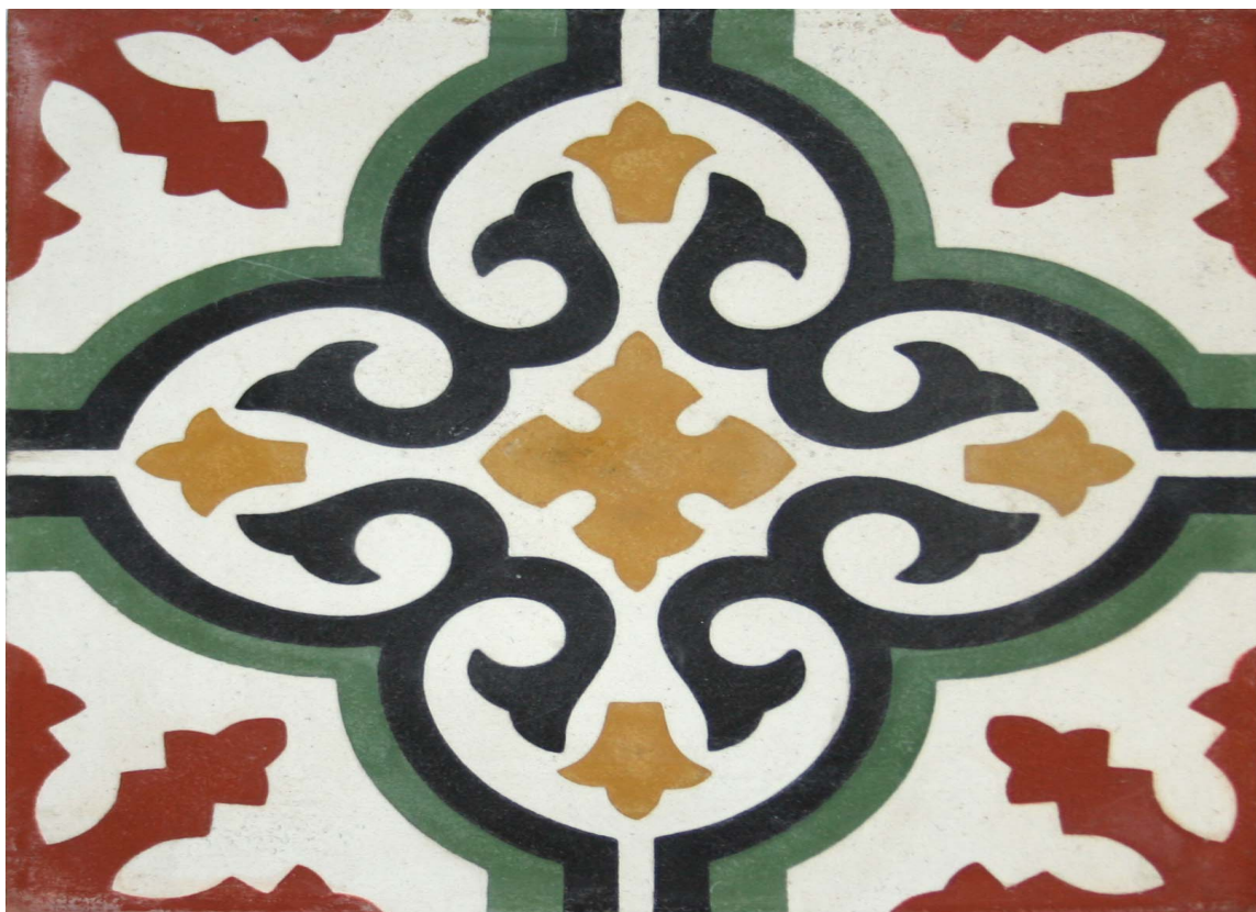
MØNSTERFLIS: Entregulvet tåler farge og mønster. Få wow-gulv med disse flisene fra Golvabia.

– Her kan det med fordel brukes mønster og farger, sier han og tenker det vil gi inngangspartiet en bra wow-opplevelse. Et godt eksempel på dette er trenden med marrokansk mønstrede fliser vi har sett de siste par årene. Det er ingen grunn til å vente til man er inne i stuen med å vise litt personlighet.