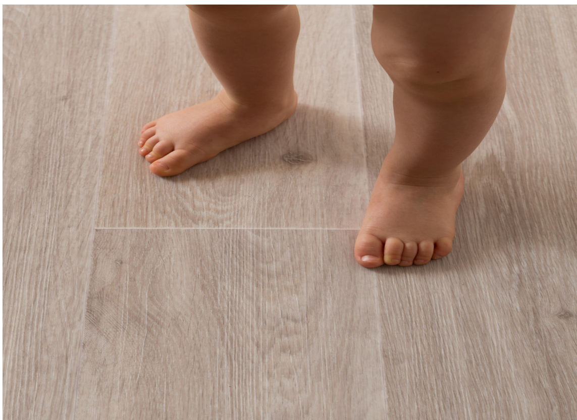
NATURLIG: Barnerommet er i kategorien åpne rom og kan med fordel ha gulv som stue og kjøkken.