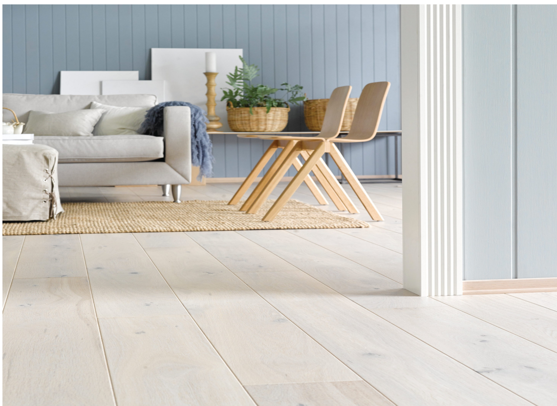
ÅPENT: I åpne rom skaper lyse tregulv en god opplevelse. Her er det enstavs eik fra Saga Parkett.