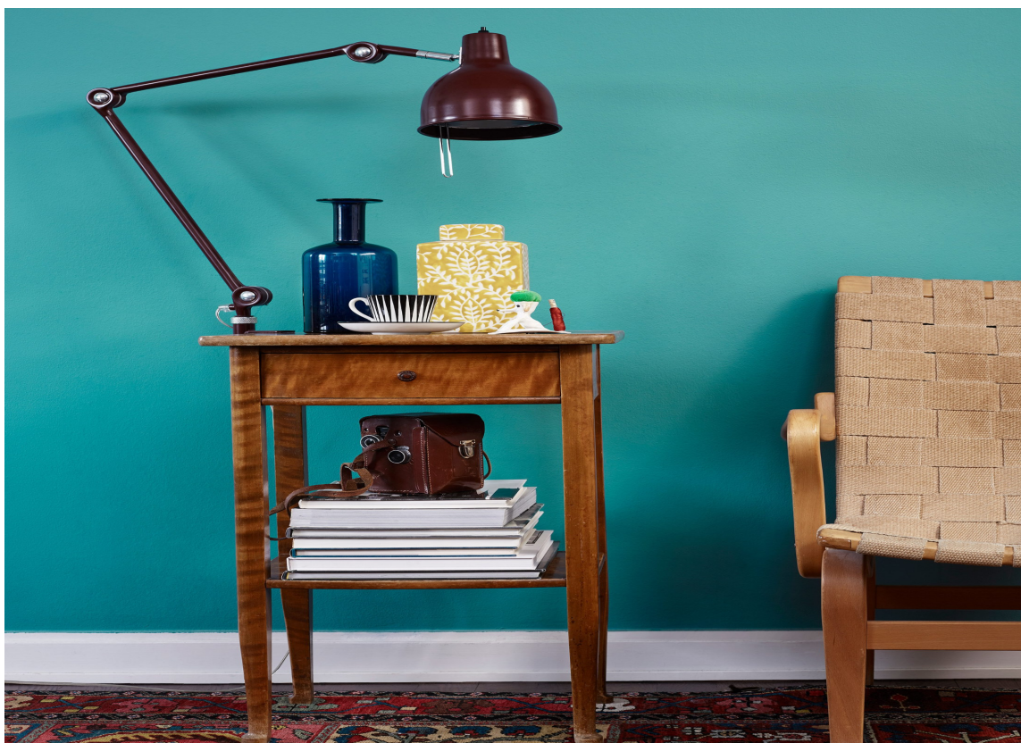
TEST: Test fargen i rommet før du maler, så er du sikker på at du får nyansen du ønsker. Her er det malt med farge Smaragd fra Beckers.