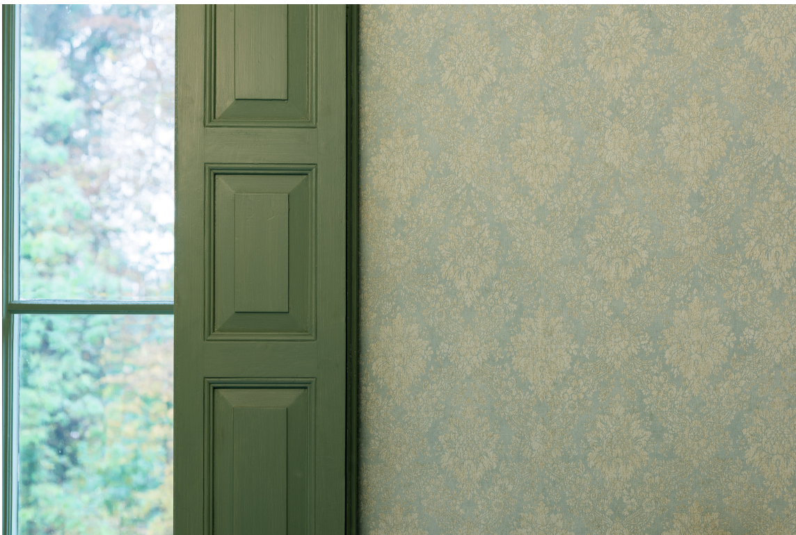
HERSKAPELIG: Her trekkes det turkise mot grønt. Tapetet Secret Garden fra Storeys trekker tankene mot Downton Abbey.