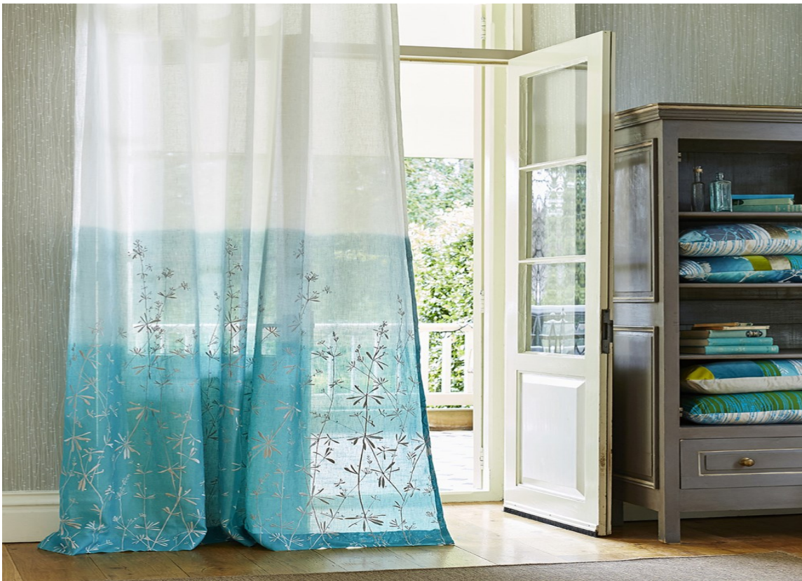
SOMMER: Mer lett og sommerlig enn broderte gardiner som vaier i vinden blir det vel ikke. Disse med graderte nyanser i turkis kommer fra Harlequin og Tapethuset.