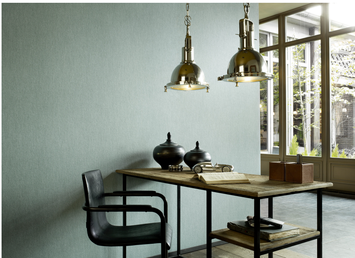
LINTAPET: Linstrukturen i dette tapetet gir rommet en eksklusiv og tidløs ro. Tapetet Flamant føres av Green Apple.