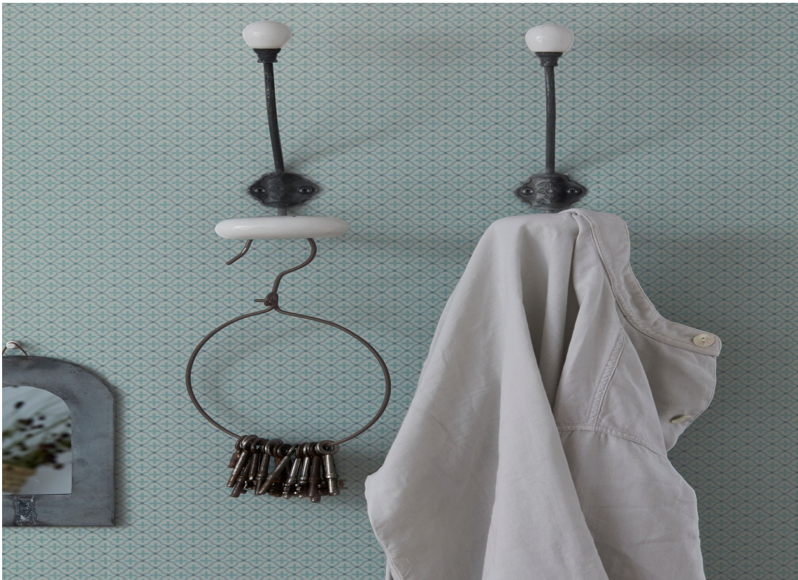
LANDLIG: Et enkelt, lite mønster er nok til å slå an en landlig tone og føre tankene mot rolige, late sommerdager. Tapetet er fra Borge.

Utvalget av turkis tapet er overveldende, vær derfor forberedt på noen øyeblikk med valgets kval. Bestem deg først for stil/atmosfære så er du et stykke på vei. Ønsker du det elegant og tidløst, litt landlig og romantisk, retro eller noe helt annet? Stripper, ruter, ensfarget, blomster eller hva med ville dyr? Matt eller blankt? Hva med tapet som ser ut som tekstil, eller et helt annet materiale?