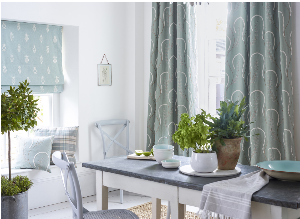
STØVET: Tekstiler fra Sanderson myker opp i det grå og svale interiøret. Den litt støvete turkise virker rolig og dempet.