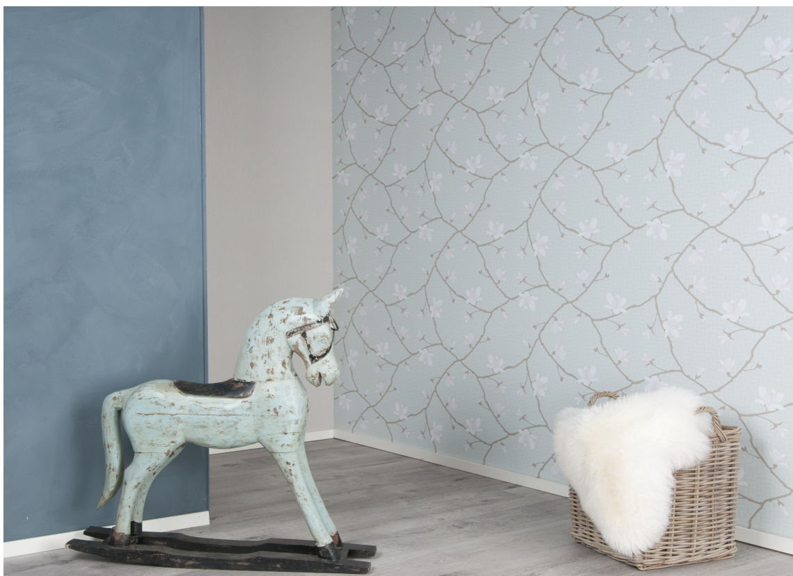
KOMBI: Her er veggplatene Walls2Paint fiffet opp med maling og tapet. Det turkise tapetet er fra Borge.