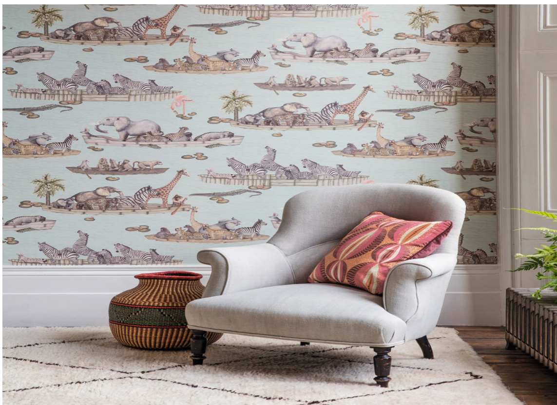
VILLE DYR: Selv om de er ville virker de temmelig rolige mot en svak turkis bakgrunn. Tapetet er fra en av de siste kolleksjonene til Cole & Son som føres av Borge.