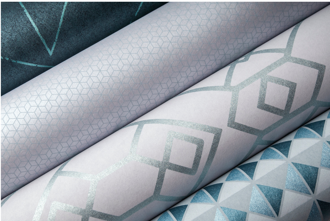
MØNSTER: Geometriske mønster på lys bakgrunn med litt skinnende overflate gir disse tapetene fra Borge et elegant og moderne uttrykk.