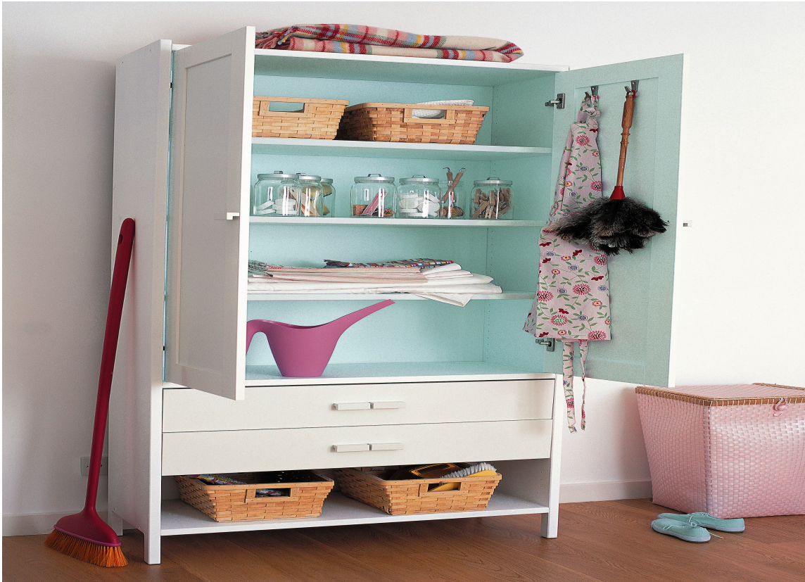
SKAP: Hva med å male et skap på innsiden i turkis? Og hver gang du åpner, kommer det en liten frisk sommervind feiende!