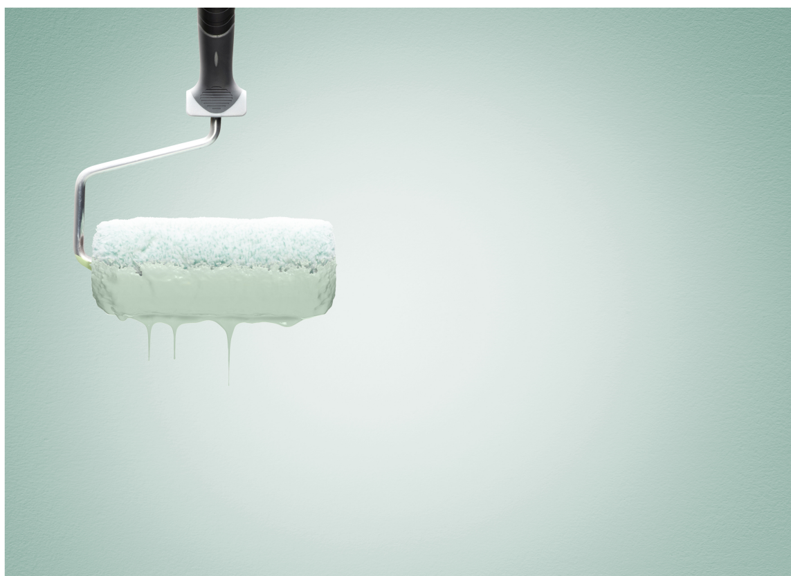
NYANSE: Når du har funnet din nyanse og riktig maling er det bare å sette malingskaffet på rullen og rulle i vei.