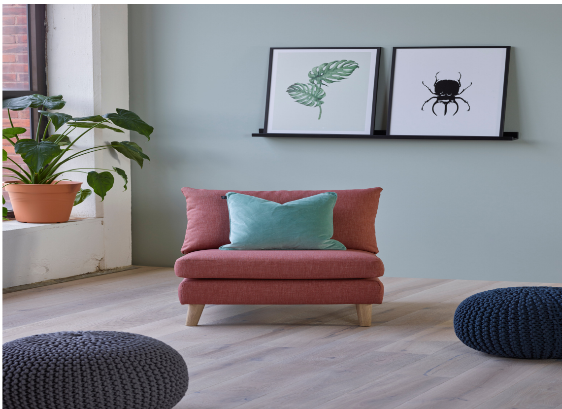
RØDT: Noen innslag fra motsatt side på fargesirkelen liver opp og varmer et svalt turkis interiør.

At fargen ligger på den kjølige delen av fargesirkelen bør ikke skremme noen. Kombiner den med lune naturmaterialer, litt gyllent metall eller innslag av komplementærfargen rødoransje, så kommer varmen inn i rommet.