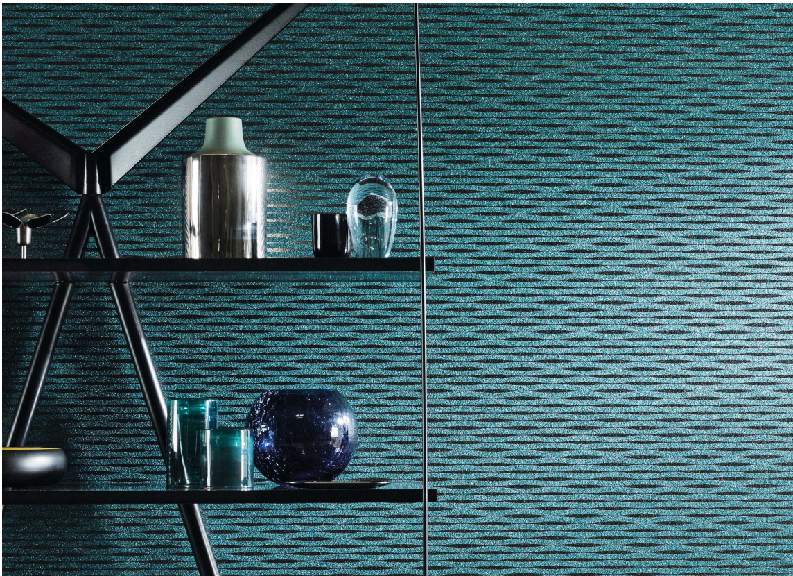
METALLISK: Her snakker vi urban eleganse og en anelse maskulin stil. Tapetet er fra Omexco og føres av INTAG.