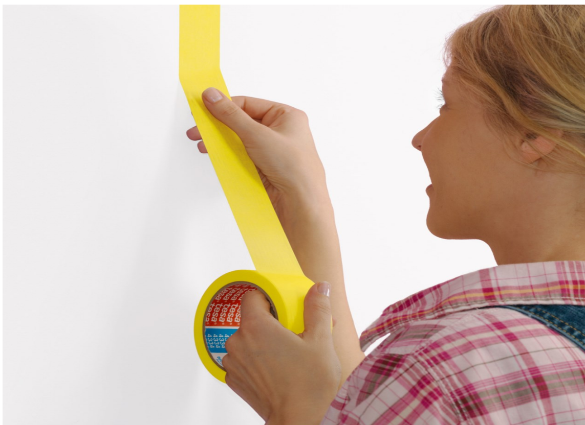
LANGT: Bruk så lange remser som mulig. Her er Precision Indoor fra Jordan.