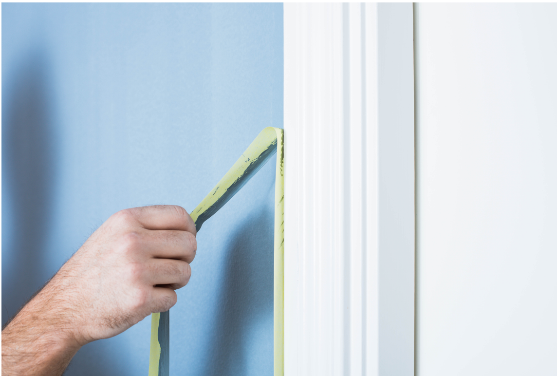
MED EN GANG: Fjern teipen når malingen fremdeles er våt.