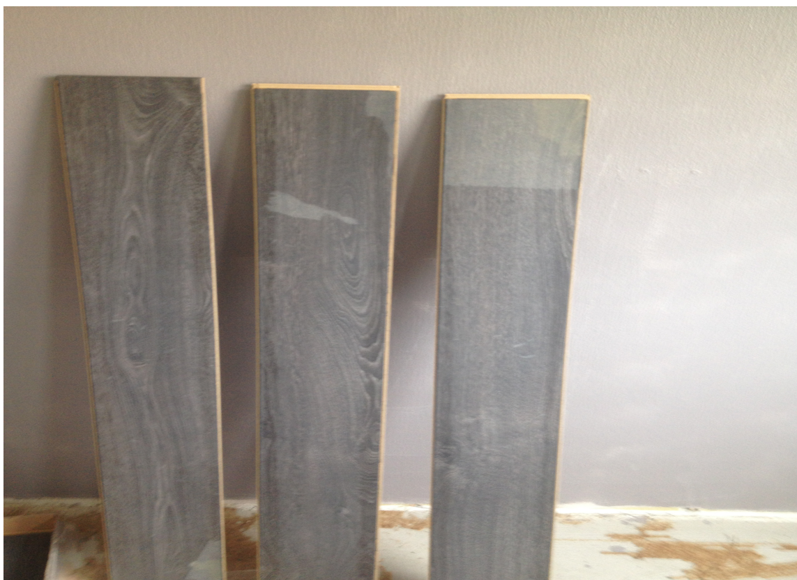
TRANSPORTFUKT: Vinylstaver som er blitt fuktig under transport kan få hvite skjolder. Disse forsvinner under akklimatiseringen.