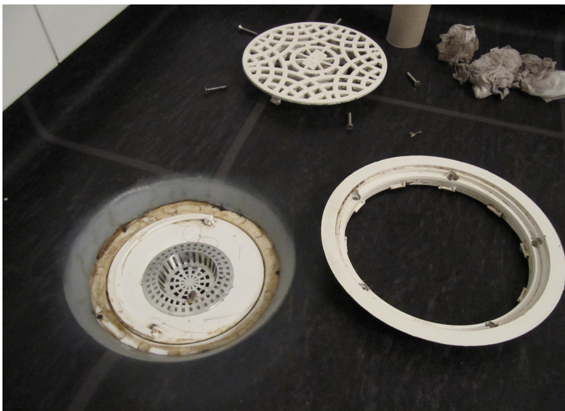
SLUK: Under slukristen er det fuktig. Her kan belegget få lyse skjolder. Dette er ikke en produktfeil, men helt normalt.