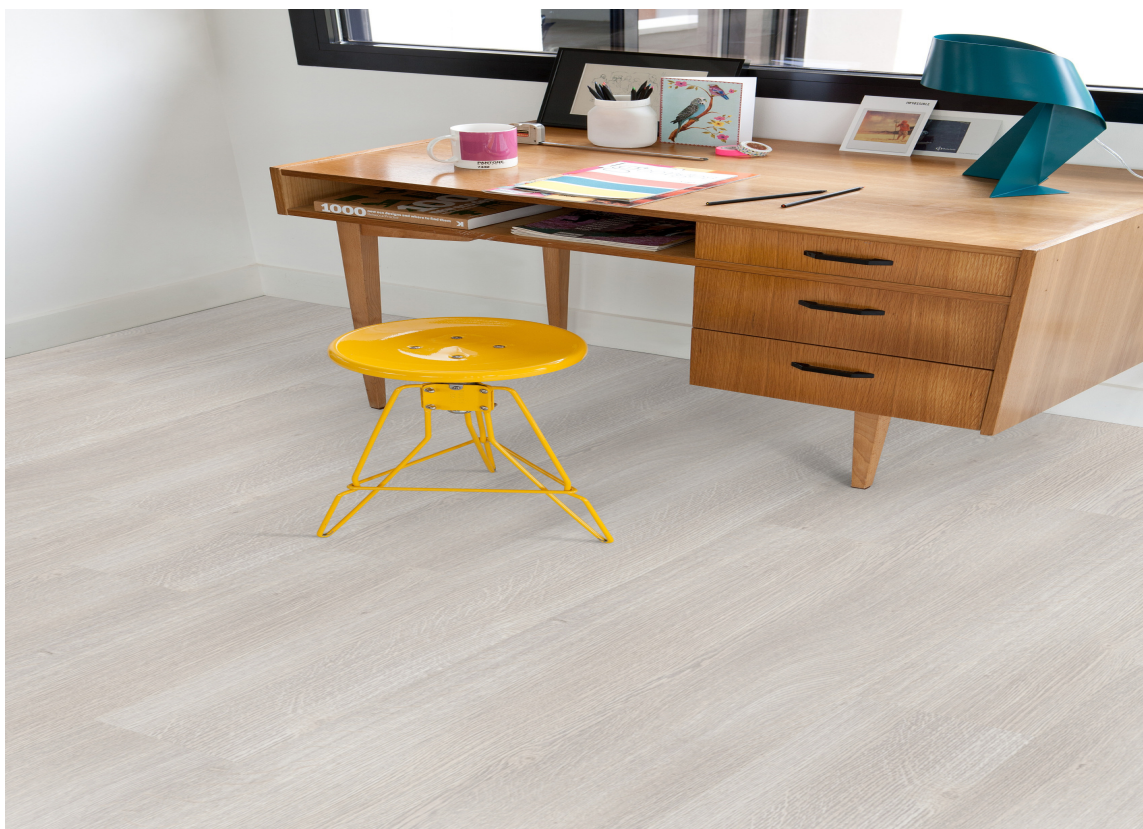
FLOTT: Klikk-vinyl kan lages i meget naturtro etterligninger etter tre, stein eller fliser. Overflaten er preget for å minne om teksturen i naturmaterialet. TopSilence fra Gerflor.