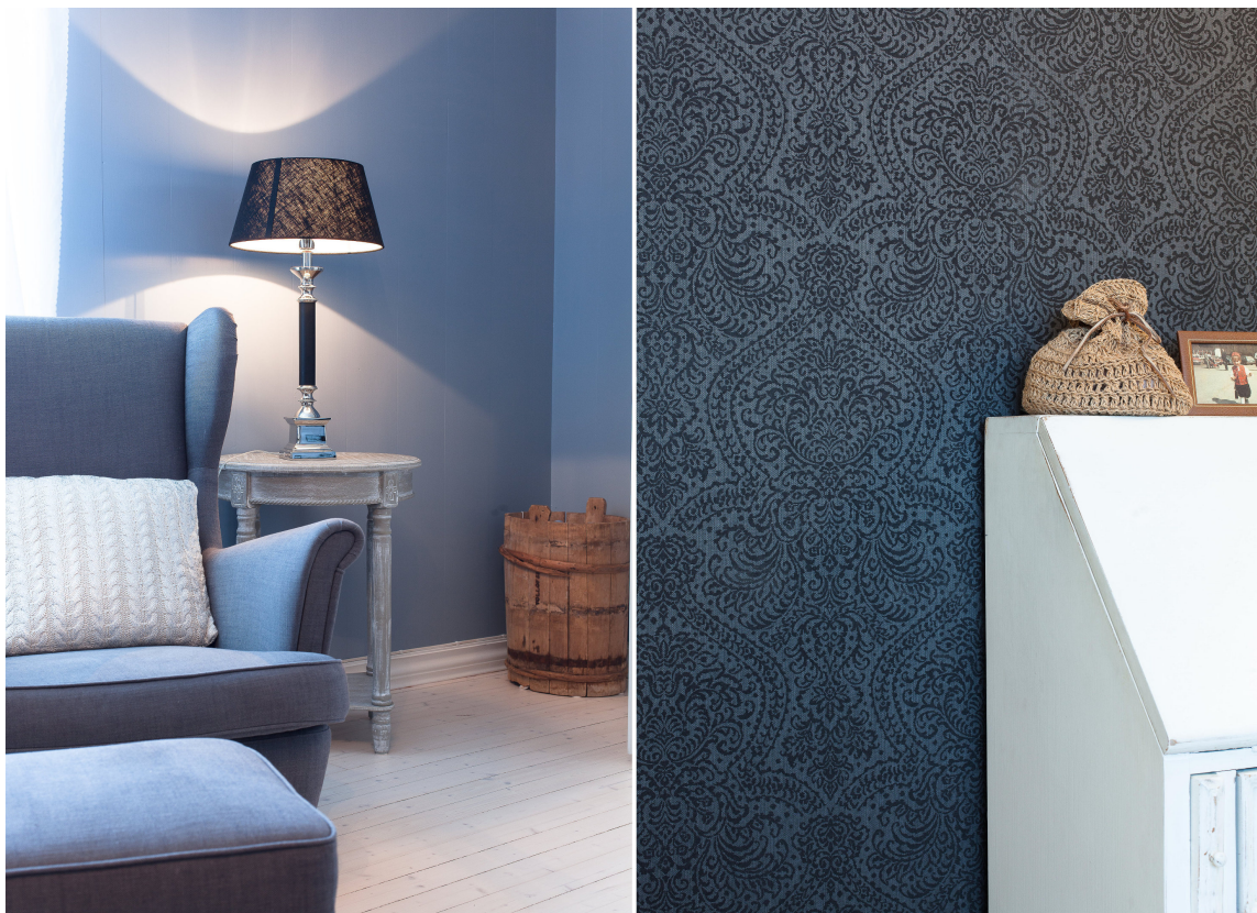
KOMBINASJON: Mønstret vegg virker lunere enn ensfarget.