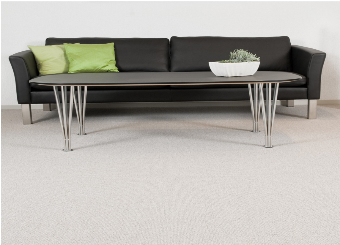
MYKT OG STRAMT: Et rom møblert med stramme linjer og kjølige materialer mykes opp med teppe på gulvet.