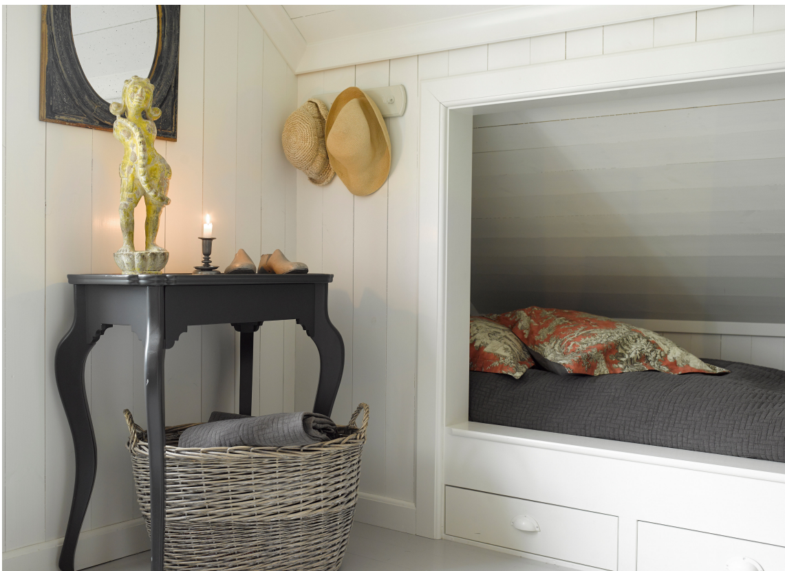
ENSFARGET: Malt panel virker lunere enn malte veggplater.