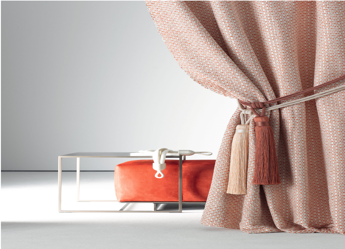
KLASSIKER: Korkgulv er et lunt naturmateriale og en klassiker som kan myke opp et stramt miljø.