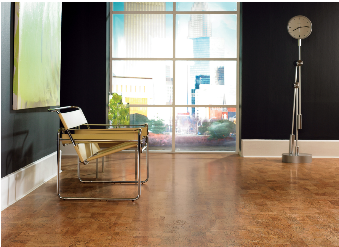
MØNSTER: Et mønstret gulv virker lunere enn ensfarget.