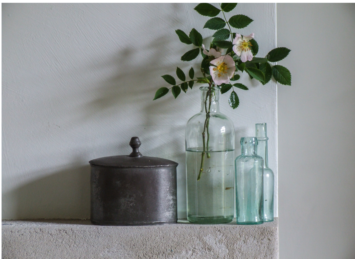
MATT: Matte malinger virker lunere enn blanke.