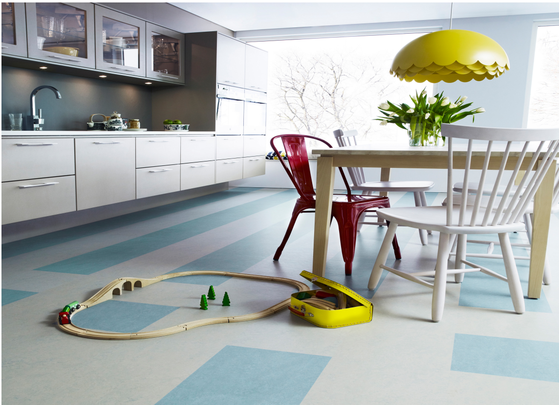
MYKE FOLDER: En gardin i myke, tunge folder luner mer enn en stram og snau gardin.

I planleggingen av hvilke materialer som skal «bygge» rommet, hører også tekstilene med. Stoffet på møbler og gardiner er viktige miljøskapere. Den gardinløse moten har gjort mangt et rom nakent og kaldt, men nå er gardinene på vei inn igjen. Da er det greit å tenke på at også at ulike kvaliteter har forskjellig uttrykk. Enkelt sagt: Mye, mykt og matt luner mer enn snaut, hardt, blankt og stivt.