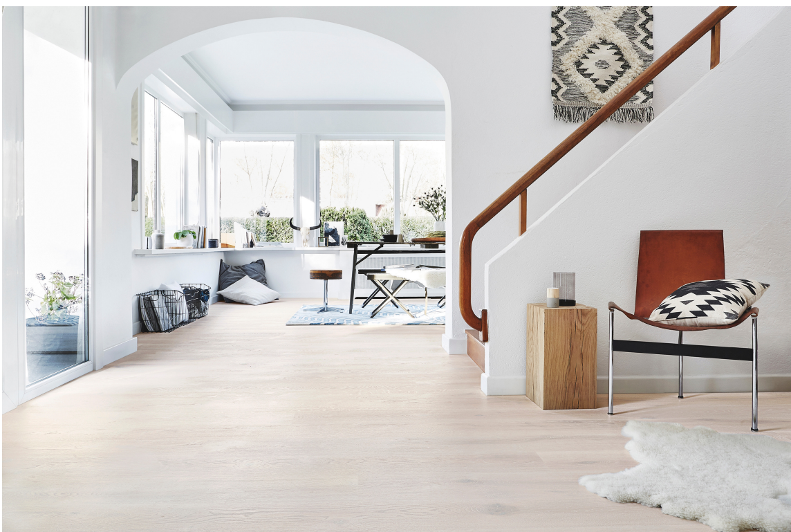
LUNT GULV: Et lyst tregulv varmer og gir liv til et luftig og åpent interiør.