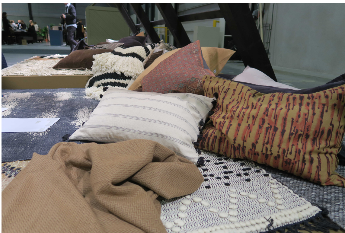
LUNERE: Det kommer mer og mer tekstiler, også her i ulike brunnyanser.