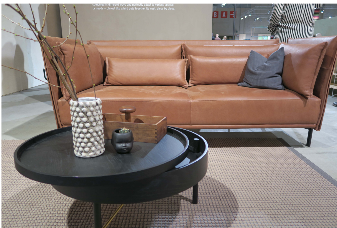
COGNAC: Cognacfargene var det flust av. Her kombinert med blå tekstiler - tidsriktig nok.