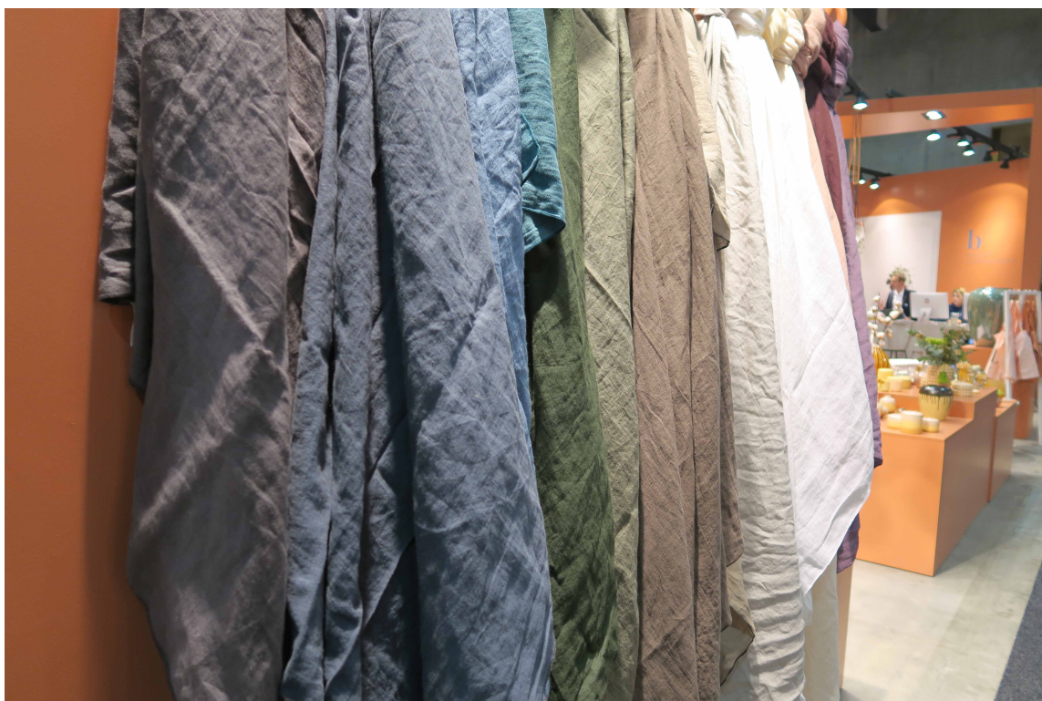
TEKSTILER: Det var mye tekstiler å se på messen. Naturfarger; brunt, grønt og blått var det mye av. Her, som det seg hør og bør, på en varm, rødbrun bakgrunn.