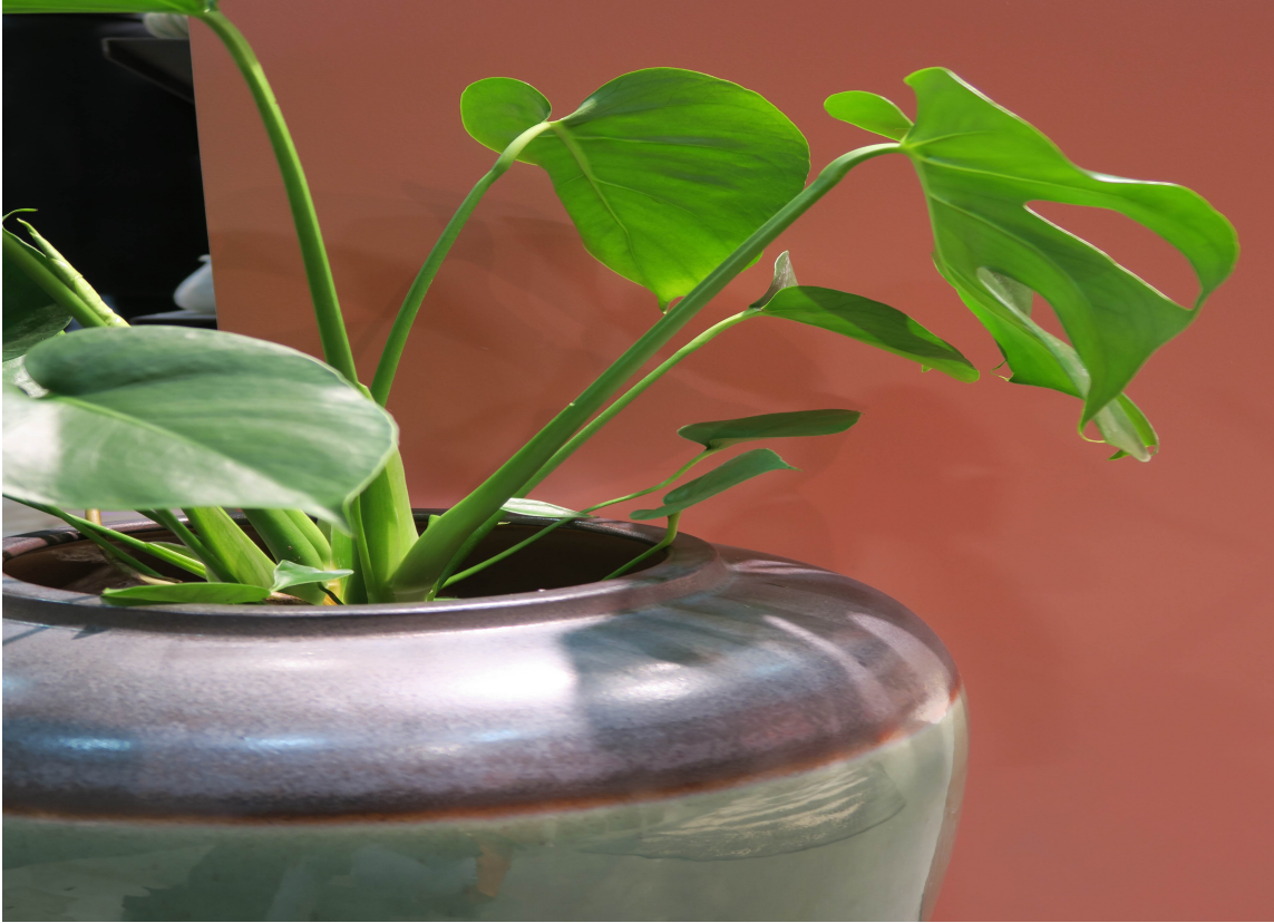
OVERALT: Store, grønne planter, runde former og brente rødtoner var gjennomgående på hele messen.

– Vi ser en oppvarming av farger: mettede gulfarger, nyanser av rødt, grønt og blått.