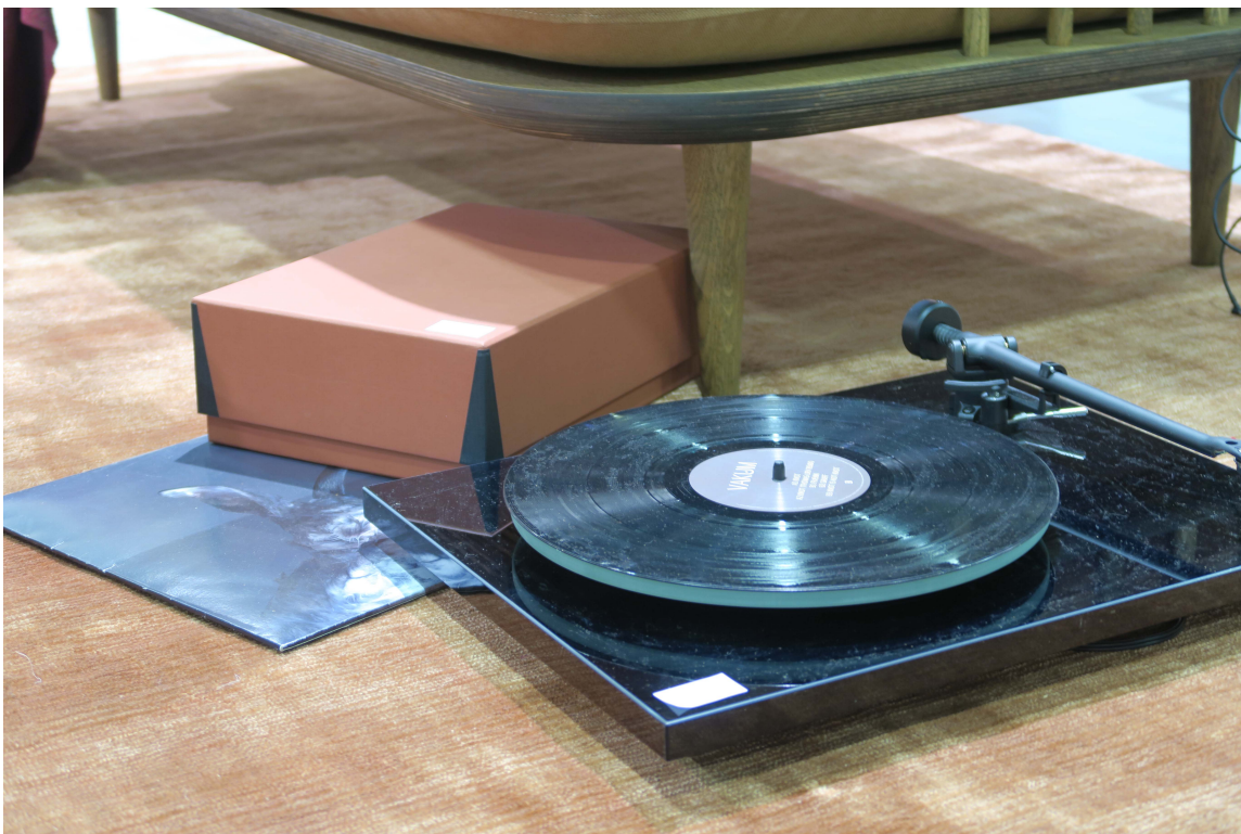
HVERDAGSMAGI: Hverdagsritualer var tema for årets messe. På tendensutstillingen var det derfor også lagt vekt på de små tingene.