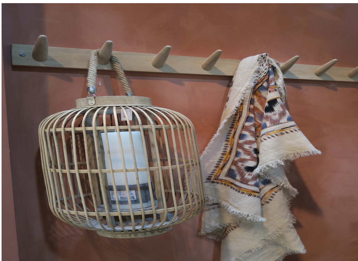
LYST TRE: Det var ikke mangel på de rødlige fargene. Her i kombinasjon med lyst tre.