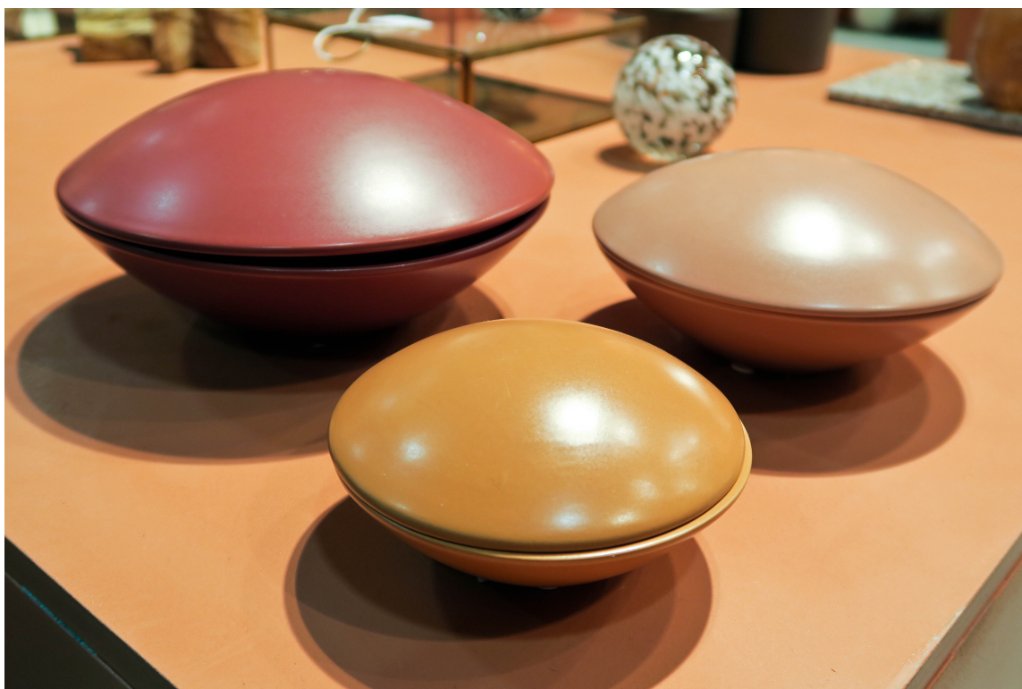
FARGER: Her ser du en fargekombinasjon som ikke var vanskelig å få øye på på de ulike utstillernes stands.