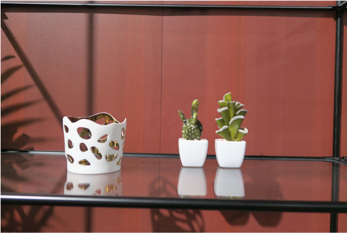
RØDT: Mørkere rødtoner var også å finne på messen.