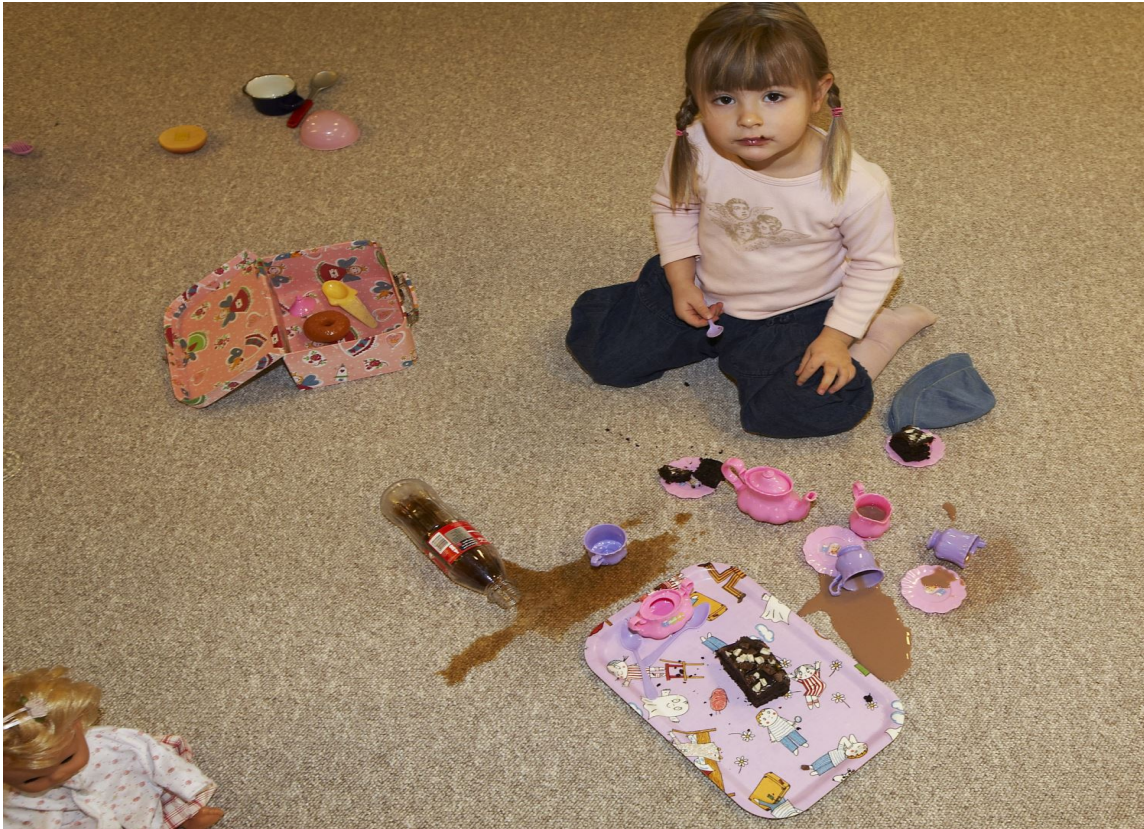
FLEKKGARANTI: Marquès-teppene fra Danfloor tåler det meste. Produsenten gir ti års garanti på flekkfjerning, lysekhet og gjennomslitasje.