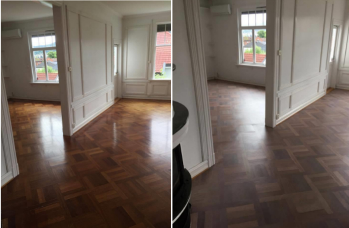
FØR OG ETTER: Bildet til venstre viser merbaugulvet før det er gjort noe med. Bildet til høyre viser gulvet etter at det har blitt slipt ned, satt inn med TreStjerner Gulvolje hvit og mattlakkert.