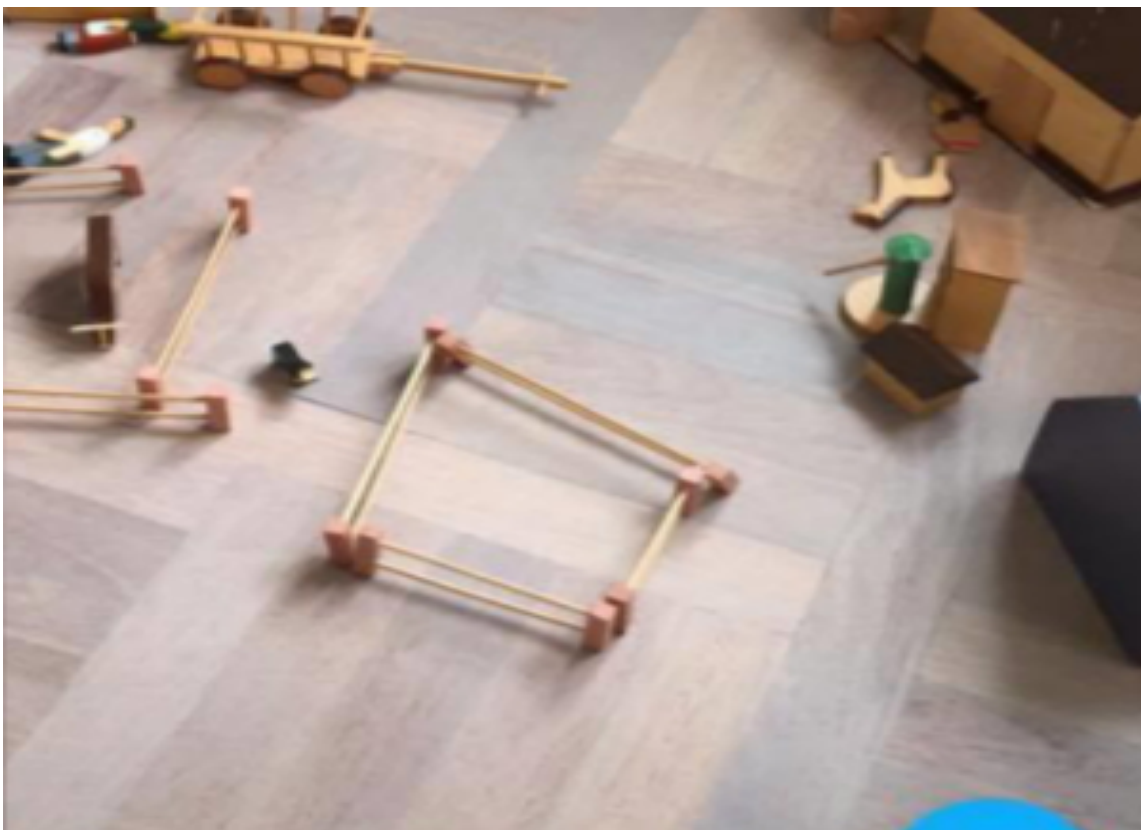
BEHANDLET: Slik kan et merbaugulv se ut etter at det har blitt slipt ned, påført Gulvolje hvit og deretter mattlakkert.