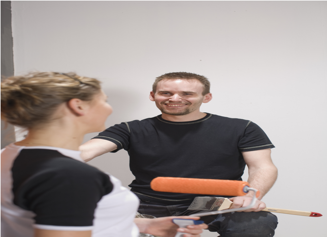
VENNLIG HJELP: En hjelpende hånd kommer alltid godt med.