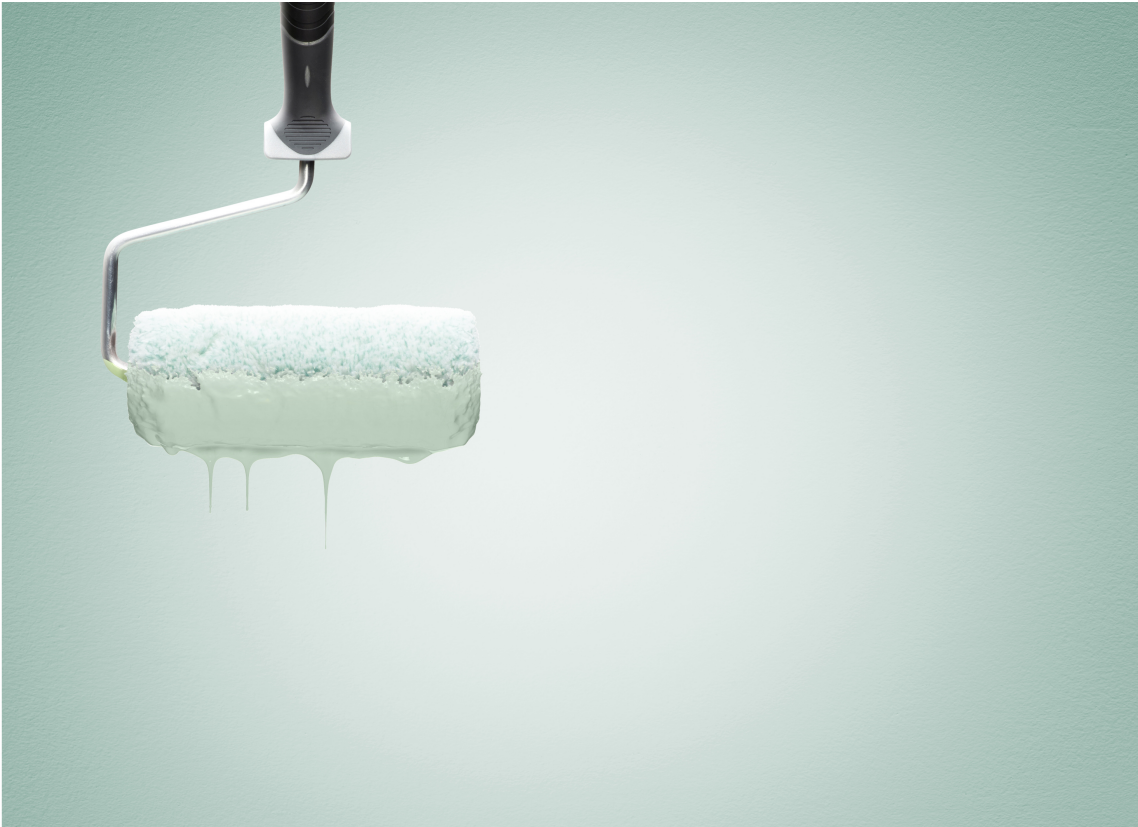
FORT GJORT: Du maler veggen mye raskere med rull.