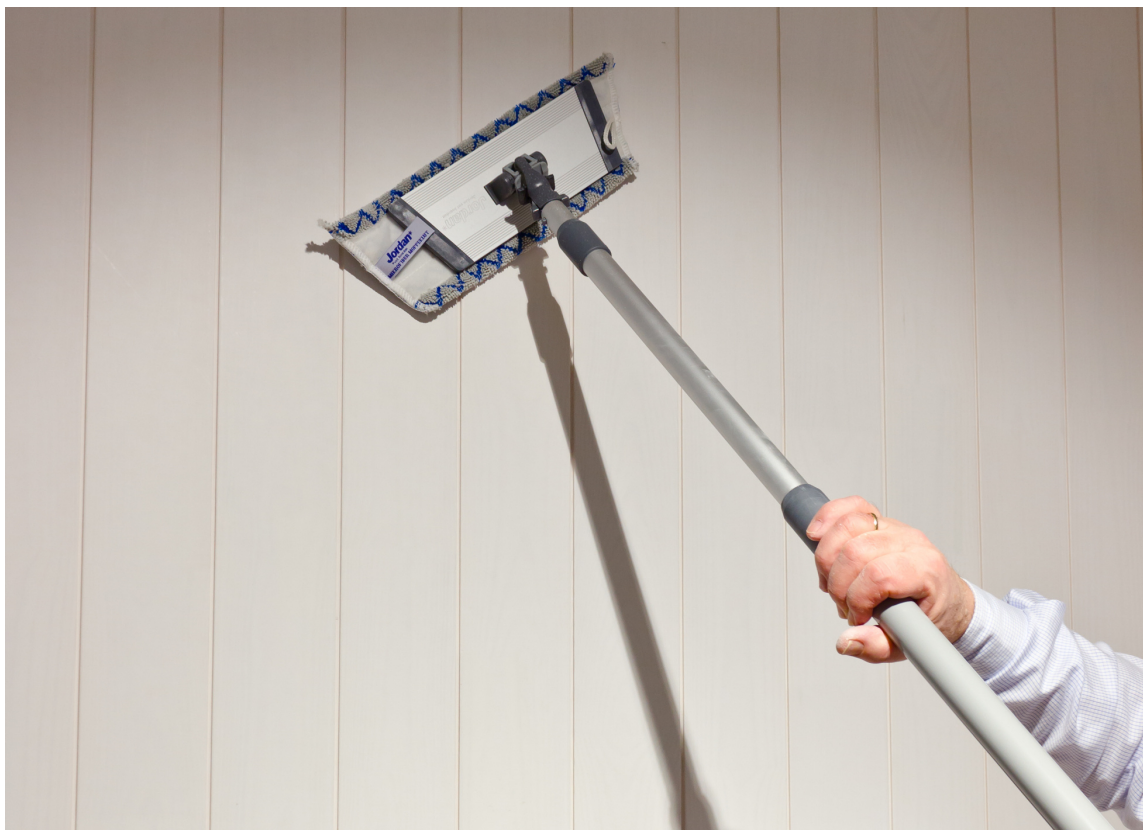
FORARBEID: Du sparer tid på å gjøre forarbeidet nøye med en gang.