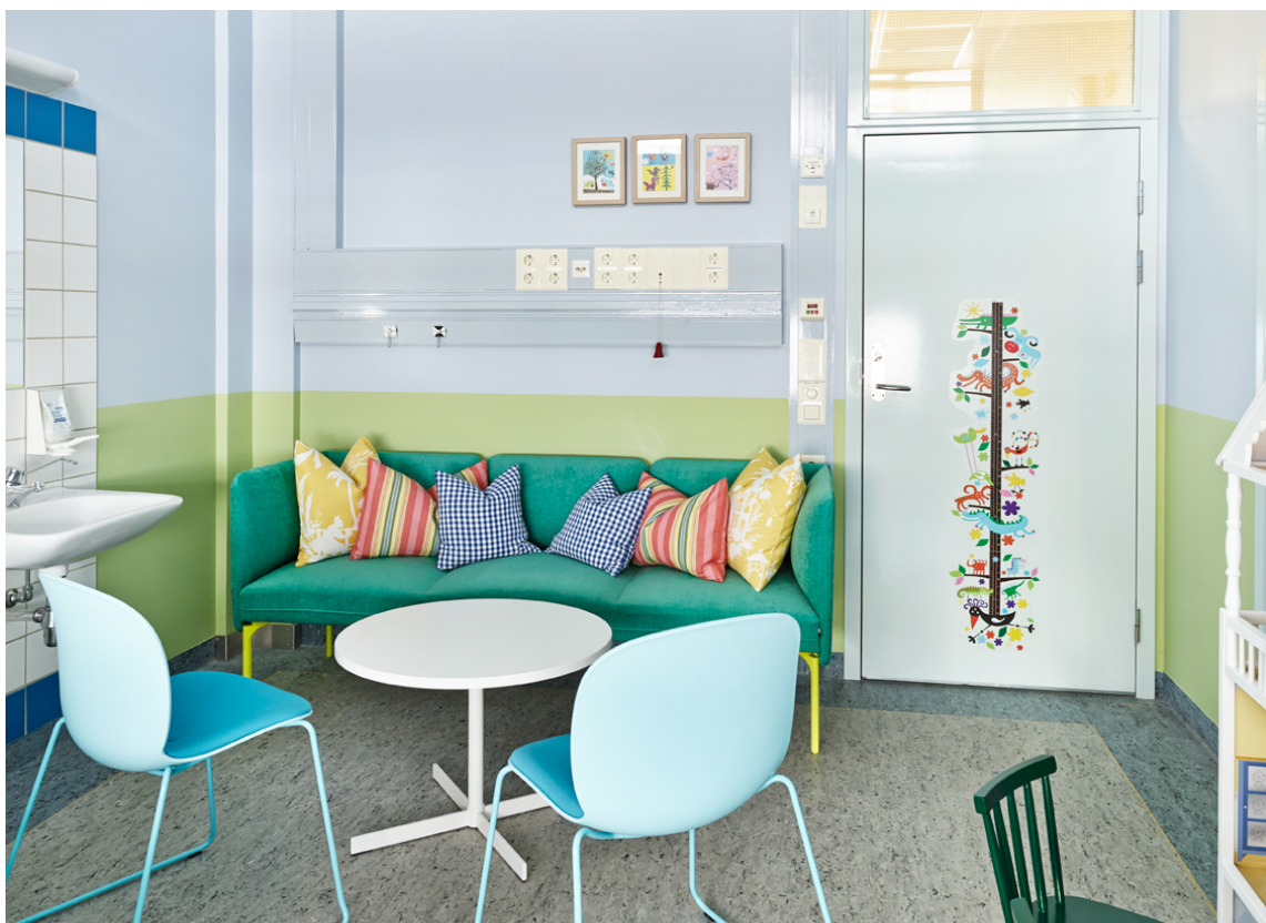
ULLEVÅL: I tiden som kreativ leder i Fargerike fikk Dagny, sammen med Stine Sofies Stiftelse, farger inn i undersøkelsesrom for barn mistenkt utsatt for seksuelle overgrep.