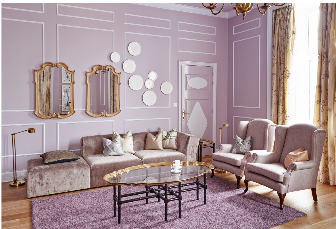
DISKUSJON: Gjestene på lanseringsfesten ble tatt i mot i en stue med lavendelfargede vegger og tak. En perfekt ramme for fargedebutt.