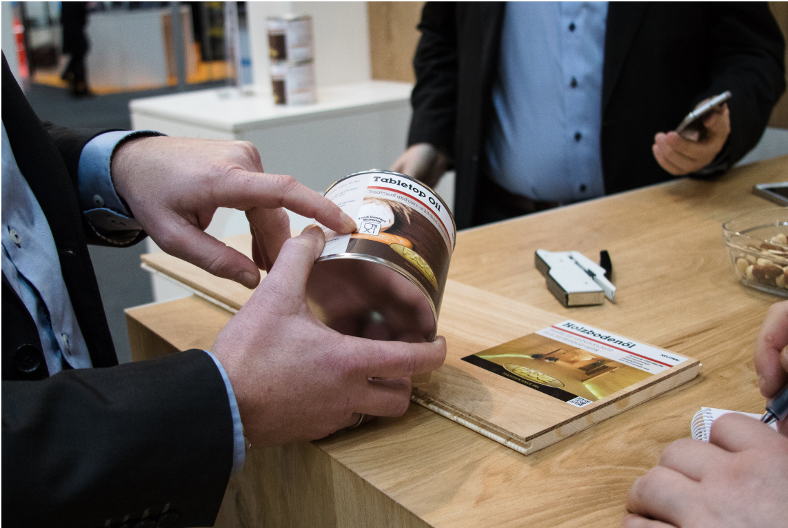
OLJE TIL MATEN: Et av Faxes nye produkter heter Table Top Oil. Det er en olje uten farlige stoffer som er godkjent for alle europeiske kjøkkenbenker.