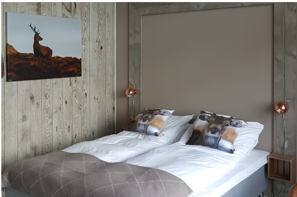
PUSTE UT: Innendørs er det dempede farger i naturens egen palett som regjerer. På «Hjortesuiten» er temaet gjennomført til punkt og prikke.

Ideen om et hotell i havgapet kom i 2011. Da var det behovet for en bedre og mer egnet overnattingsplass for bedriftsmarkedet som satte i gang tankeprosessen. I mai 2016, etter et drøyt års bygging, sto Værlandet Havhotell ferdig. I dag er hotellet til glede for både bedriftskunder og turister som vil oppleve øyriket på Vestlandet.