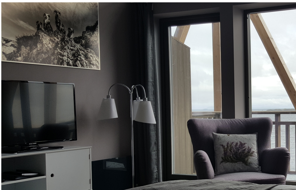
LUNT OG STILIG: «Villsauen» er en av to suiter som er handikaptilpasset. Veggene er malt i fargen Pilates fra Nordsjø, og er valgt for å få et lunt, men samtidig stilig, uttrykk.