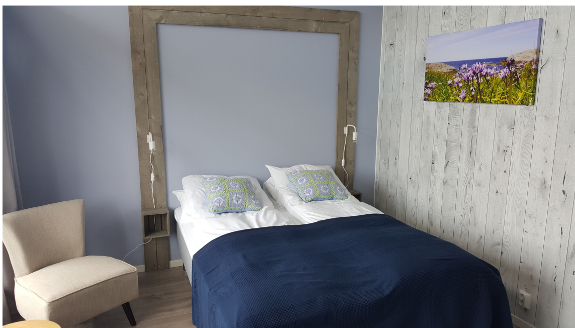
BLOMSTRER: Rommet som kalles «Blåstjerna» er oppkalt etter den sjeldne blomsten Scilla Verna som vokser vilt på Værlandet. Kystblåstjerne er det norske navnet på blomsten. Den lyse, lette blåfargen veggene er malt i er tatt fra midten av blomsterbl