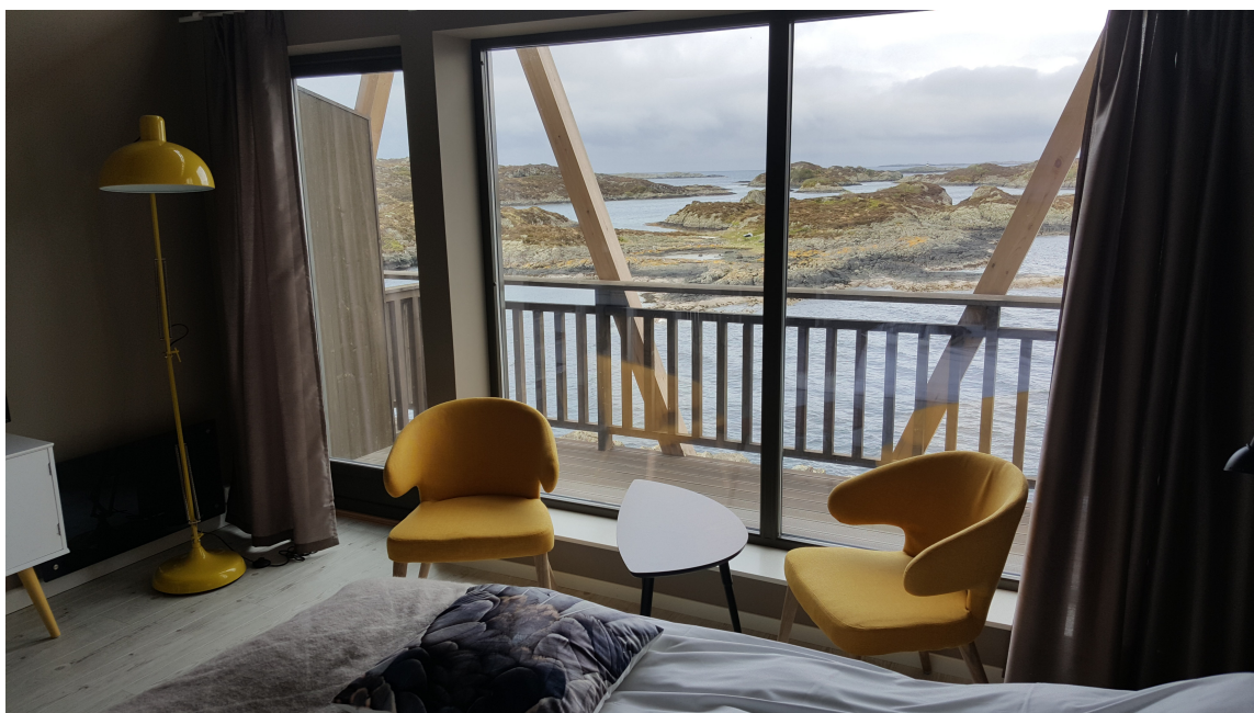
GJENNOMTENKT: Den spreke, gule fargen ble tatt inn i rommet «Havørna» for å få et mer moderne preg og unngå «hyttefølelsen». Fargen er inspirert av ørnens nebb og klør.