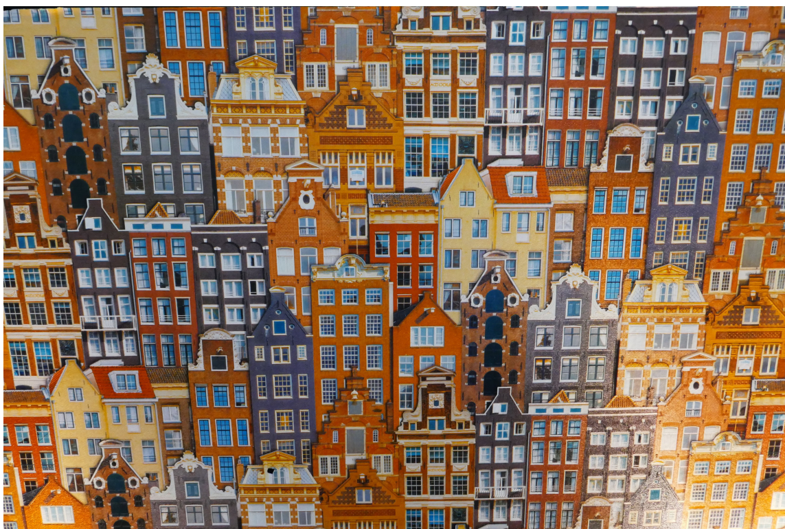
TOKLANG: Kombinasjonen blått og brente gulrøde toner klinger godt. Her på et tapet.