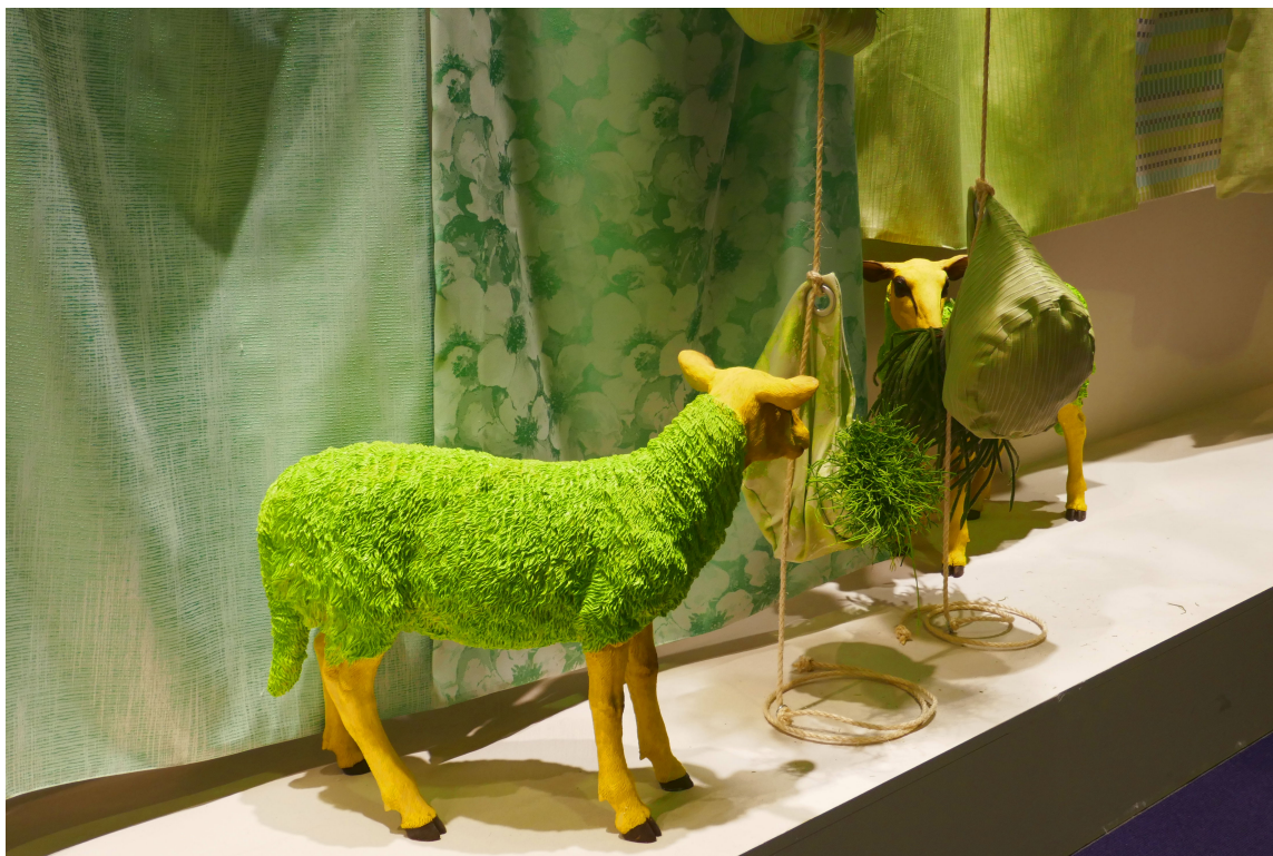
VITALT: Det er flere enn Pantone som satser på vitalt gulgrønt i år.