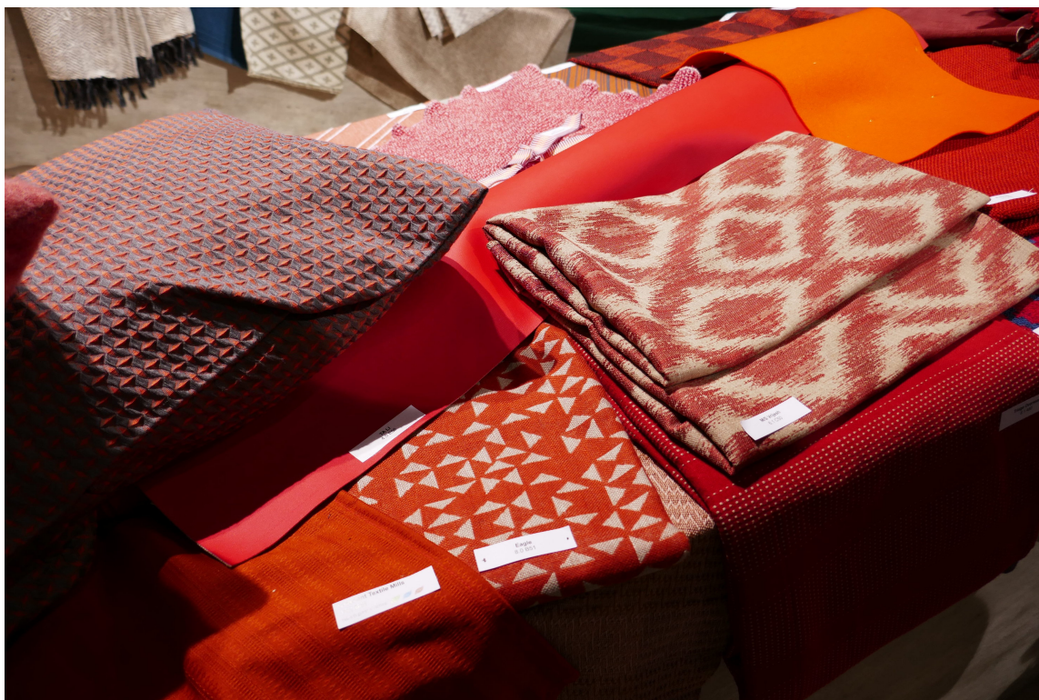
TRADISJON: I bunken av tekstiler er mye inspirert av eldre veveteknikker.