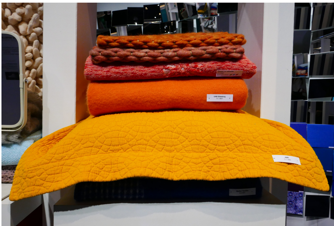
FRISKT: Nabofargene rødt, oransje og gult i aktuell samklang.