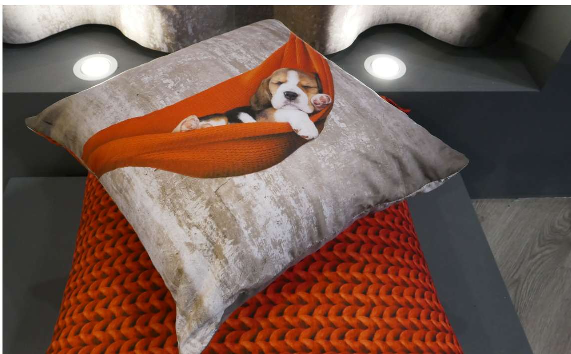
BLIKKFANG: Motivet på puten fanget messetravere med slitne bein.