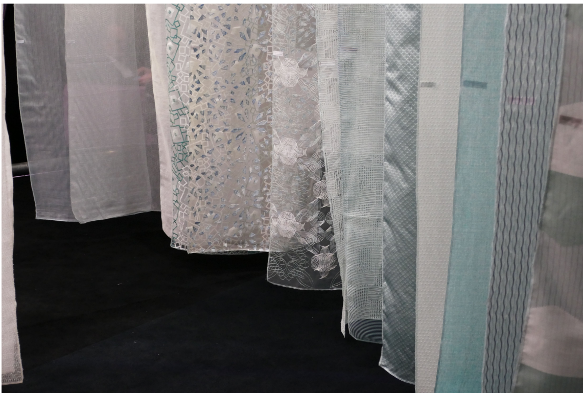
FLORLETT: Også i denne kategorien fristes det med grønt og blågrønt.