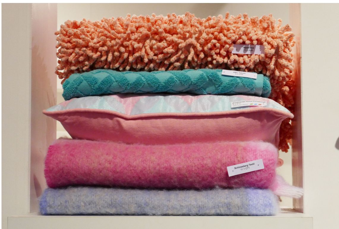
ROSA: Rosa er aktuell i kombinasjoner etter smak og behag.