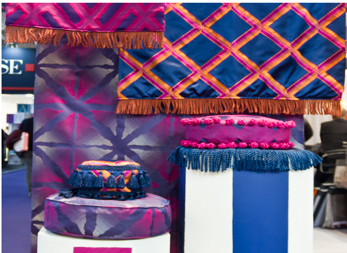
STORE KONTRASTER: Her en frisk kombinasjon, for de som liker store kontraster.