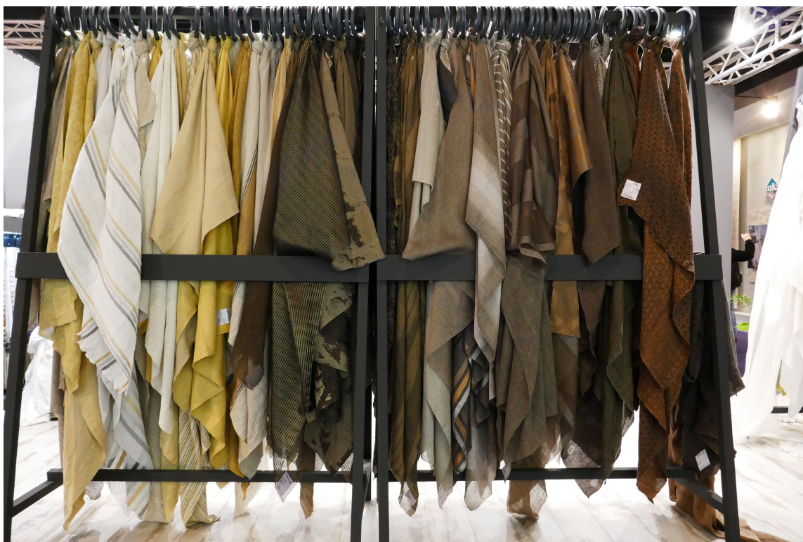
BRUNT: Et syn som behager et norsk øye. Lin i utallige brune varianter over mot gult.