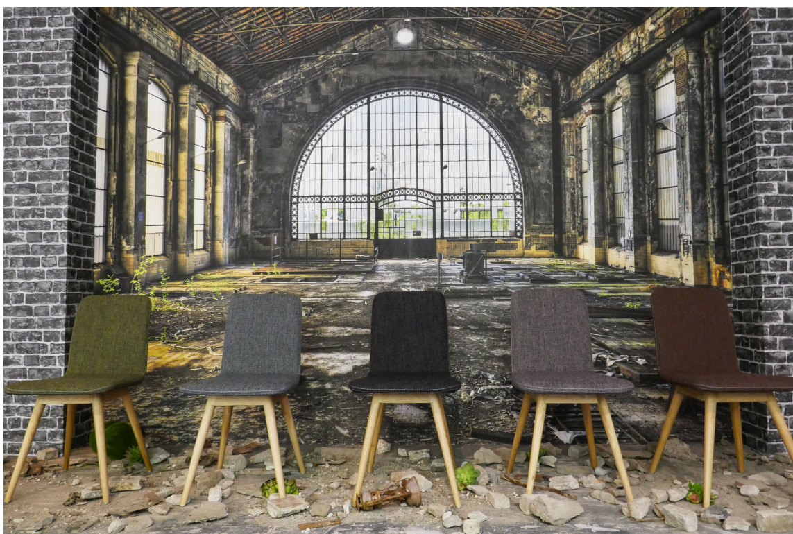
KONTRASTER: Men like fullt harmonisk. Enkle stoler i dempede naturfarger, myke tekstiler og lyst treverk mot en rå industrihall (fototapet).