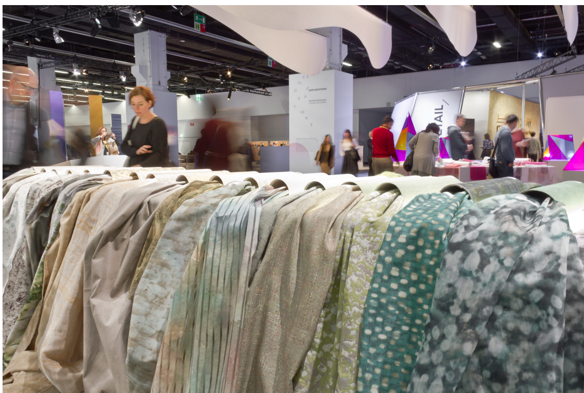
GRØNT: Det var ikke langt mellom de duse grønntonene.