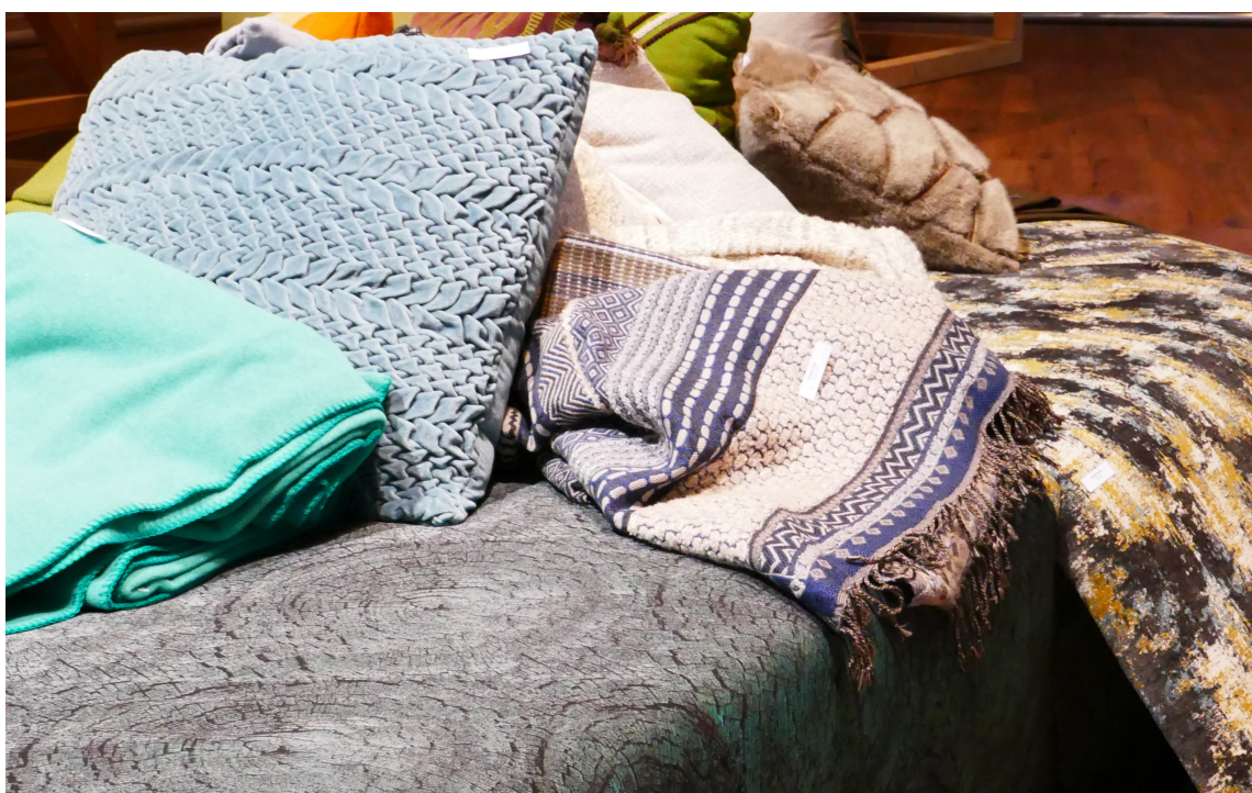
HELE SPEKTERET: Det var blått i alle nyanser på messen.