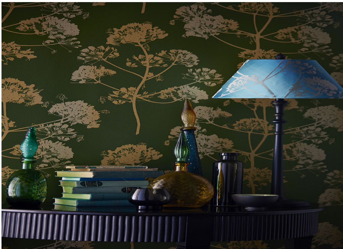
FLERFARGET: Ved å variere hovedfargen fra rom til rom, får hvert rom unik karakter. Dyp grønn er et harmonisk følge til dyp blå. Velg farger som er like sortaktige og piff opp med små kontraster. Tapetet er fra Harlequin/Tapethuset.