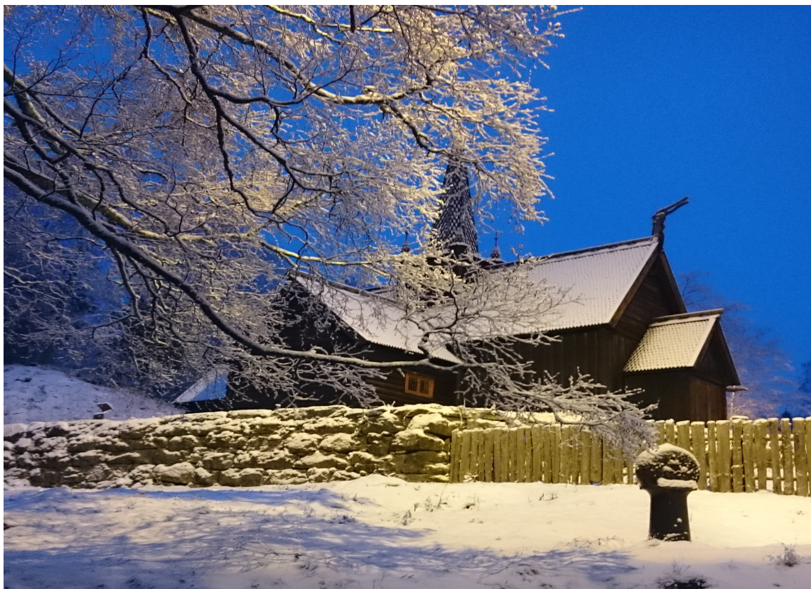
VINTERNATT: Fang inn de gode stemningene med kamera, og studer farger og tekstur i motivet. Plutselig kan du ha funnet akkurat din fargepalett.