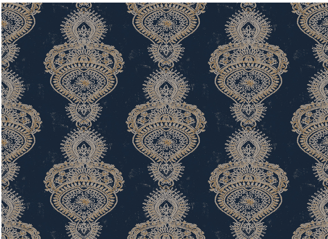
VEGGPRYD: Et mønster skaper føringer for stil og atmosfære. Vi aner her litt orientalsk varme som kontrast til det kalde norske vinterlandskapet. Tapetet er fra Fantasi Interiør.