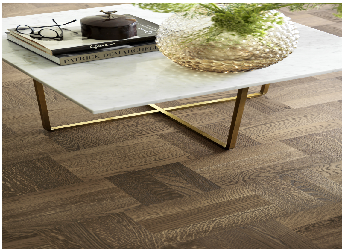
MYKT OG HARDT: Sett sammen materialer du synes klinger godt sammen. Marmor, messing og mørkt tre oser av kvalitet og er en harmonisk trio. Parketten er fra Tarkett.

Nøkkelord: Fasjonabelt, mykt, lunt, taktilt, tildekket, store runde former, polstret, tyngde i mengde og volum. Ikke overlesset. Mye av lite. Små overraskelser.