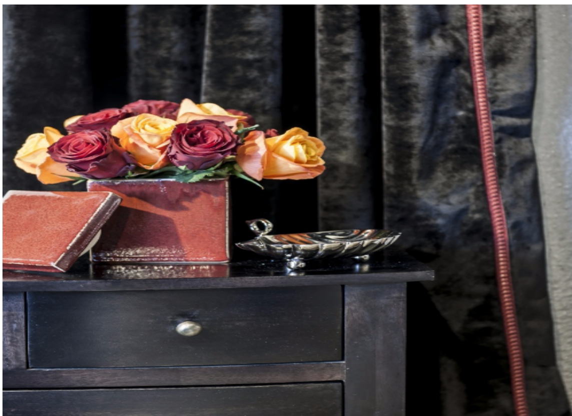
VELUR: Myke, ensfargede, tunge tekstiler i rikelige mengder skaper atmosfære av noe varig. Behagelig for øyet, øret og en invitt til berøring. Velur fra Green Apple.