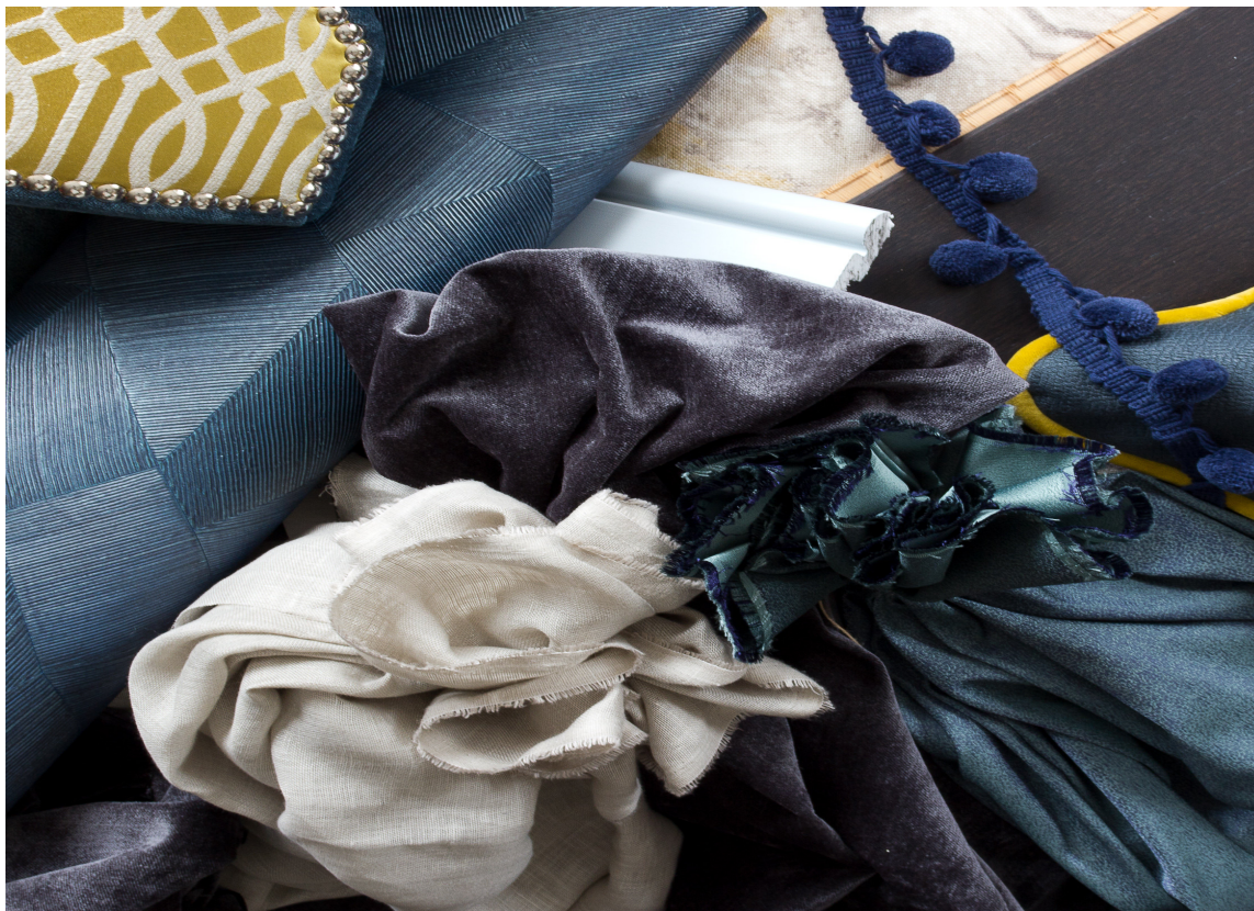
GOD BLANDING: Velg mest av den fargen du ønsker skal prege helheten. Stil og atmosfære skaper du ved å kombinere ulike materialer. Tapet og tekstiler er fra Green Apple.

Overflaten påvirker også hvordan vi opplever fargen. Det er kombinasjonen av flere farger/nyanser og miks av materialer som skaper den rette stemningen og stilen. Du kjenner godfølelsen i magen når det stemmer.