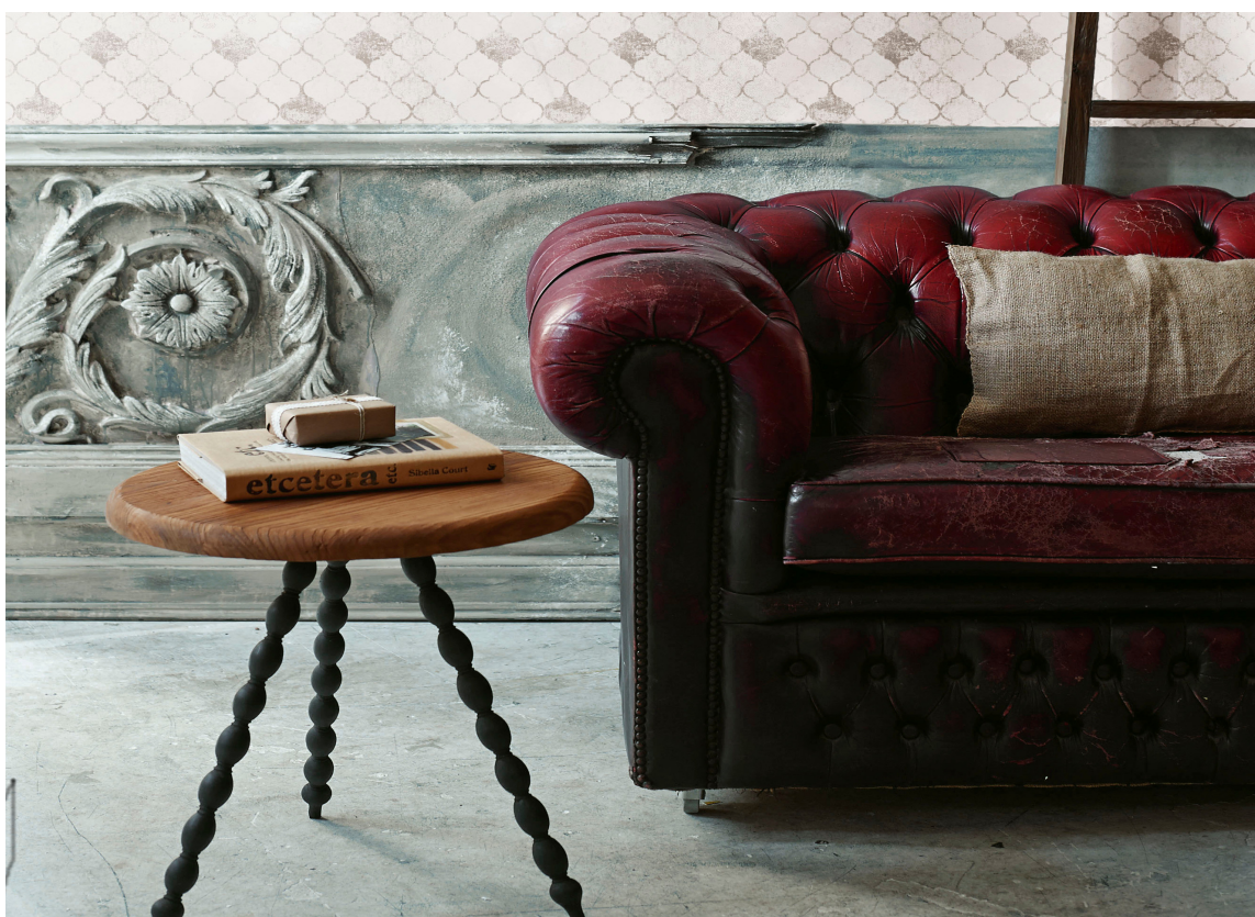
BLANKT ER HARDT: Form og materiale påvirker opplevelsen av fargen. Chesterfieldsofaen virker stram til tross for myke former og rød farge. Trukket i velur hadde den ropt «velkommen oppi».