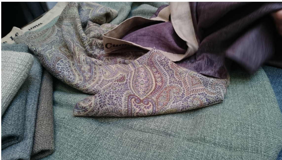
TEKSTILER: Myke tekstiler i svale nyanselike farger luner uten at det blir for ullent og varmt.