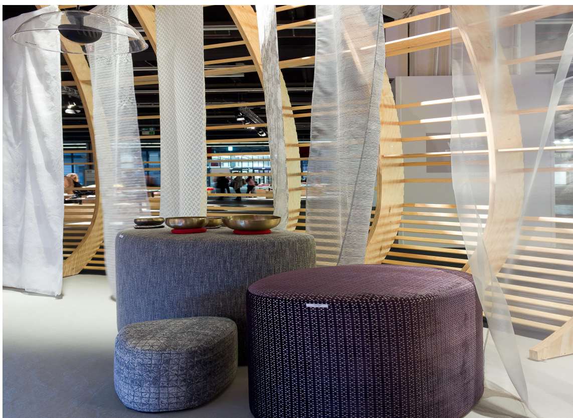
KJØLIG KOMBINASJON: Flate og transparente tekstiler gir interiøret et luftig, men kjølig preg.