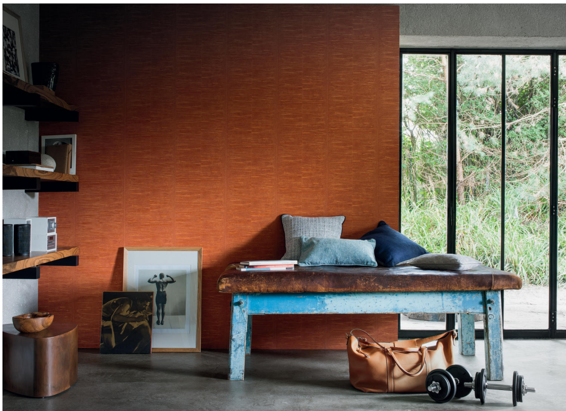
TAPETKONTRAST: Noen ruller med høstgyllent tapet skaper lunhet i rom med murvegger og betonggulv. En blåmalt rustikk benk med lærsete binder det varme og kalde, harde og myke fint sammen. Tapetet er fra Casamance/GreenApple.