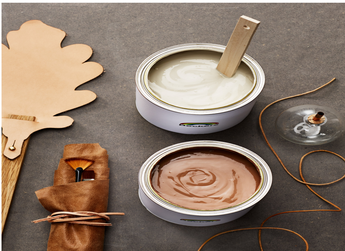
MASKULINT: Fargene fra paletten kan kombineres i det uendelige og skape nettopp uttrykket som er «ditt». Slette flater, harde materialer, dempede rødtone, grovt lær og rustikt tre skaper assosiasjoner til en maskulin stil. Fargene er fra Beckers.