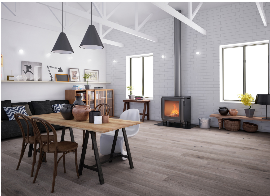
GULVET RULER: Det er ingen regel som at alle rom må være like. Kanskje holder med et lunt gulv og noen innslag av gyllent metall og keramikk for å få varmen inn på kjøkkenet? Her er det lagt Arena Slottsplank.