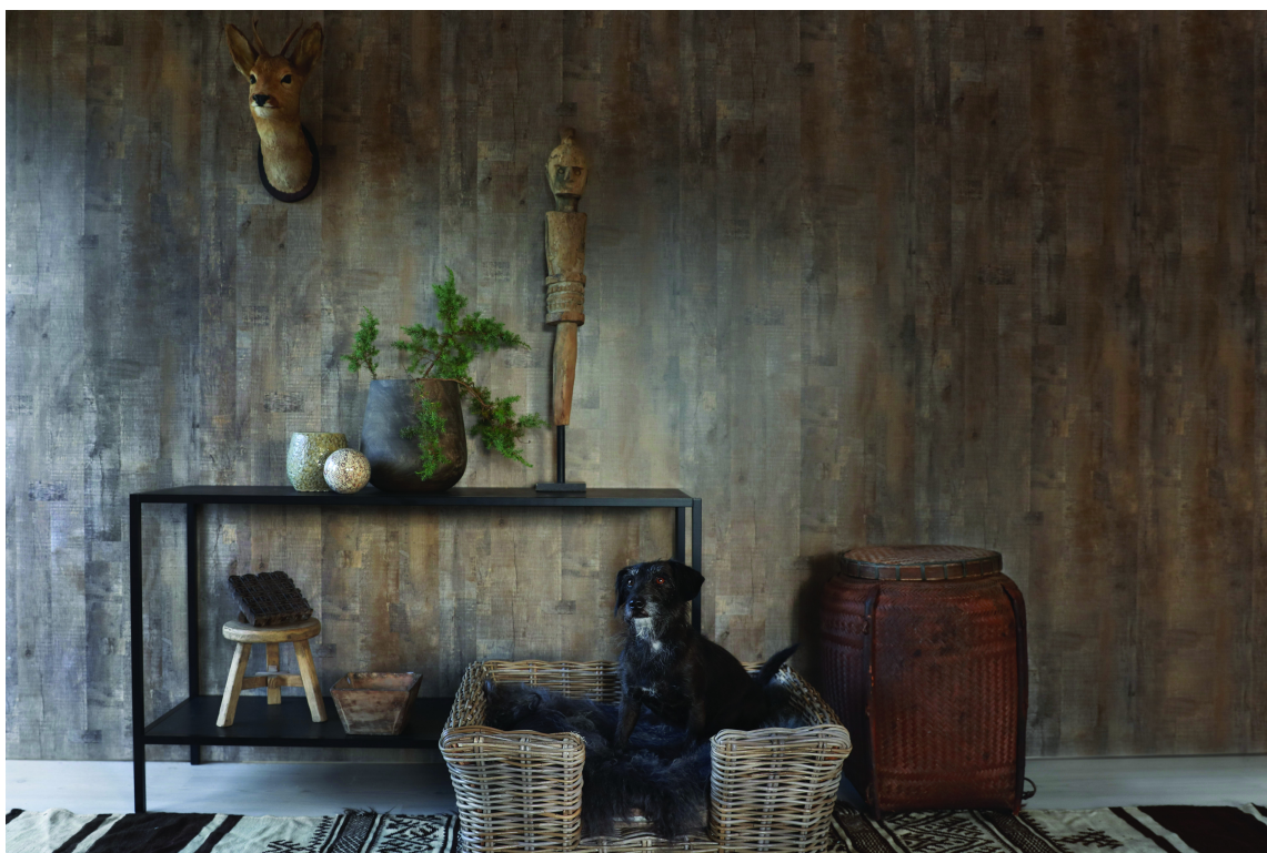
MØRKT: Her er det brukt mørke høstfarger. Veggene er sortaktige, med en gyllen undertone. Det transparente uttrykket skaper liv, og sammen med det lysere gulvet gjør det rommet mer lunt enn mørkt. Veggene er fra walls4you.