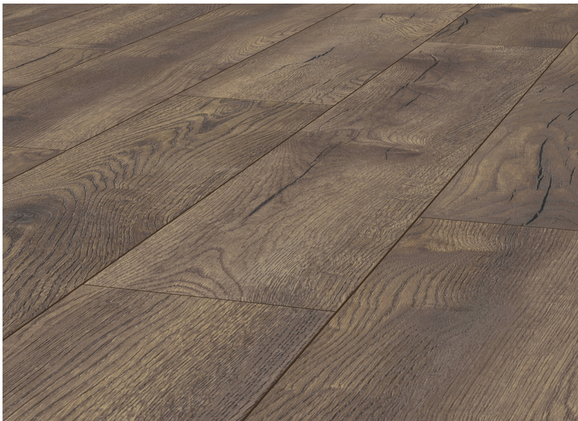
TUNGT GULV: I denne paletten passer det fint med et «tungt» gulv. Tyngde skapes av farge, format og tekstur. Dette mørkbeisede eikegulvet er fra Kronotex.