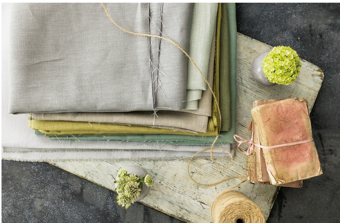
FEMININT: Mengde og materialenes karakter er også avgjørende for å skape ønsket uttrykk i paletten. Mye tekstiler og myke materialer leder mot en mer feminin stil.