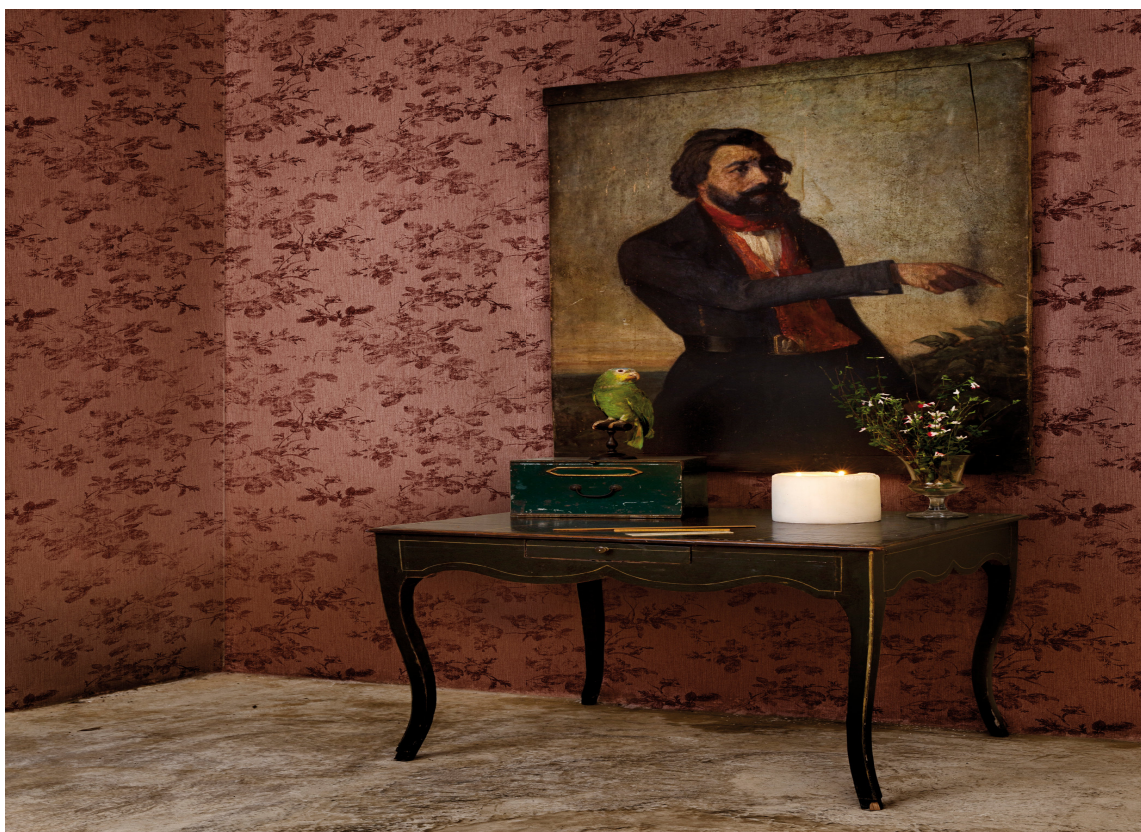
SAMSPILL: Atmosfæren i et rom skapes av samspillet mellom vegger, gulv og innbo. Her byr maleri og bord opp til en stil, som fullføres med tapet. Det harde gulvet bryter og viser at vi er i et moderne interiør. Tapet Cordonne fra GreenApple.