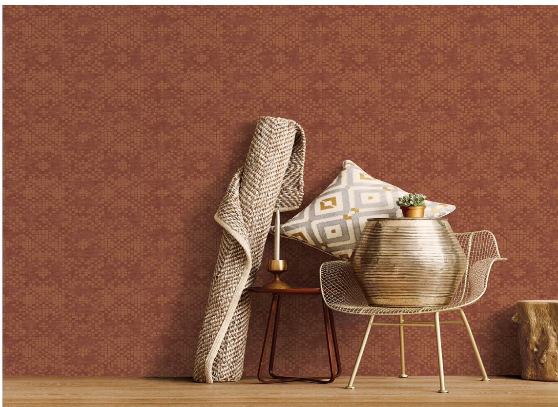
TON-I-TON: Et rødt tapet dempes av materialer i lyse naturtoner. Variasjon mellom fin og grov struktur, blanke og matte flater, myke og harde materialer skaper forsiktede kontraster.