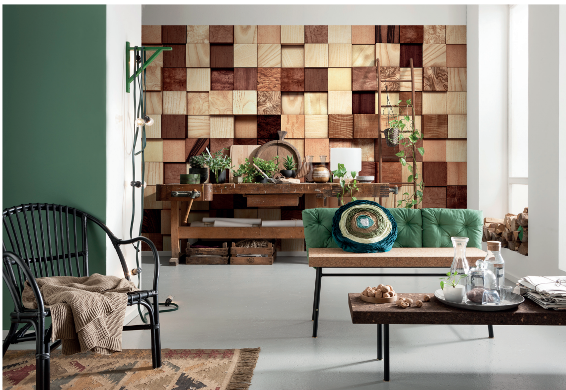
GRØNT: Grønn nevnes ofte som en trendfarge, og finnes i mange nyanser. Her er et drag av høst med kombinasjonen kork, tre og sortaktig grønn i et ellers lyst interiør. Veggene av trekubber er tapet fra Komar.