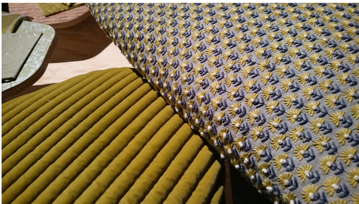
GULGRØNT: Gulgrønne nyanser og myke taktile tekstiler skaper liv og variasjon i paletten.