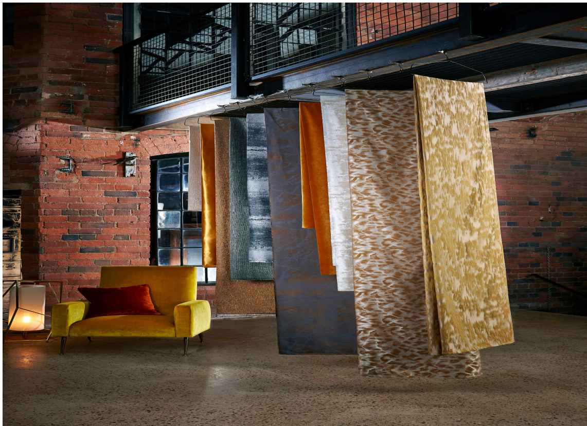
MØNSTERMIKS: Tekstiler luner for både øyet og øret. Variasjon i mønster og tekstur gjør helheten spennende. Du er på trygg grunn så lenge fargene er nyanselike. Tekstilene er fra Harlequin/Tapethuset.

Nøkkelord: Lunt rede, varme farger, slow-living, ekte varer, kvalitet, uformelt og koselig, stilisert og moderne, rustikk, enkel og skandinavisk, landlig, ull, velur, tungt, mykt, kontraster.