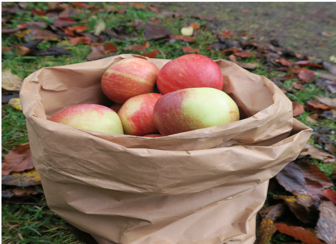
HØSTPALETT: Eplehagen en høstdag er fin inspirasjonskilde for deg som trives med høstfarger. Legg merke til spillet mellom blankt og matt, lyst og mørkt, kjølig og varmt.

La magefølelsen styre. Blås i om andre synes at en farge blir for mørk, eller kraftig. Det er du som skal trives hjemme hos deg. Forsk litt i mulighetene som ligger i høstpalletten som vi har kalt den Den frodige. Innred med farger, materialer, ting og tang etter ditt hjertes lyst.