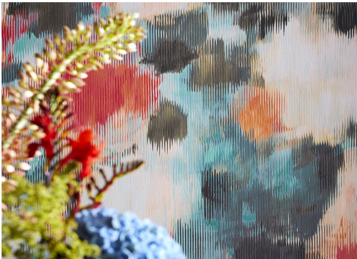
BASIS: Start gjerne jakten på farger med å finne et tapet du liker. Bruk fargene i tapetet som utgangspunkt for resten av paletten. Tapetet her fra Harlequin/Tapethuset.