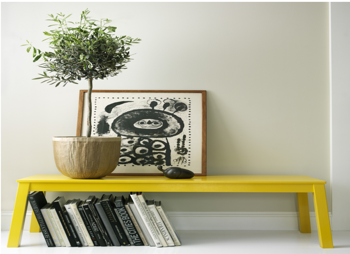
BLANK MALING: Et gult innslag kan være nok for å gjøre et hvitt rom nytt. Guldfargen blir ekstra lysende og kraftig når den males i en blank maling. Fargen er fra Beckers.