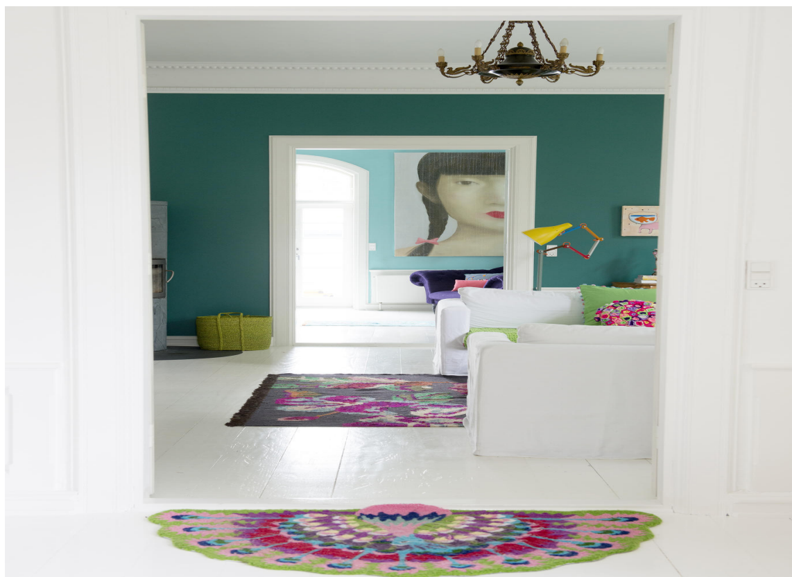
HVIT BAKGRUNN: Her bugner det av farger, likevel virker helheten lys og harmonisk. Hemmeligheten ligger i mengden hvitt, den roer og demper de andre fargene.