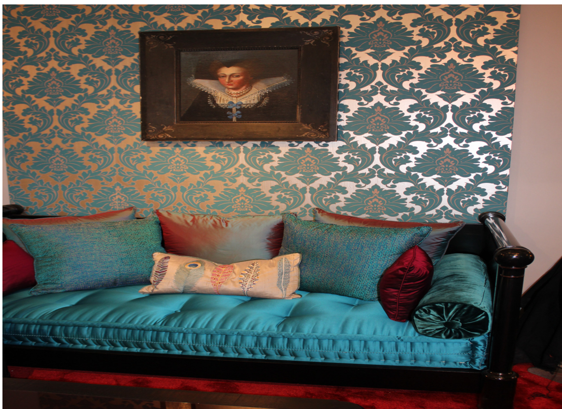
PERSONLIG: Arvemøbler gjelder som aldri før. Selv i et hvitt og moderne miljø, kan det være befriende med en krok som bryter og byr på en pustepause blant røttene våre. Hvis du liker det!