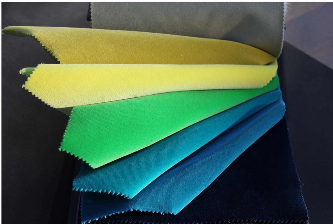
VELUR: Tekstilet som topper trendstatistikken for tiden er velur. Det finnes i mange rene, klare farger. Mykt å se på og mykt å ta på. Tekstilene er fra Green Apple.