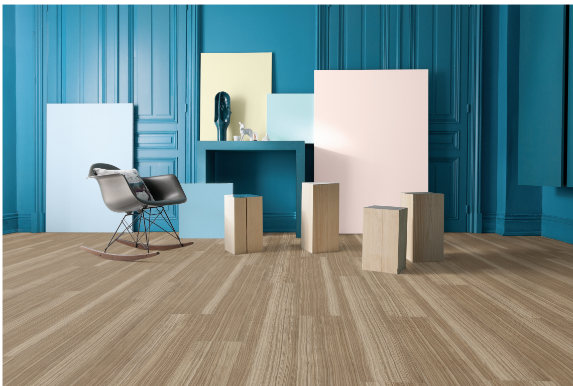
LYSE GULV: Lyse gulv skaper en lett og ren atmosfære i kombinasjon med sterke farger. Lyse gulv og hvitt løfter fram de andre fargene i rommet. Dette gulvet er fra Gerflor.