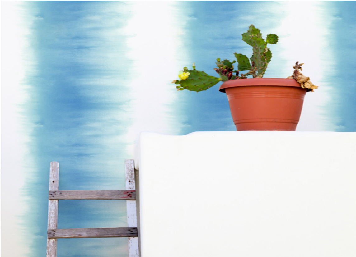
UTVANNET: Mønster med flytende overganger og akvarellaktige farger demper intensiteten i en ellers kulørsterk farge. For deg som vil ha rene kulørsterke farger, men er redd for at det blir «for voldsomt».