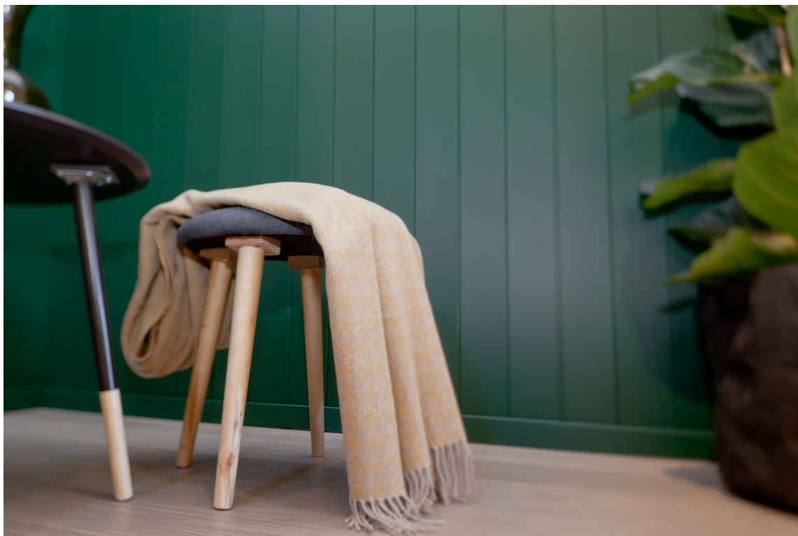
HARDT: I fabrikkens herdes malingen på platene med UV-lys. Det gir en meget hard og ripefast overflate.