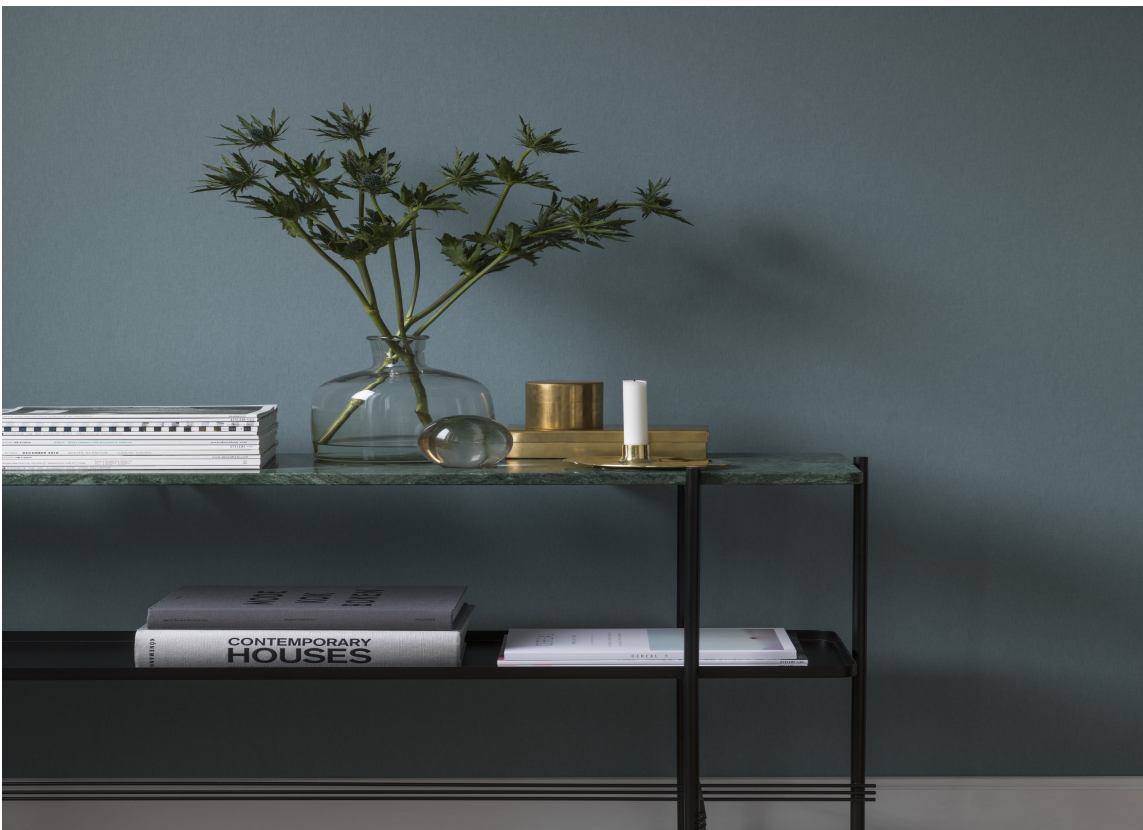
KLART: Det er ikke mye som skal til for å totalforvandle et rom og gjøre det klart for gjestene.