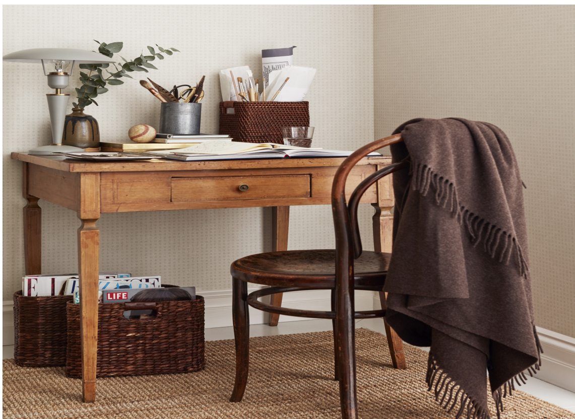
RASKT FERDIG: Forarbeidet er det samme, uansett om du skal male eller tapetsere, men med tapet blir du ferdig i ett arbeidsmoment deretter.