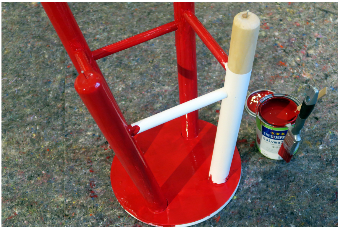
OPP NED: Når du maler er det smart å starte opp-ned. Og med en spiker i hvert bein, er det enklere å komme til når du snur krakken rett opp.