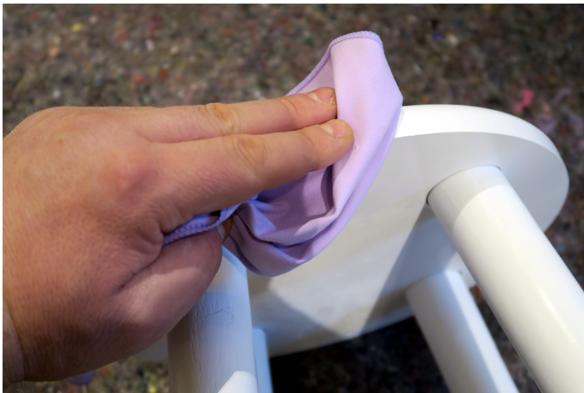
TØRK: Fjern pussestøv med en tørr mikrofiberklut.

Å fjerne støv fra pussingen er enkelt: Tørt fjernes med tørt. Derfor skal du bruke en tørr mikrofiberstøvklut. Tørk godt av over hele krakken. Når krakken er støvfri banker du inn en liten spiker under hvert bein. Det er mye lettere å male når beina kommer opp fra underlaget.