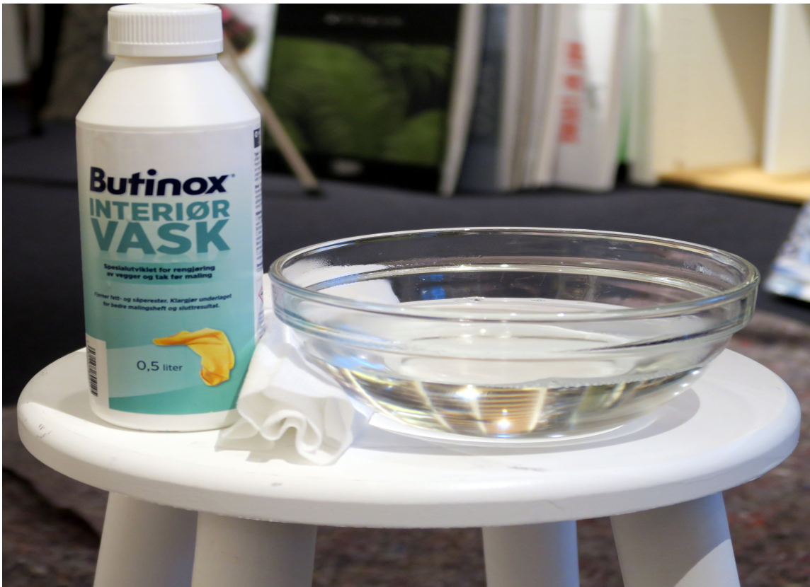
VASK: Bruk et egnet rengjøringsmiddel til å vaske krakken først.