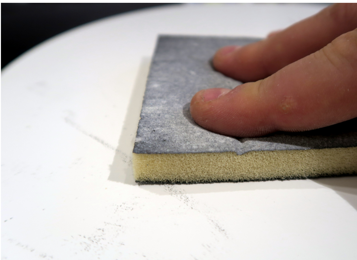
PUSS: Puss krakken med en slipepad.