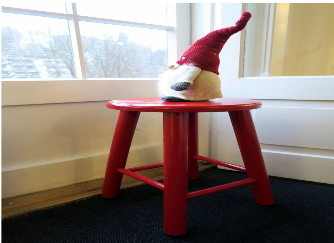
NISSEKRAKK: En rød krakk ved vinduet toppet med en nisse skaper julestemning. Krakken er malt med gulvmaling i fargekoden RAL3003.