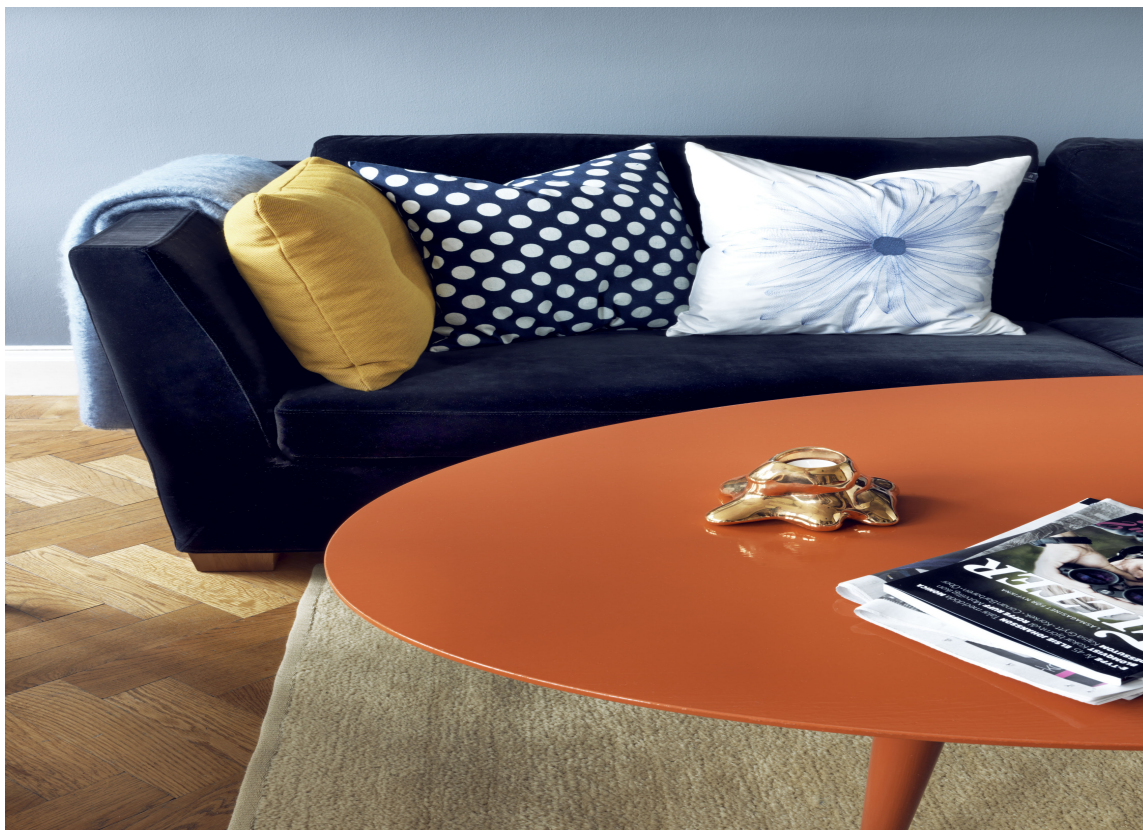
FREMHEVE: Vil du fremheve en flate eller skal den malte flaten oppleves som en kulisse? Sterke farger i høy glans, kan være effektiv på utvalgte deler og i kombinasjon med malte, matte flater.