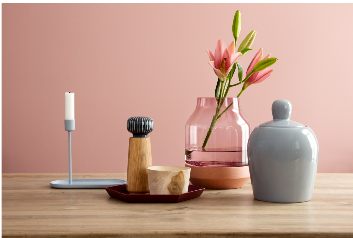
UTVALGT: Den største utfordringen med matte malinger er at de normalt er følsomme og dårlig takler våt avtørring og berøring. På utvalgte vegger med lav slitasje, er matte malinger lekkert og velfungerende.