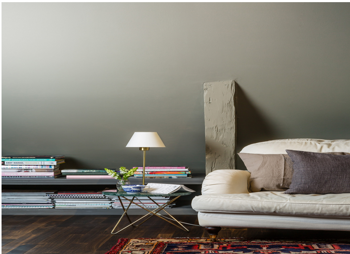
ROLIG: Mange opplever at matt maling gir et roligere rom og en mykere atmosfære enn et rom med blank maling.