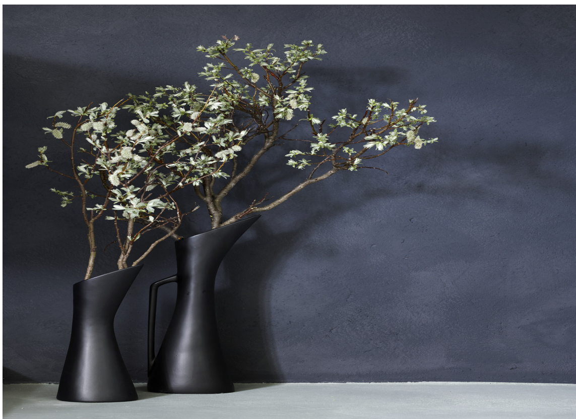
UNIK: Mineralsk kalkmaling gir null gjenskinn og derved en helt unik fargeopplevelse.