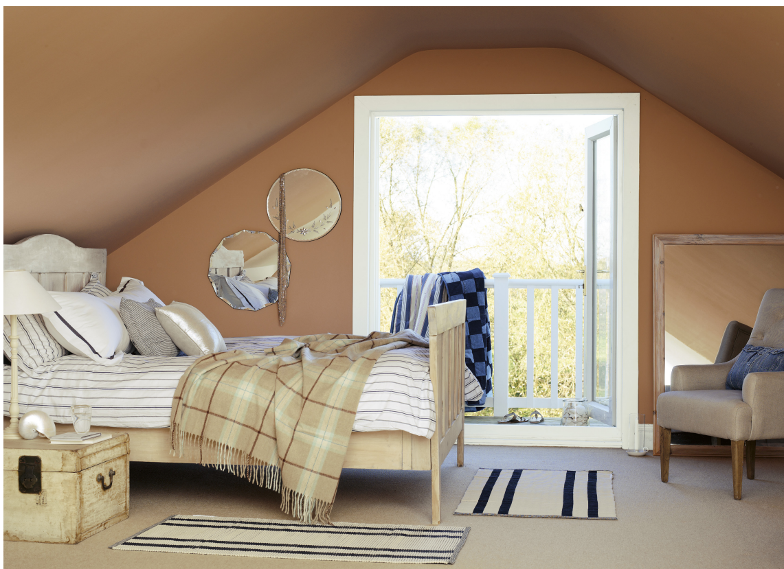
HELHET: Mal taket i tilnærmet lik farge som veggene for å skape en rolig helhet.