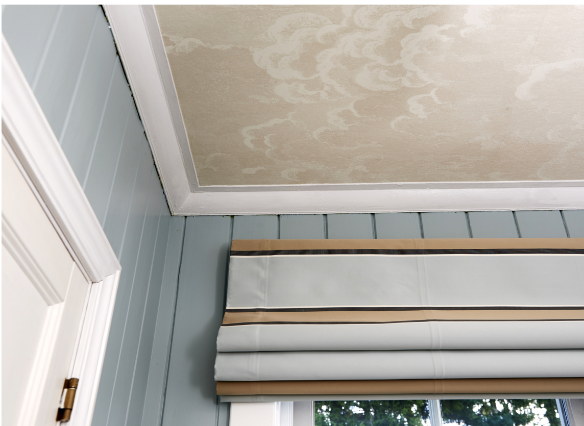
TAPET: Det finnes andre alternativer enn å male taket. Hva med å plukke ut et tapet du liker? Det finnes mange gode alternativer for soverom.