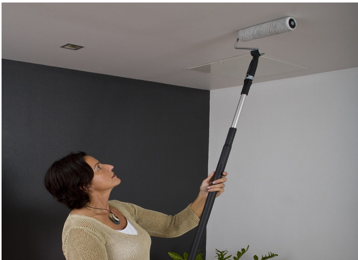
LEKENDE LETT: Med rull på forlengerskaft er det enkelt å male taket.

I denne videoen kan du se Jordan demonstrere hvordan du kan male tak.