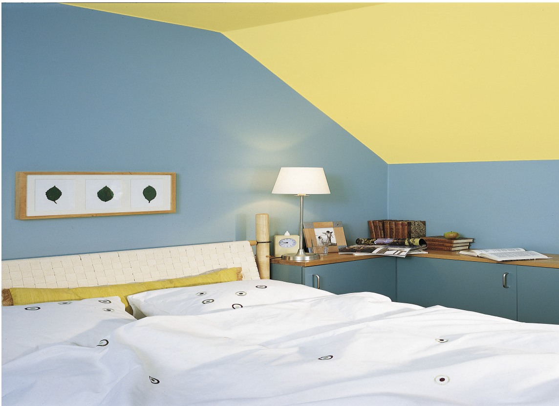
ET LØFT: Gi soveromstaket et løft ved å male det i en annen farge enn hvitt!