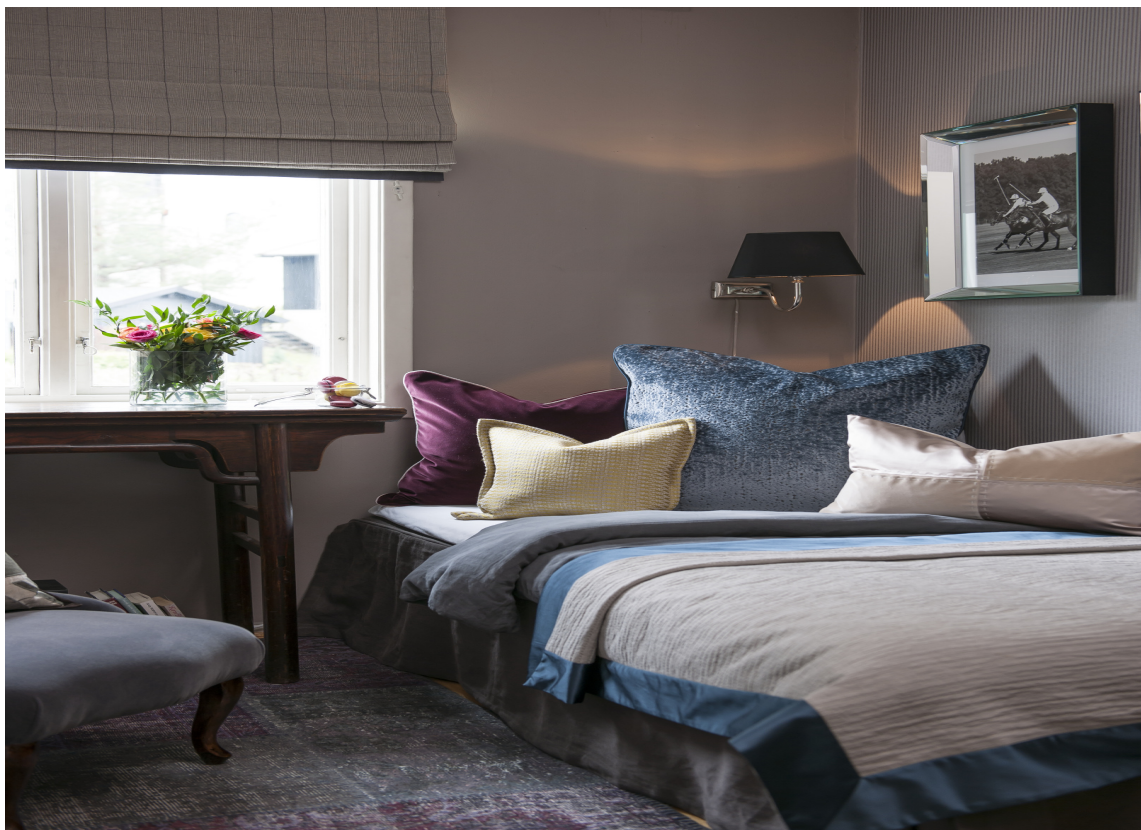
TREKK GARDINEN TIL TAKET: Veggen virker høyere dersom gardinen er festet helt opptil taket.