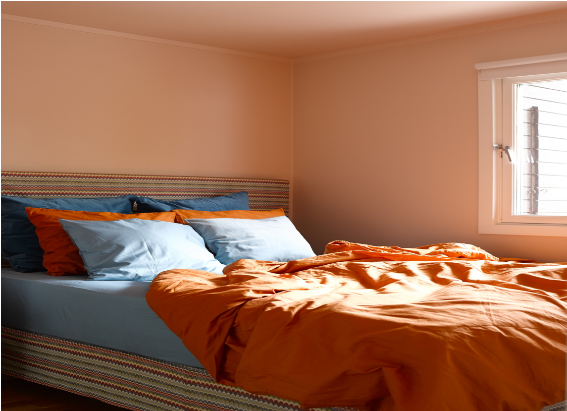
LIK FARGE TIL TAK OG VEGGER: Dette skaper helhet, og man unngår at et lite rom stykkes opp.