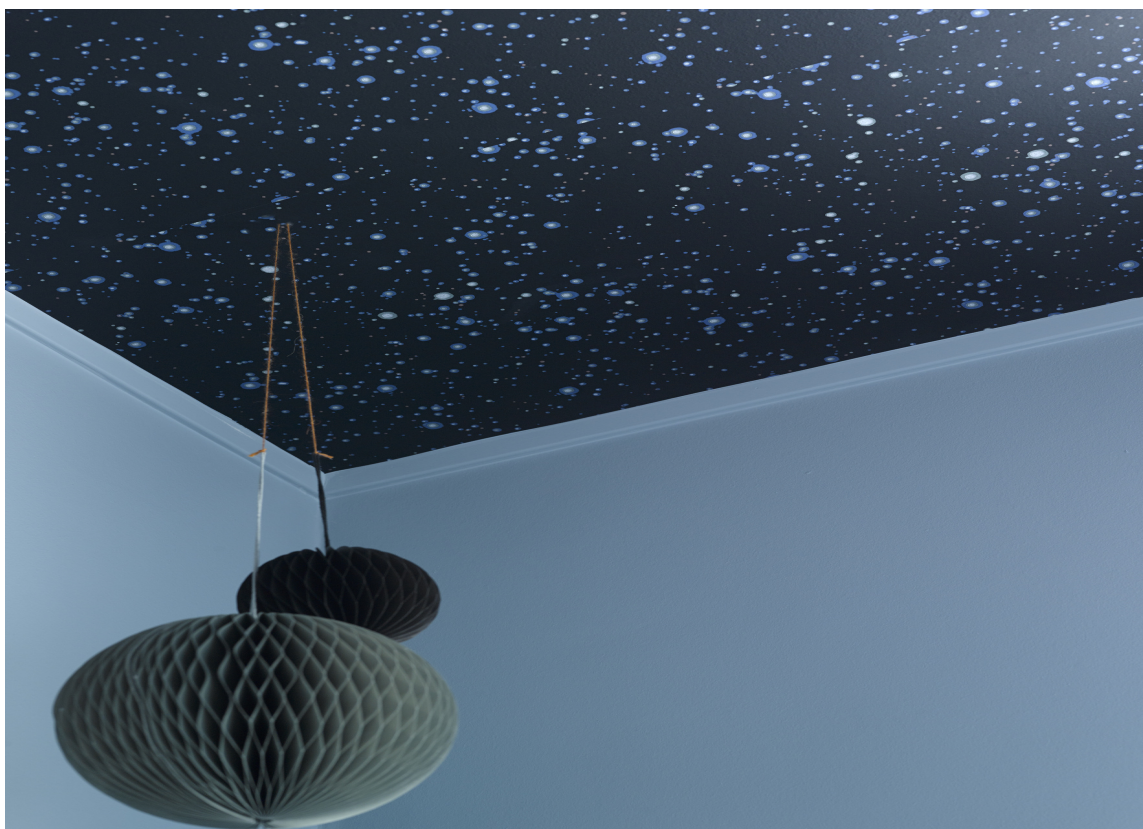
STJERNEHIMMEL I TAKET: Bruk takflaten aktivt. Det er som om rommet ikke har tak – bare himmel!