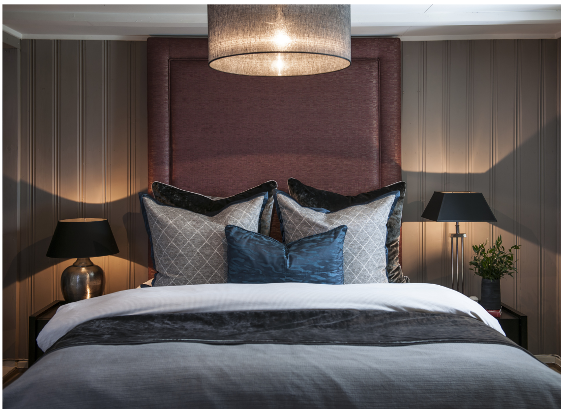
SENGEGAVL MED STREKK: La sengegavlen gå helt opp, for å øke følelsen av takhøyde.