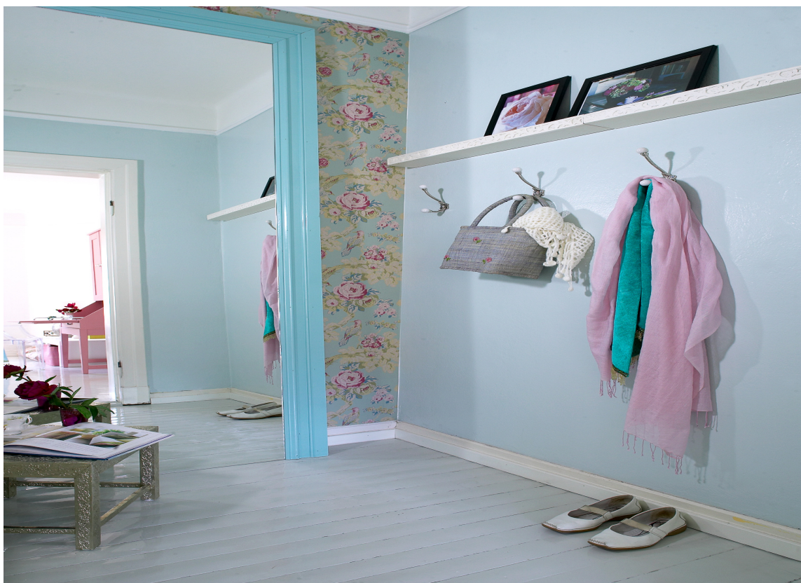
SPEIL ELLER DØRÅPNING? Speilet har ikke ramme nederst, slik at rommet speiler seg helt ned. Effekten er stor!