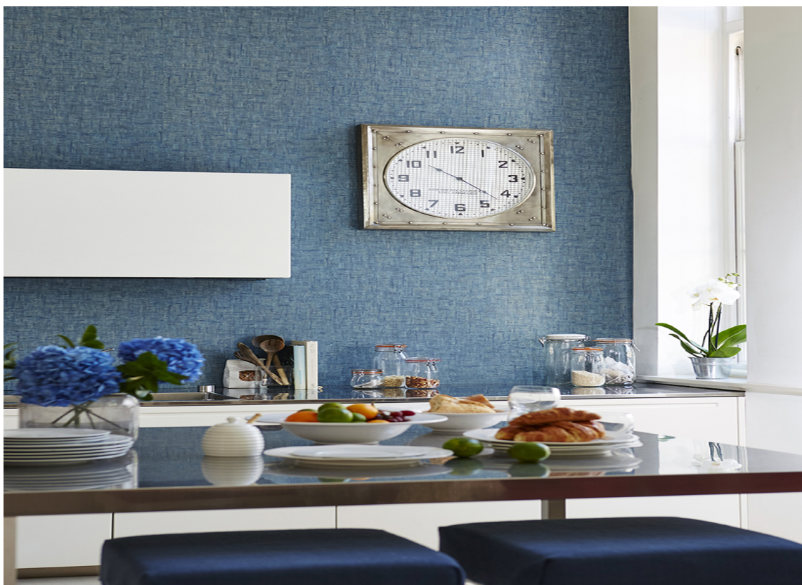
TAPETFRELST: Du kan få blå vegger med tapet også. Her er et tapet fra kolleksjonen Tresilo fra Harlequin, som føres av Tapethuset i Norge.

– Blått er nydelig på tapet. Det er mykere og gir en helt annen varme. Det passer veldig godt på for eksempel soverommet, sier hun, og forteller at Fargerike selv kommer med en spennende tapetkatalog til soverom snart.