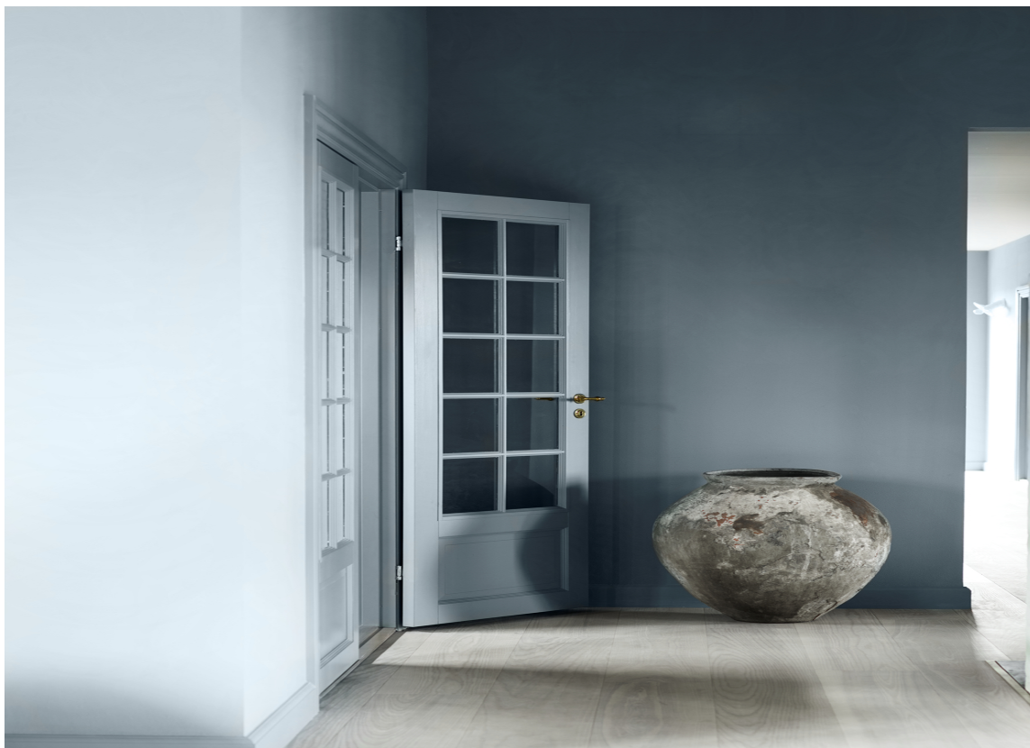
SIKKER VINNER: Når nordmenn endelig tar farger inn i hjemmet igjen, er det blått det går i. Veggfarge: Turkish Blue fra Flügger.