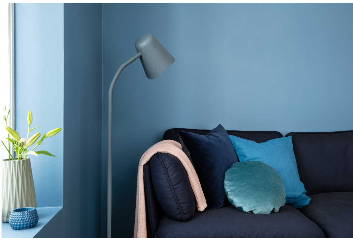
KLAR FOR FARGER: Flere våger seg bort fra hvite og grå vegger. Veggfarge: Midnatt fra Butinox Interiør.