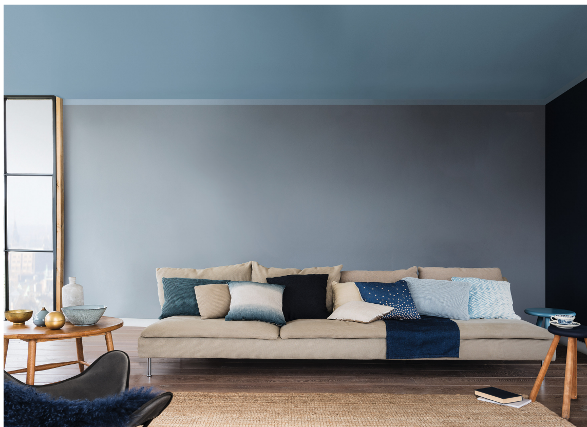
ÅRETS FARGE: Nordsjö tror på blått. De kåret den gråblå fargen Denim Drift til Årets farge for 2017.