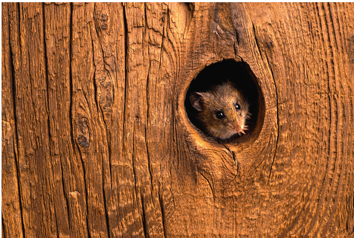
STORE SKADER: Disse små gnagerne kan lage store skader.