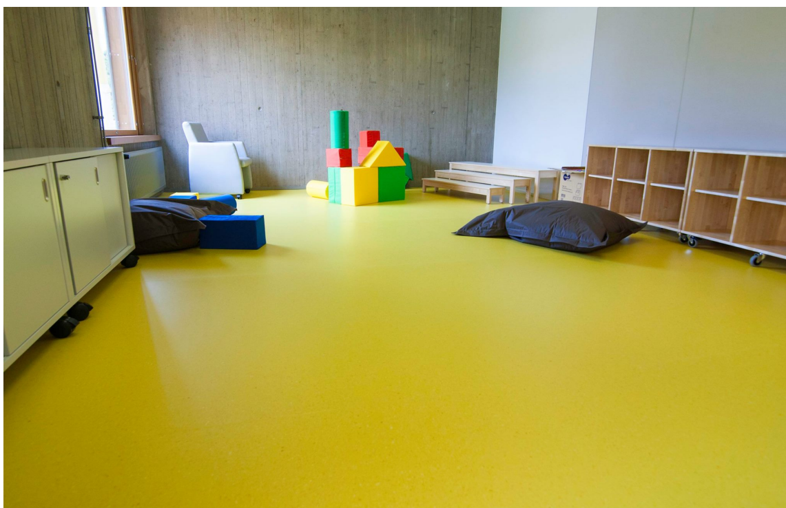
MILJØ PÅ GULVET: Gulvkjempen Ehrenborg lanserer nå et gulv med trinnlyd-dempende egenskaper. Gulvet er også uten PVC, klor og mykningsmidler.