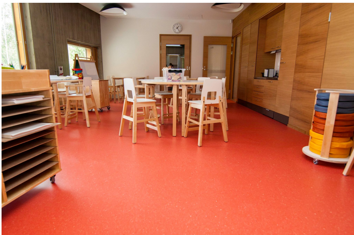
LETTSTELT GULV: Upofloor Zero Sound passer blant annet i offentlige miljøer, som sykehus, eldrecenter, skoler og barnehager som legger vekt på miljø og lydnivå.