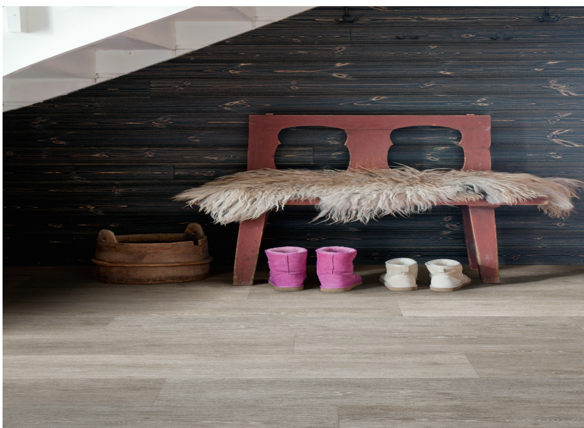
Klikkvinyl har de gode egenskapene til banevinyl, samtidig som det er enkelt å legge. Her fra Camaro Lock fra Polyflor.