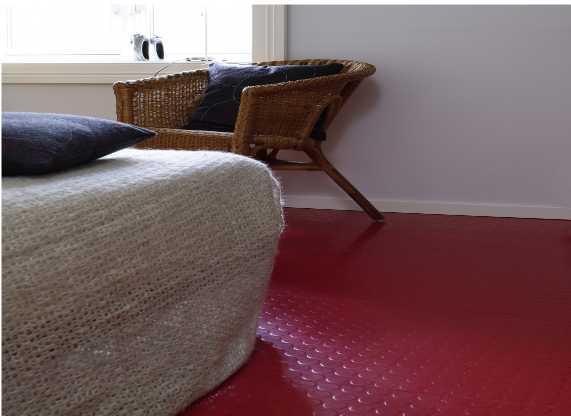
Gummigulv har mange gode egenskaper. Det tåler mye, har lang levetid og ser tøft ut. Her fra Polyflor.