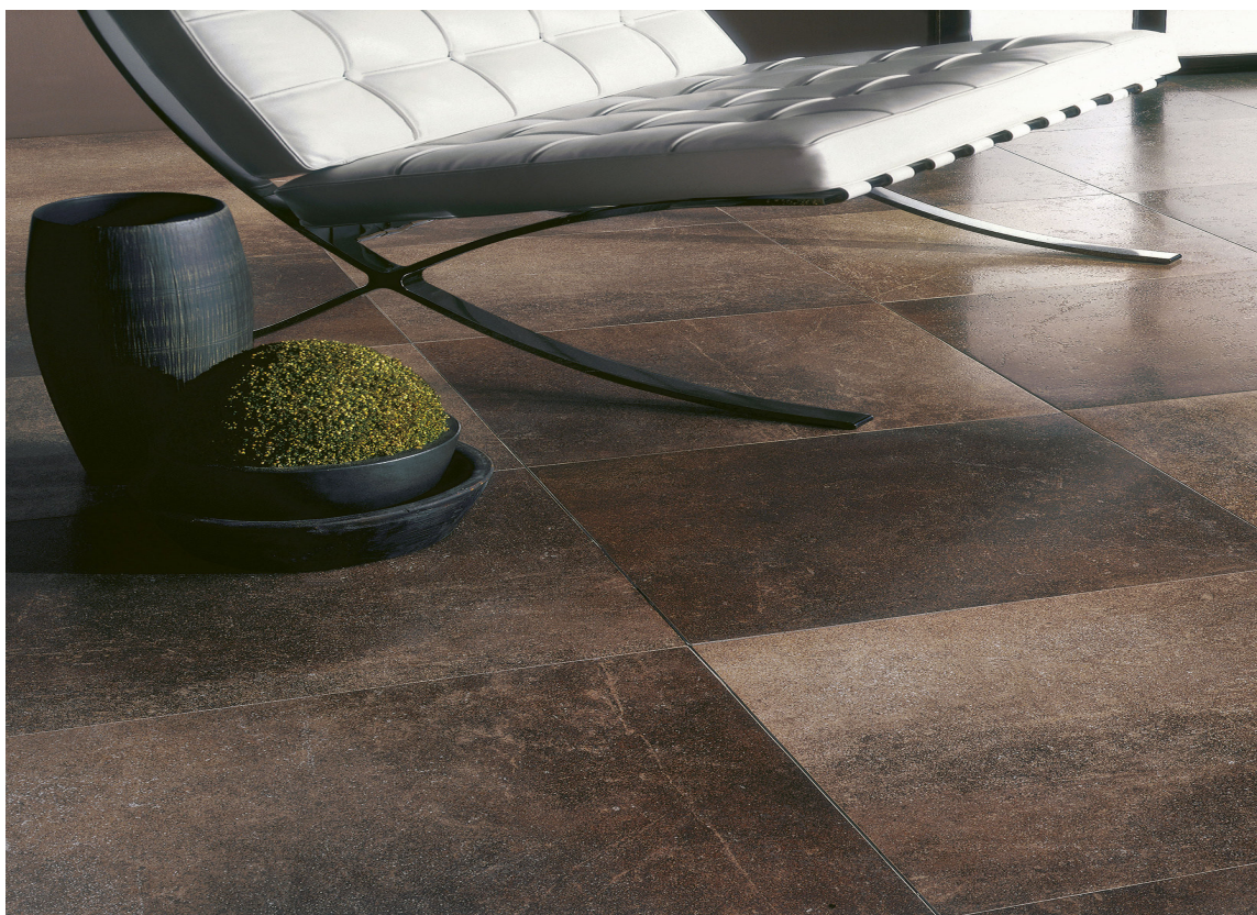
Fliser er et populært valg i gangen - med god grunn! Disse kalles Celtica og er fra Golvabia.