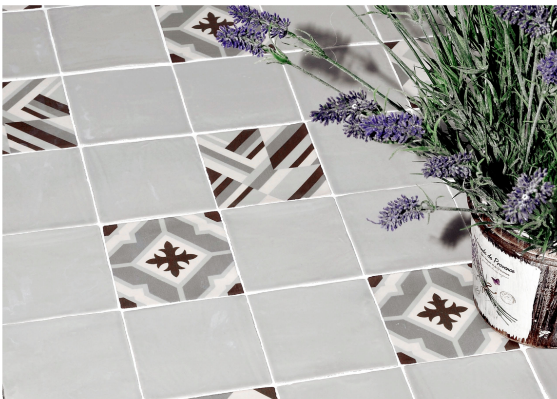
Det finnes mange muligheter når det kommer til fliser. Mønstrete fliser er populært og kan gjøre underverker for gangen din. Disse er fra Bohem-kolleksjonen til Golvabia.