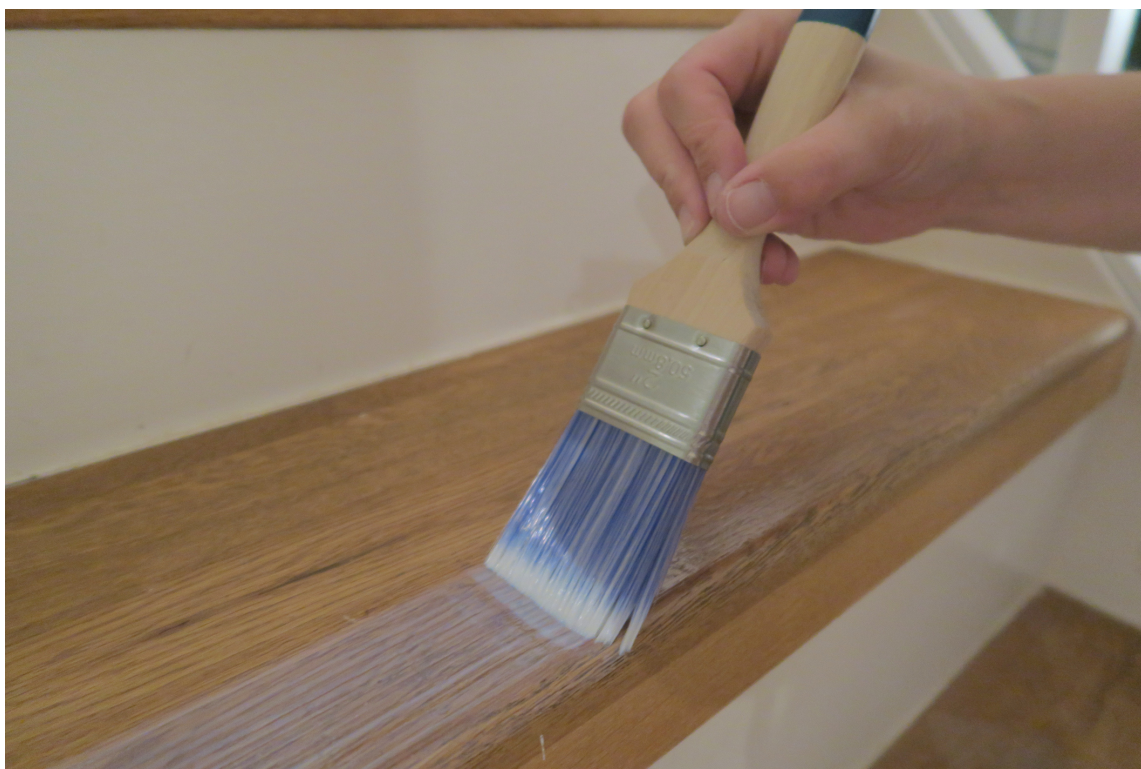
Antiskli-lakken fra Alanor påføres enkelt med en pensel. Du kan lakkere hele trinnet eller bare nesetippen.