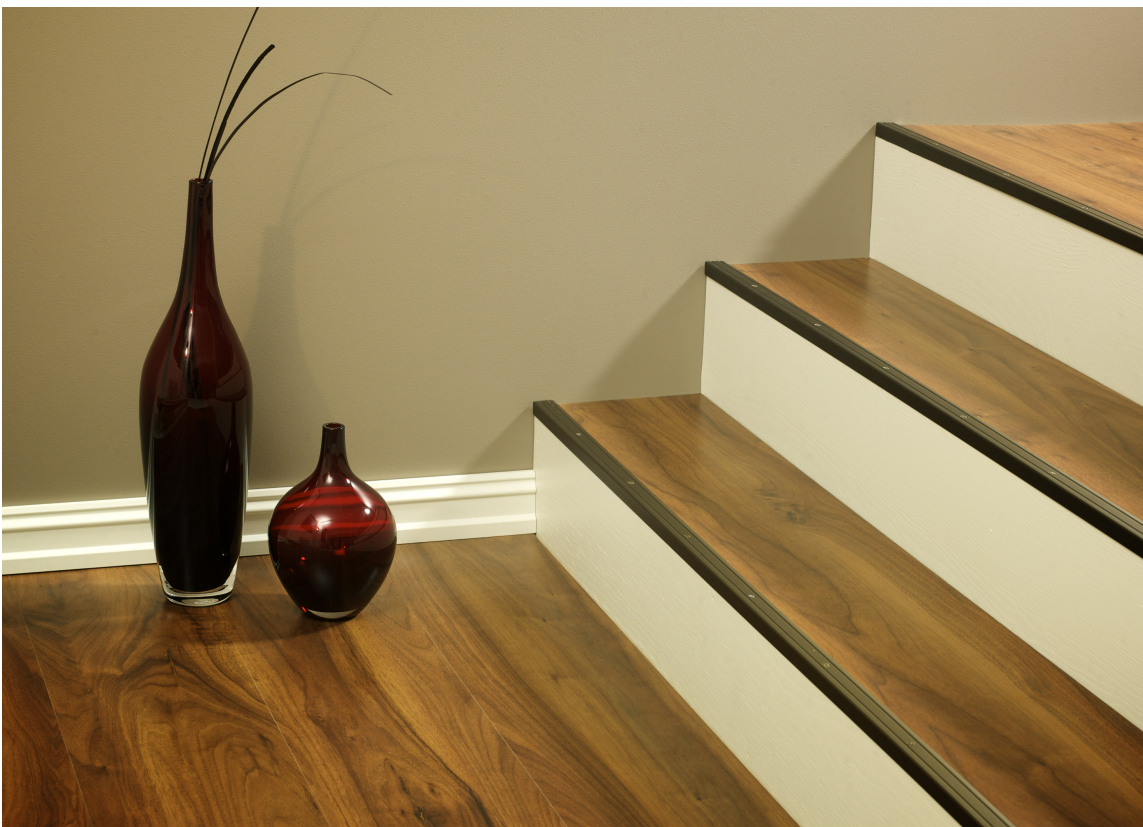
Trappeneser finnes i mange ulike materialer, farger og fasonger.