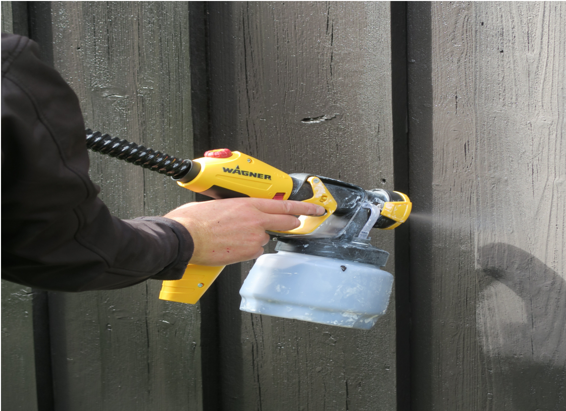
Med Wagners nye folkesprøyte kan alle slå seg løs på husveggen.