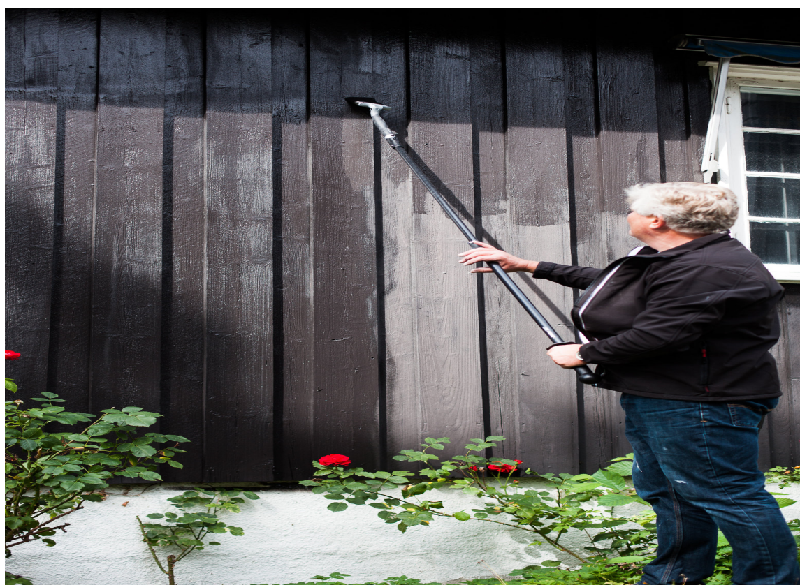
Verktøyspesialisten anbefaler å ha en bred pensel tilgjengelig for å etterstryke.

– Ja, det er gøy å bruke sprøyte. Denne modellen har trinnløs regulering med høyt og lavt trykk. Husk at ved sprøytemaling kreves mer forberedelser. Det som ikke skal males må dekkes til, sier Rustan.