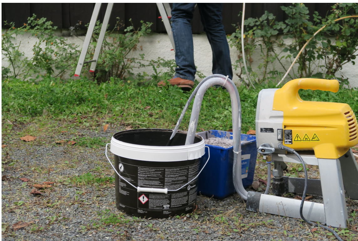
Den dyrere varianten av sprøyta suger opp maling fra spannet på bakken, slik at selve sprøyta blir lettere å holde.