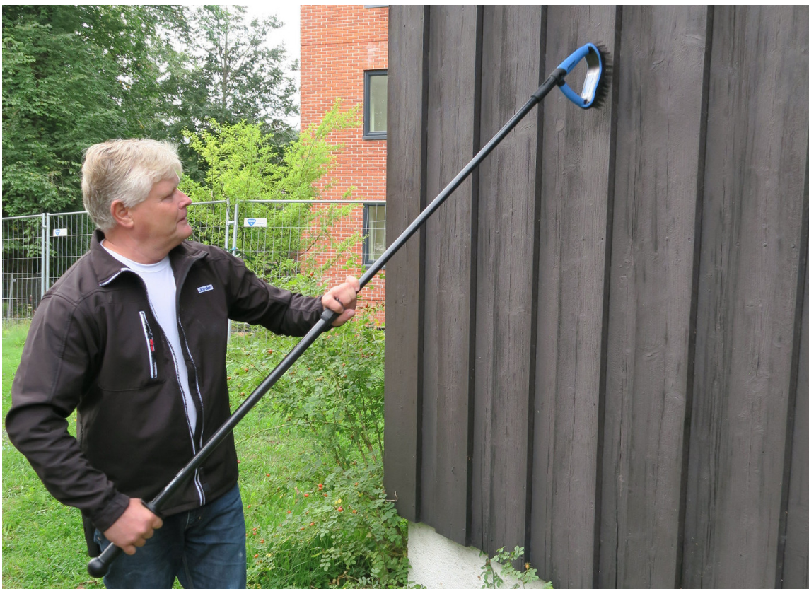
Maling og løse rester må skrapes av husveggen før den kan males.