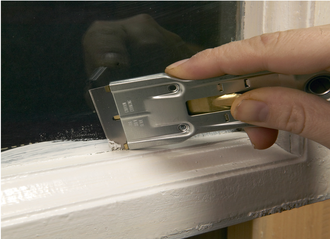
Får du maling på vindusglasset, er redningen nær. En vindusskrape fjerner malingen raskt.