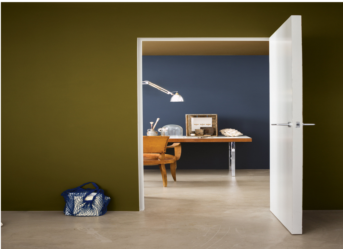
La døren inn til naborommet stå åpen når du tester veggfargen.