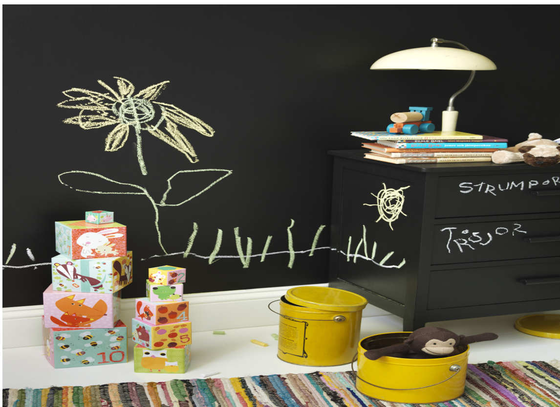
Hva med å male en hel vegg – og møbler – med tavlemaling? Da blir det garantert mye flott kunst.