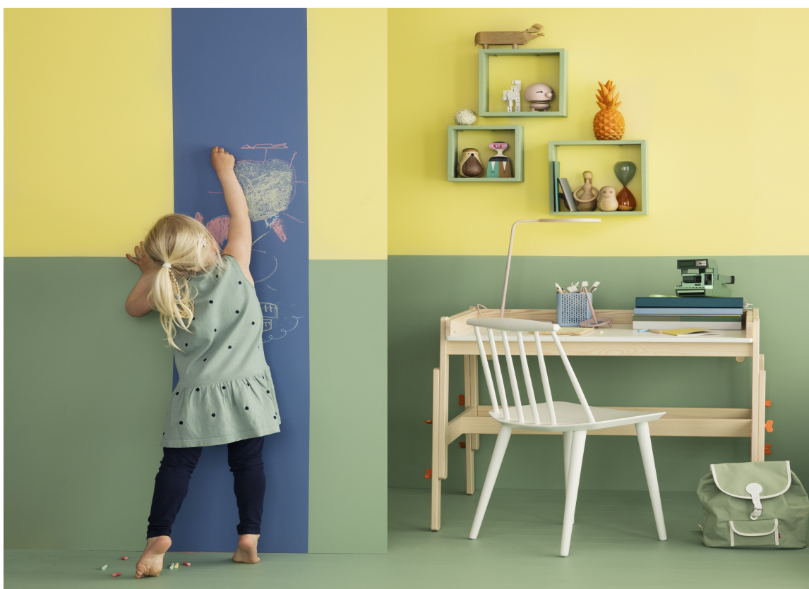
Skap soner på vegg på barnerommet der det er lov til å tegne og skrive. Barn elsker å tegne rett på vegg! Tavlemaling fra Butinox Interiør.

Et annet alternativ er selvklebende tavlefolie.