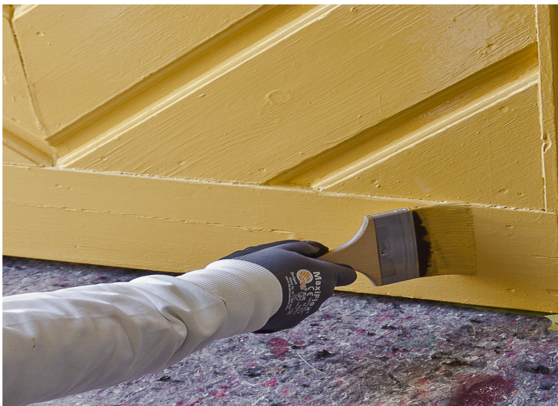
GJØR NOE EKSTRA: Det er trendy å gjøre noe ekstra ut av inngangspartiet. Å male inngangsdøren kan gi huset ny energi.