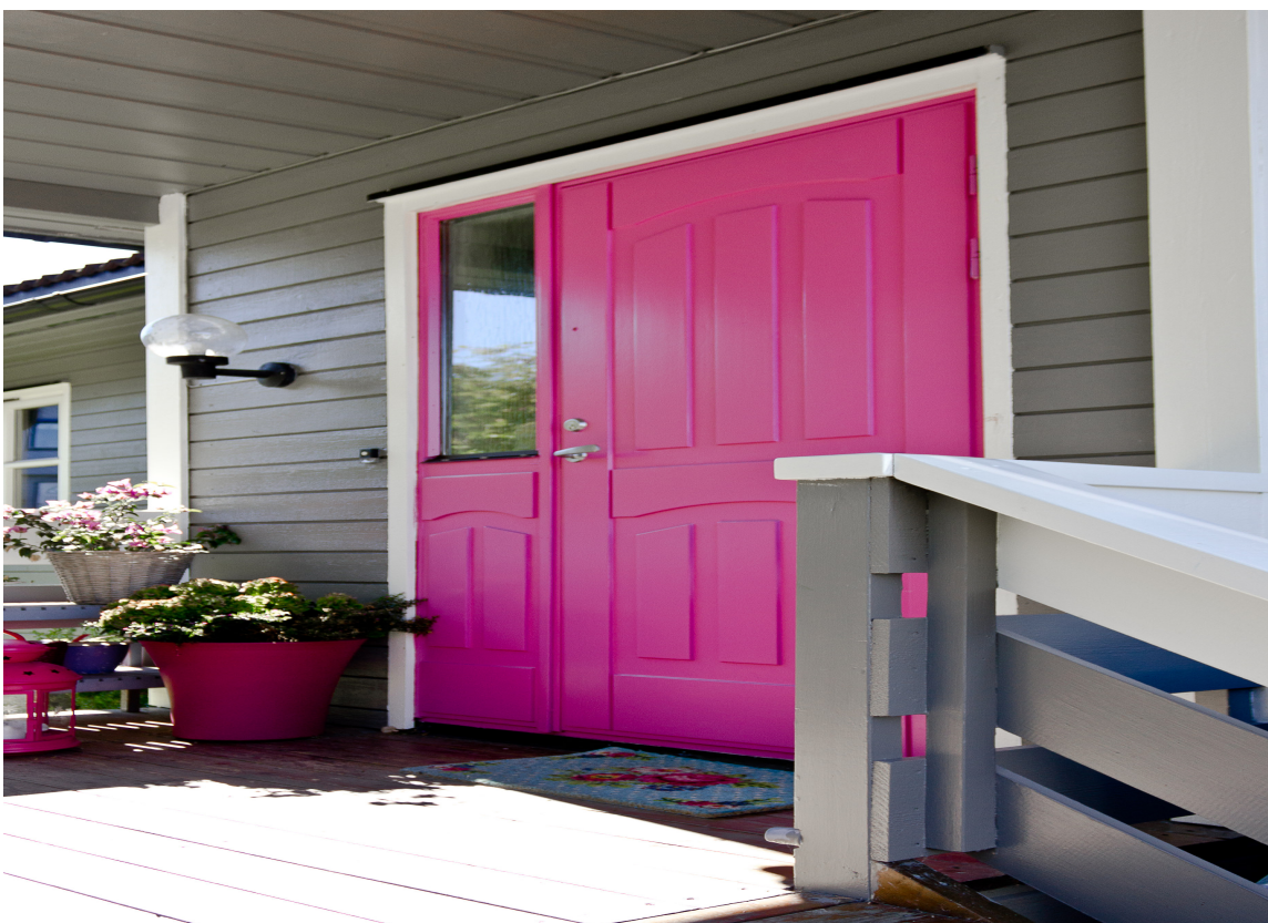
FARGERIK VELKOMST: En rosa dør frisker opp et grått hus.