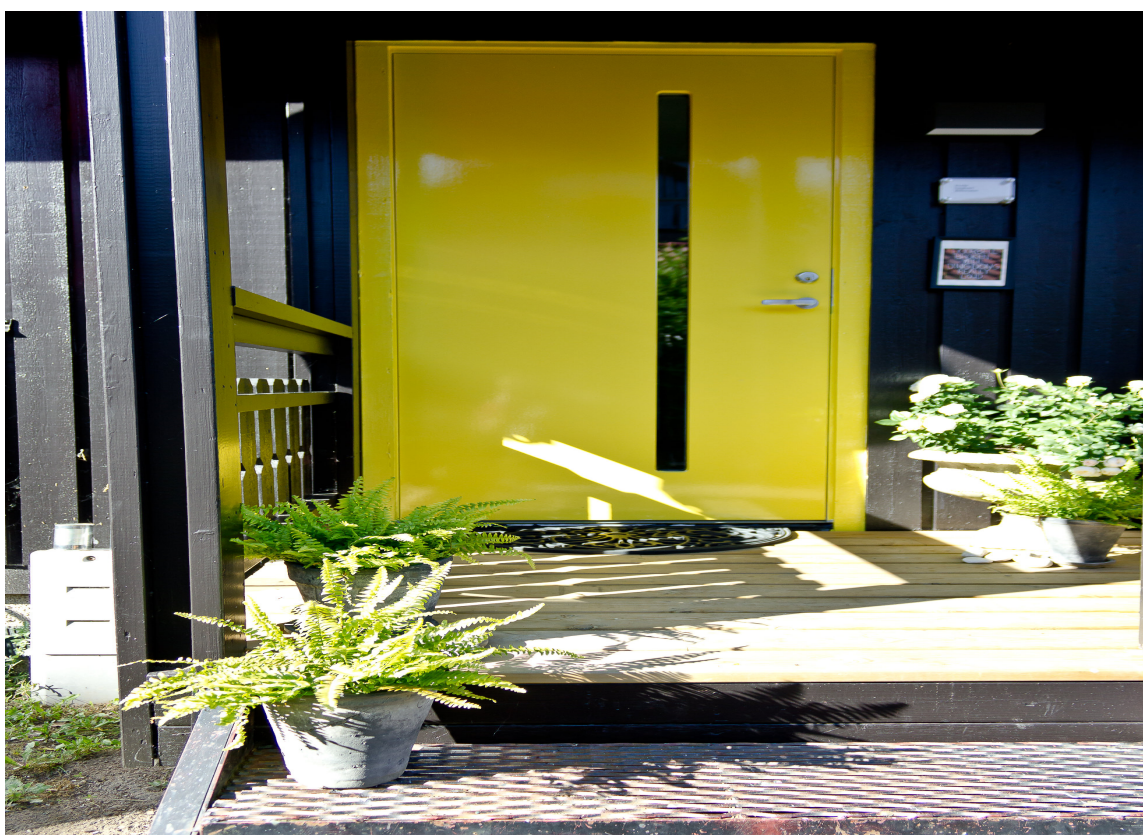
GULT ER KULT: Den gule døren står flott mot de mørke veggene.