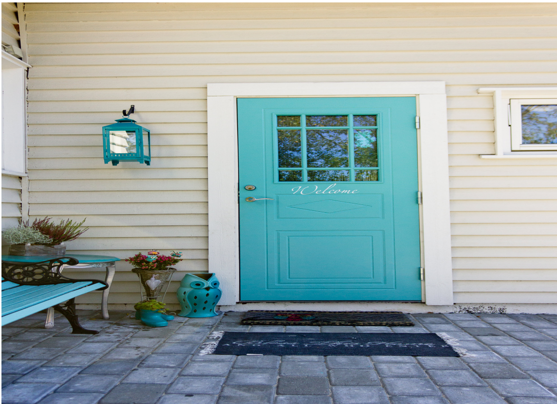
SETT LITT FARGE: Å male inngangsdøren er noe alle kan gjøre. Litt planlegging og fantasi, så kan vi skape magi med farger.