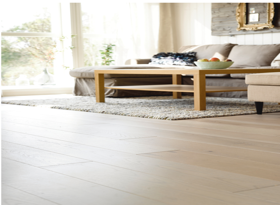
Mange velger å pusse opp innendørs om sommeren. Mer penger, fridager og naturlig lys er blant grunnene til at det kan være lurt.