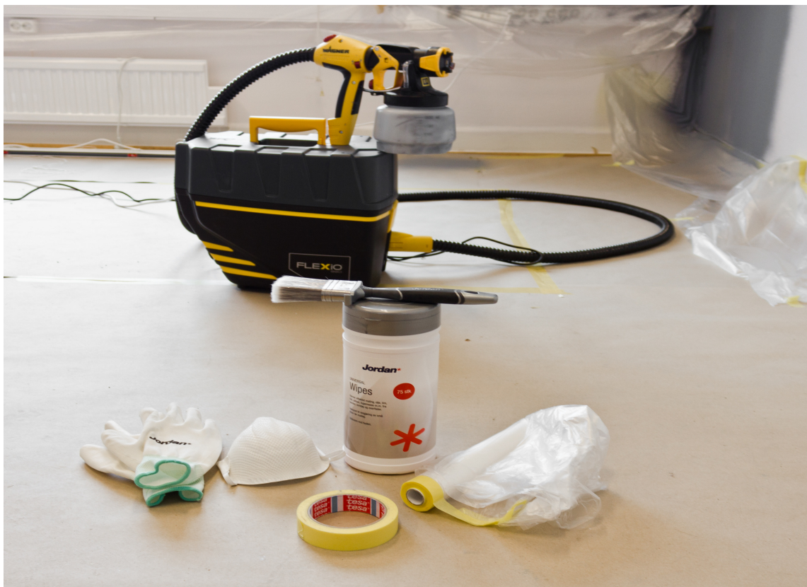
UTSTYR: Raskt malt med riktig sprøyteutstyr.