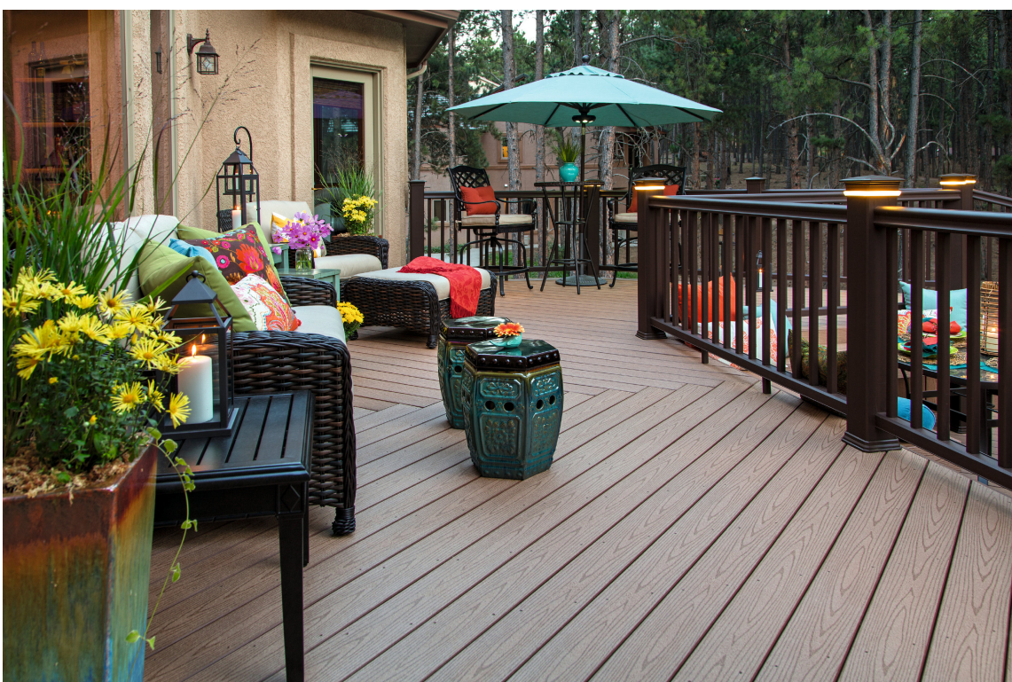
Etter behandling med en fargeforyrer blir komposittmaterialet vannavvisende og beskyttet mot flekker.