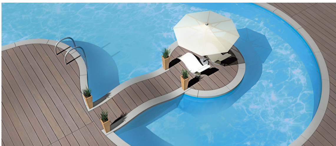
Også trekompositter utsettes for solbleking.