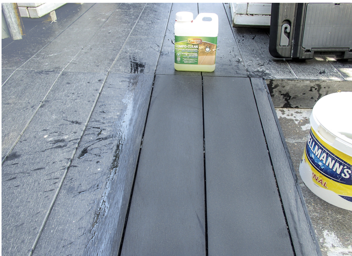
Med et spesialmiddel renses og avfettes alle typer trekompositter.