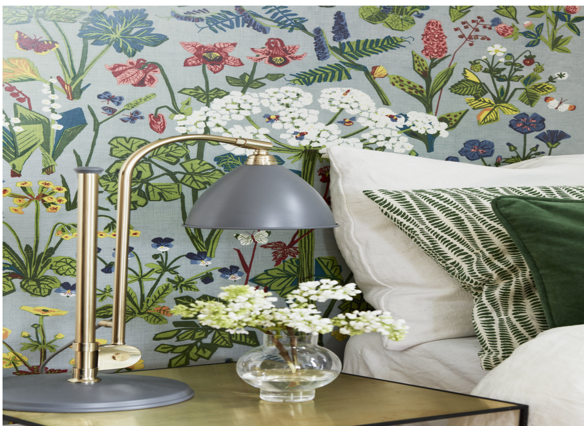
«Aurora» gjør seg på soverommet, synes Torkildsby. Den grå bunnfargen roer ned inntrykket. Med en gardin fra tak til gulv i en av rødfargene blir det i følge henne perfekt.