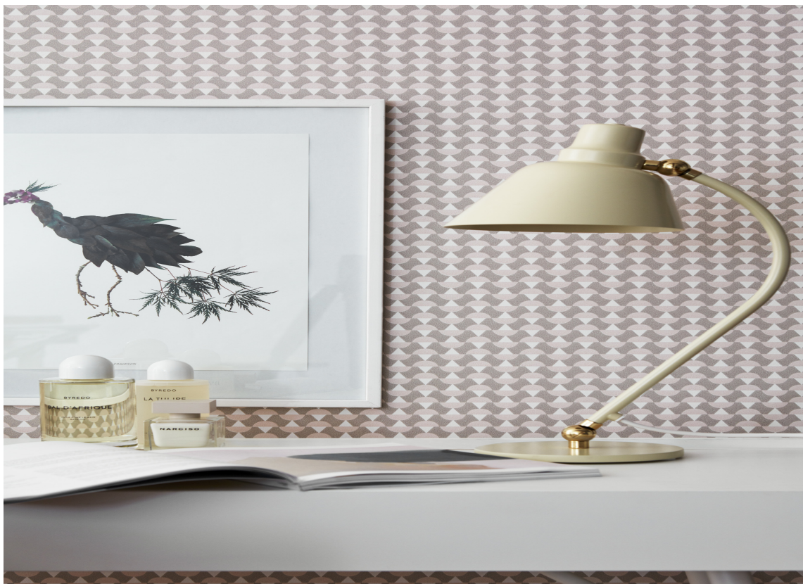
Arne Jacobsen har et formspråk som appellerer til mange. Mønsteret «Arne» finnes i flere farger.